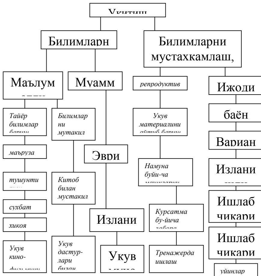
1-расм. Ўқитиш методларининг таснифи

Таълимнинг муаммоли методларидан фойдаланишда материални узлаштириш ўқувчи тафаккурининг натижаси бўлади. Аммо ўқитувчилар шуни эсда тутишлари керакки, ўқувчилар узларича ҳамма нарсани «кашф этиш»га ва урганиб олишга кодир эмаслар. Улар ўқитувчи раҳбарлигида хулоса чикаради, коидаларни таърифлайди. Шу сабабли таълимнинг муаммоли методларидан фойдаланишда ҳам ўқитувчининг тушунтириши уз аҳамиятини йқотмайди.