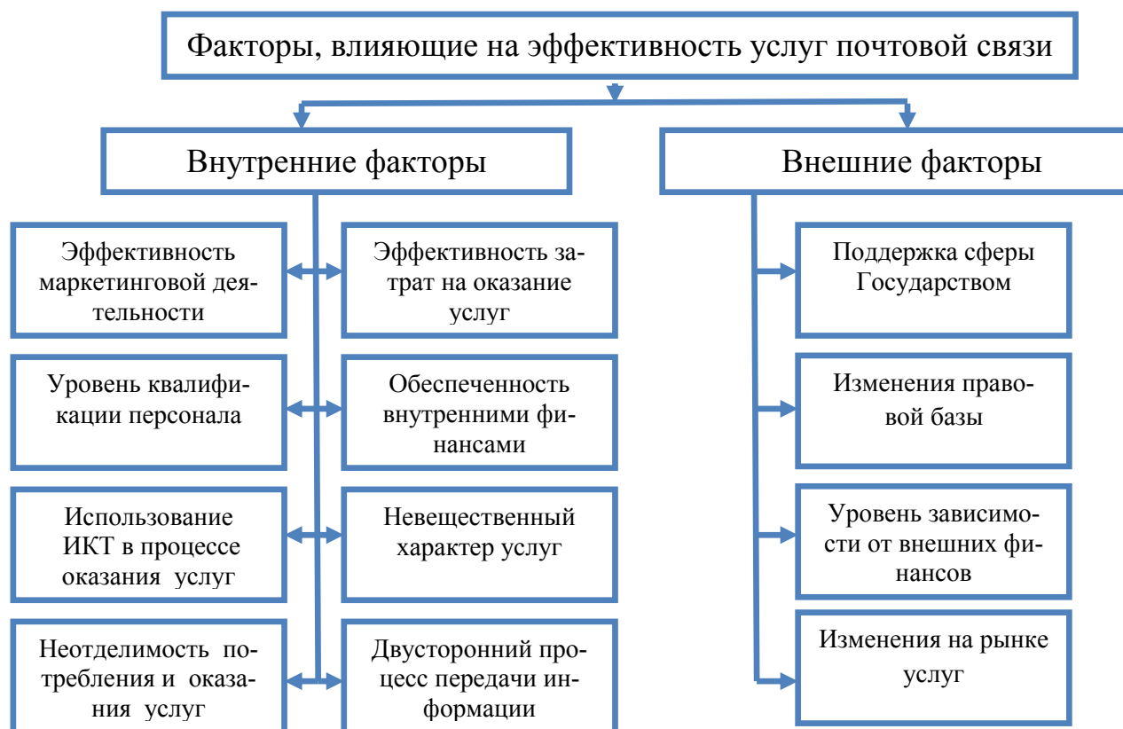
Рис. 1. Факторы, влияющие на эффективность услуг почтовой связи

К примеру, в 2009 г. с целью своевременной доставки пенсионных выплат, предупреждения краж и эффективного использования денежных средств было предложено постепенно передать функцию доставок пенсионных выплат учреждениям «Халк банки».