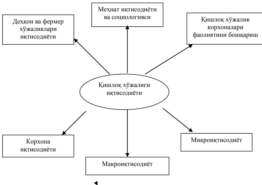
1.1- расм. «Қишлоқ хўжалиги иқтисодиёти» фанининг фанлараро боғлиқлиги

Республикаимизда бозор муносабатларига ўтиш даврида бу фанни билмасдан туриб деҳқон ва фермер хўжалиги фаолияти, қишлоқ хўжалиги иқтисодиётини ривожлантириб бўлмайди.