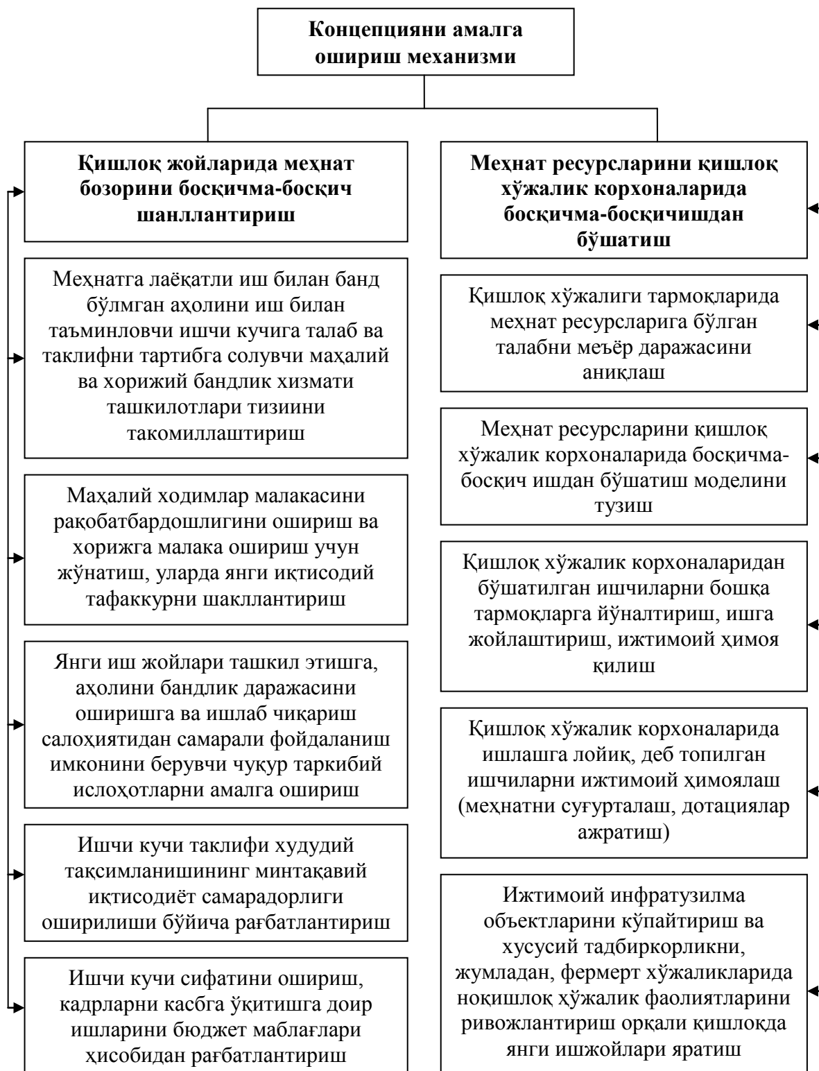
3.6.1-расм. «Қишлоқ жойларда аҳоли бандлигини таъминлаш концепцияси»ни амалга ошириш механизми

Мамлакат иқтисодиёти реал сектори ва ижтимоий соҳа тармоқларининг умумиқтисодий кўрсаткичлари, макроиқтисодий шароитдан келиб чиққан