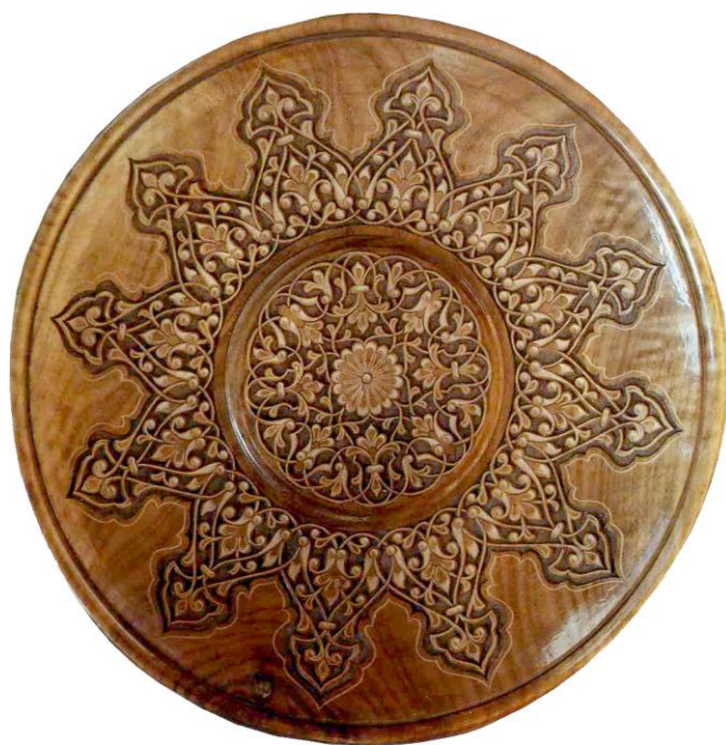
YOG'OCH O'YMAKORLIGI LAGANI