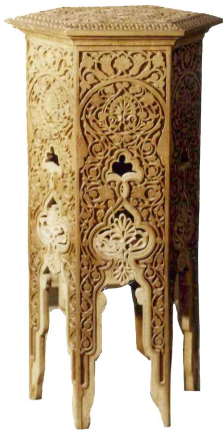
YOG'UCH O'YMAKORLIGI KURSISI