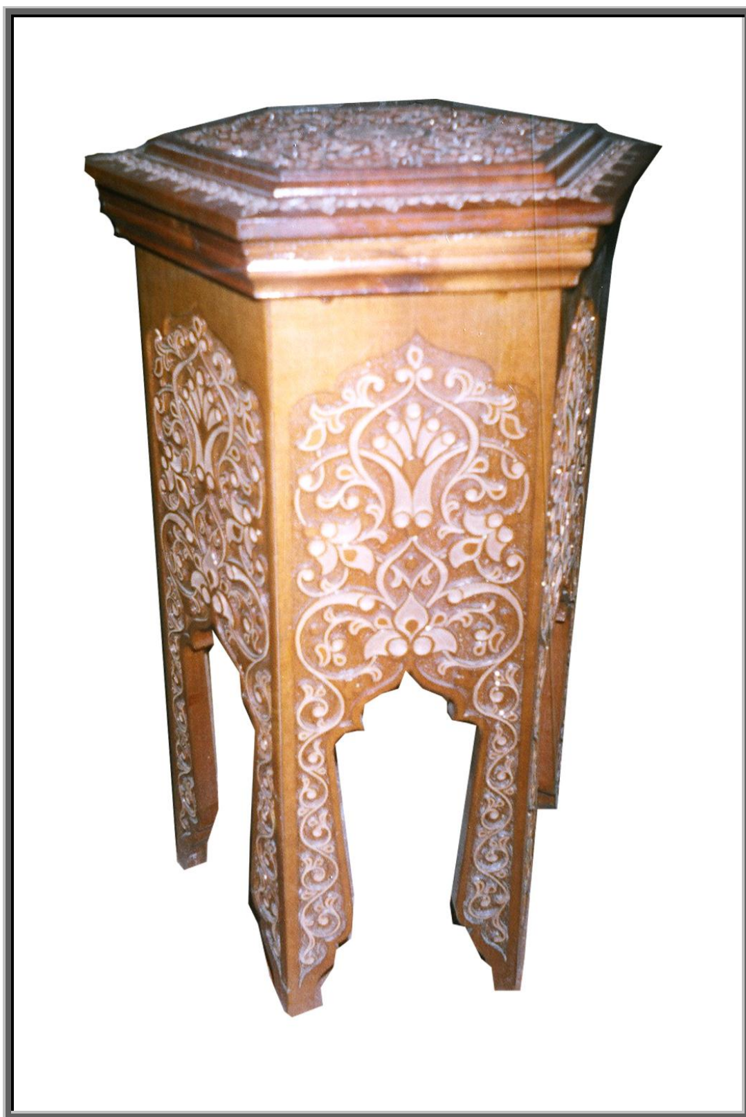
YOG'OCH O'YMAKORLIGI 6 RAHLI KURSI