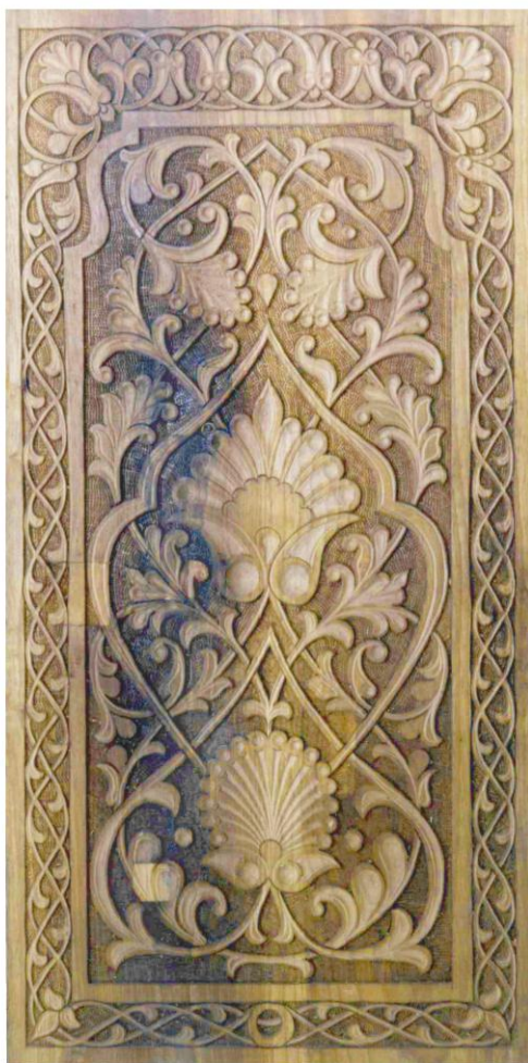
YOG' OCH O'YMAKORLIGI QUTICHA QOPQOG'I