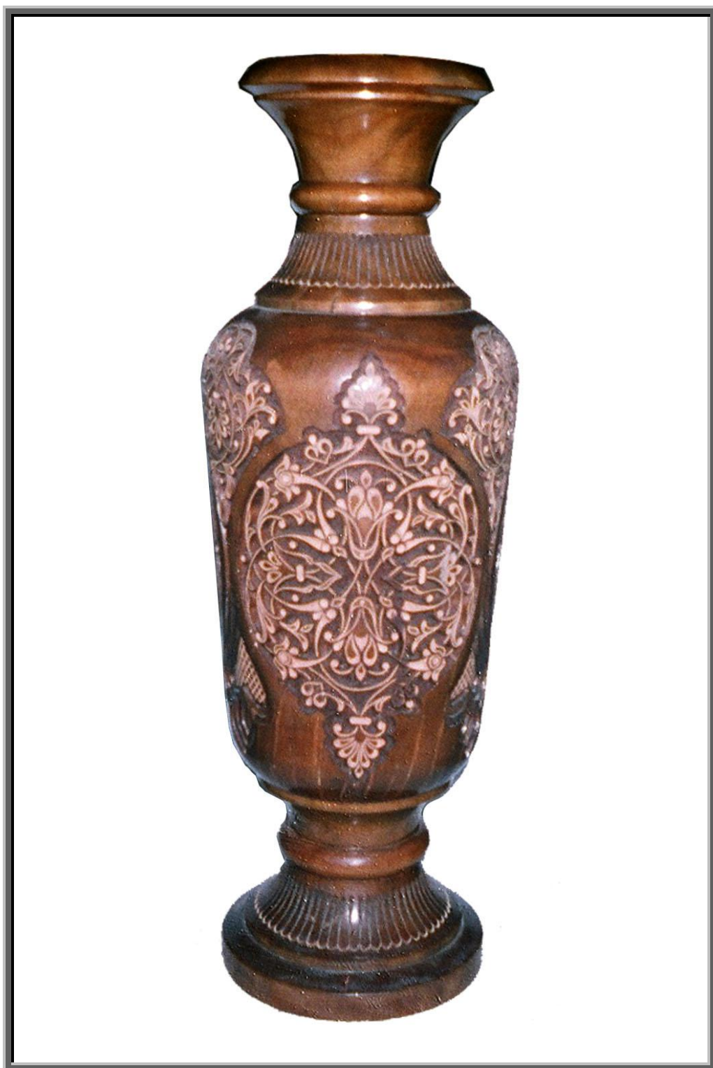
YOG'OCH O'YMAKORLIGI KO'ZASI