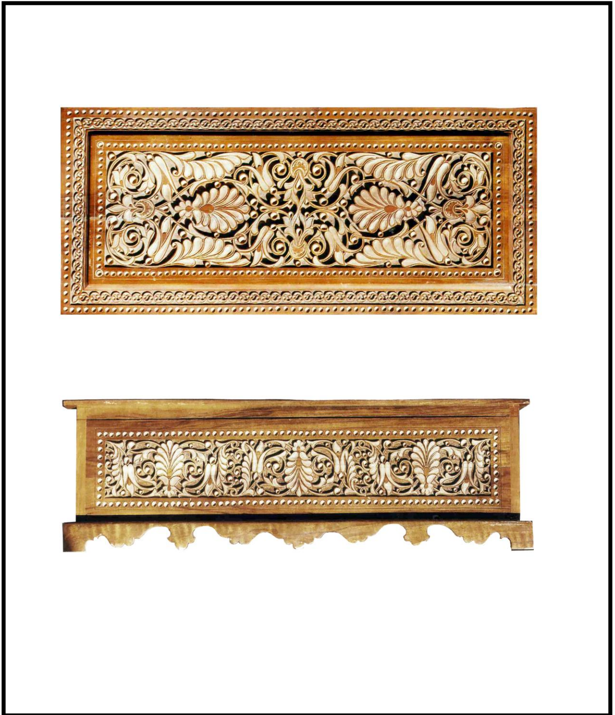
YOG'OCH O'YMAKORLIGI QUTICHASI