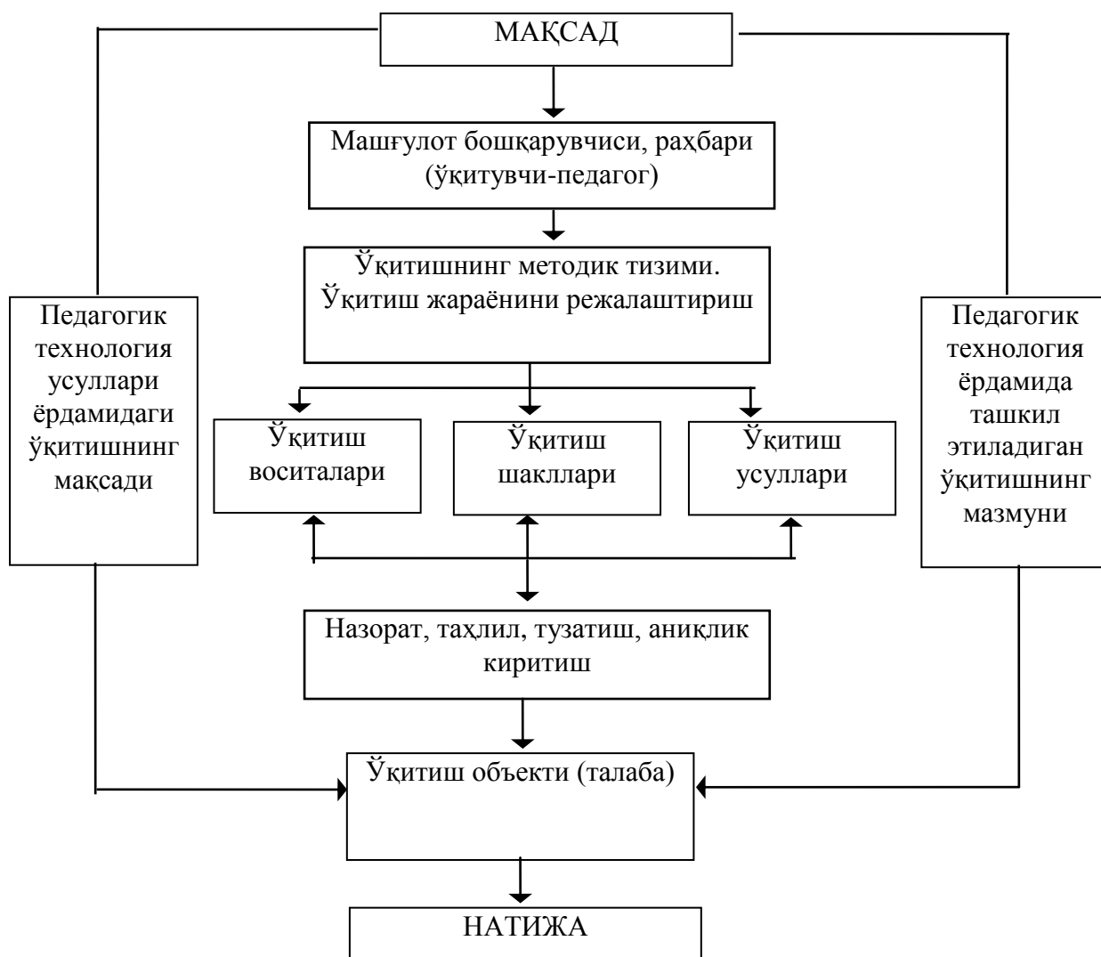
2.4. расм. Педагогик технология билан ўқитишдаги услубий тизим

Демак, педагогик технология асосида дарс ўтиш педагогик тизимни лойихалаштириш сифатида таълим жараёнининг яхлитлигини, унинг мақсад, вазифаси амалга ошириш шаклларини, услубларини ҳамда укувчилар фаолиятини бошқариш билимини назорати ва текширишнинг узвийлигини таъминлайди