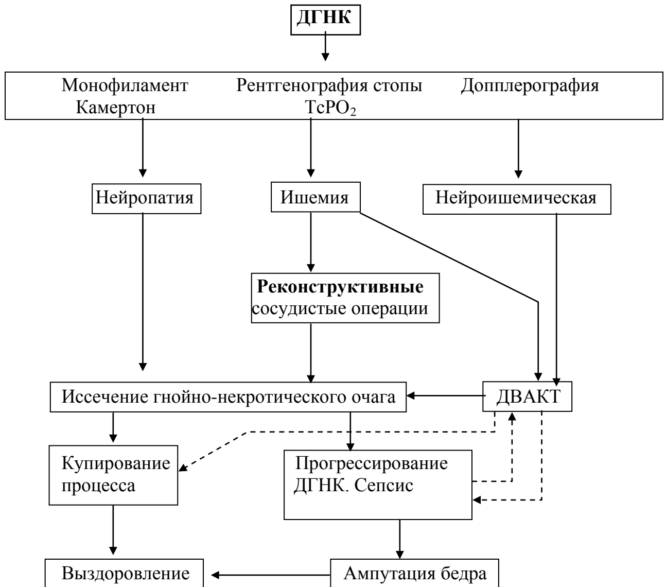
Рис.3. Алгоритм лечебно-диагностических мероприятий при ДГНК.

для использования в клинической практике следующий алгоритм лечебно-диагностических мероприятий (рис. 3).