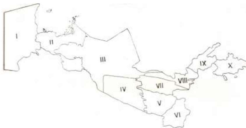
Естественнo-иcтoричecкoe районирование Узбекистана: I – Устюртский округ, II – Наманганский, III – Кашгарский, IV – Наманганский, V – Самаркандский, VI – Ферганский, VII – Среднеазиатский, VIII – Голыстанский, IX – Чирчик-Ангренский, X – Ферганский.

Uzbekiston esa Turon provinsiyasiga kirib, G‘arbiy Osiyo, Eron-Turon erlari kichik xukmronligiga kiradi.