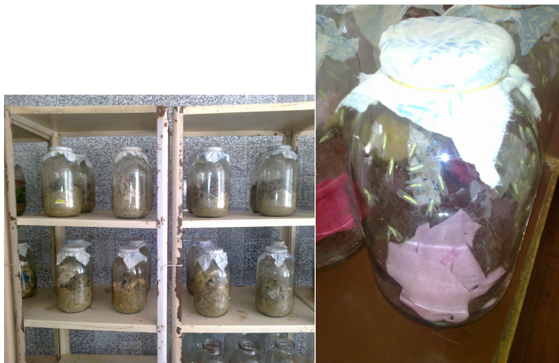
3.2-расм. Олтинкўзни кўпайтириш жараёнлари.

ҳисобида сочилади. Кейин катакчали садка ойна билан беркитилиб, ҳарорат ва ҳаво намлиги бошқариладиган термостатга кўчирилади. Иккинчи марта личинкалар беш кун оралатиб, яъни биринчи ёшдаги личинкаларнинг туллаш даврида озиклантирилади. Иккинчи ёшдаги личинкалар жуда хўра бўлиши туфайли дон куяси капалаги тухумидан ҳар бир катакка 14 мг ёки ҳар бир садкага 5,6 г солиш керак бўлади. Куя тухумларини биринчи марта озиклантирилгандаги усулда амалга ошириш керак. Иккинчи озиклантиришдан уч кун ўтгач, личинкалар учинчи марта