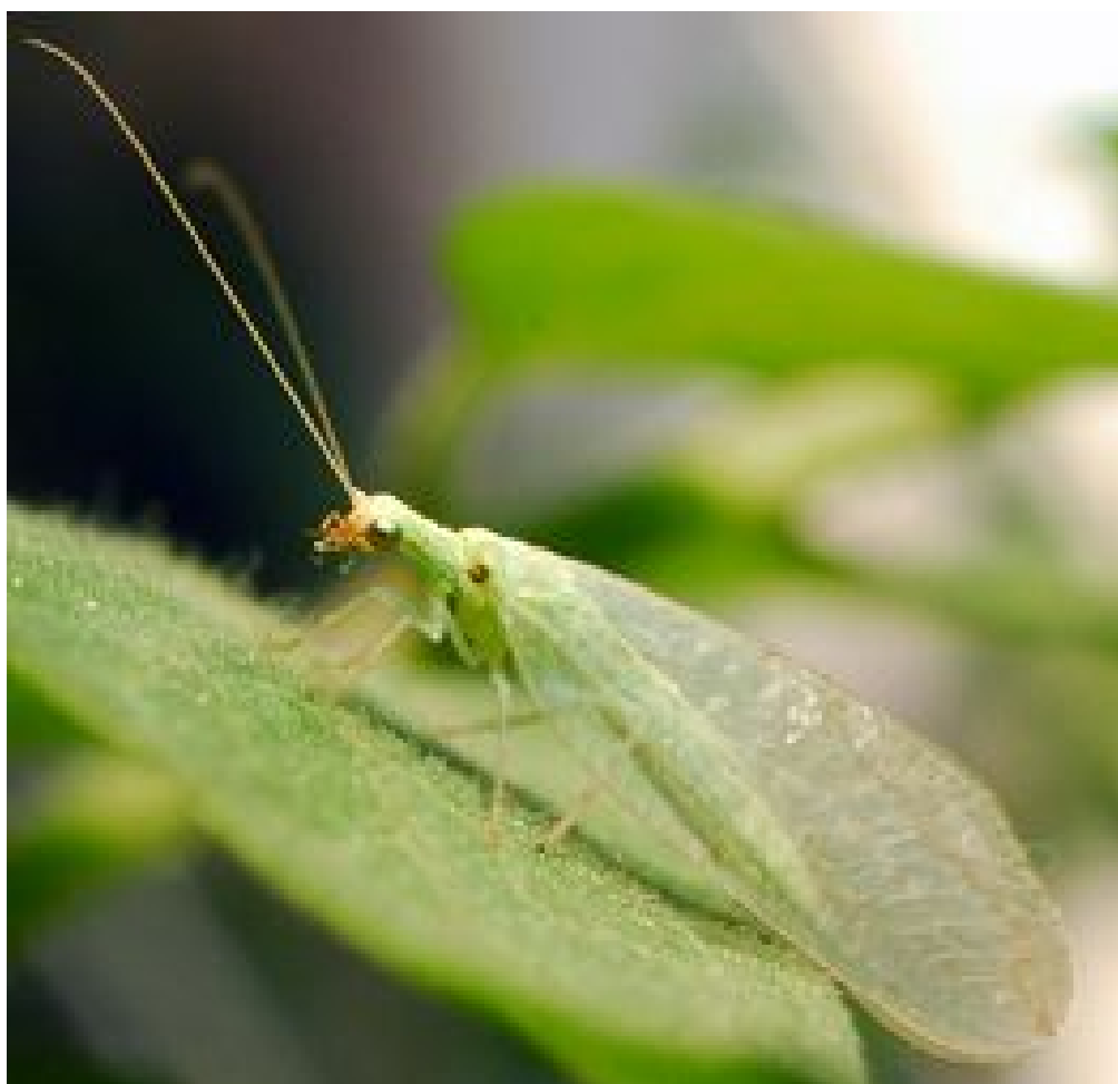
3.1-расм Оддий олтинкўз

Қанотлари рангининг яшилдан оч пушти рангга ўзгариши ҳашоратнинг диапаузага кирганини билдиради.