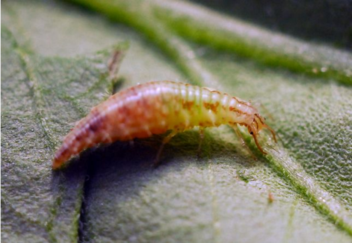
3.6- расм. Олтинкўз личинкаси.