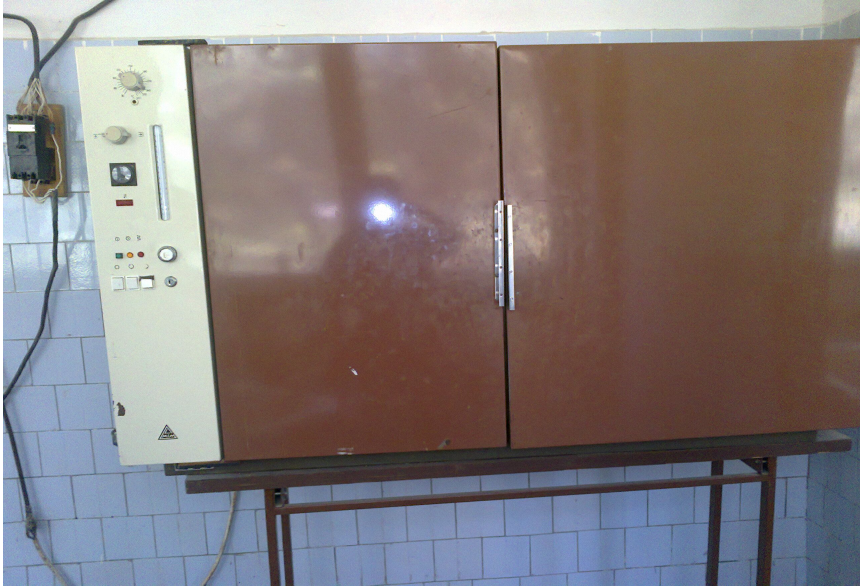
3.3- расм Олтинкўзни кўпайтириш жароёнида қўлланиладиган мослама.

Вояга етган ҳашаротларни озиклантириш учун асал ва пиво ачитқиларининг 40% ли автолизатидан фойдаланилади. Ҳаётининг дастлабки беш кунда ҳашаротлар фақат асал билан, сўнгра эса асал ва автолизат билан боқилади, улар садка деворларига навбат билан томизилади. Кичик поролон бўлакчаларига автолизат шимдирилгани маъқул. Автолизат тайёрлаш учун янги пиво ачитқиларини эмал кюветларга қуйиб, термостатда 50 0 С ҳароратда икки сутка тутилади. Тайёр бўлган автолизат маиший совутгичда 5-8 0 С ҳароратда кўпи билан 15 кун сақланади.