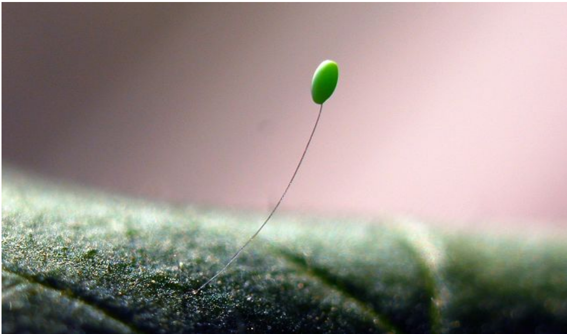
3.5-расм. Олтинкўз тухуми.

Бу ускуна қишлоқ хўжалиги экинларини зараркунандаларига қарши қўллаш