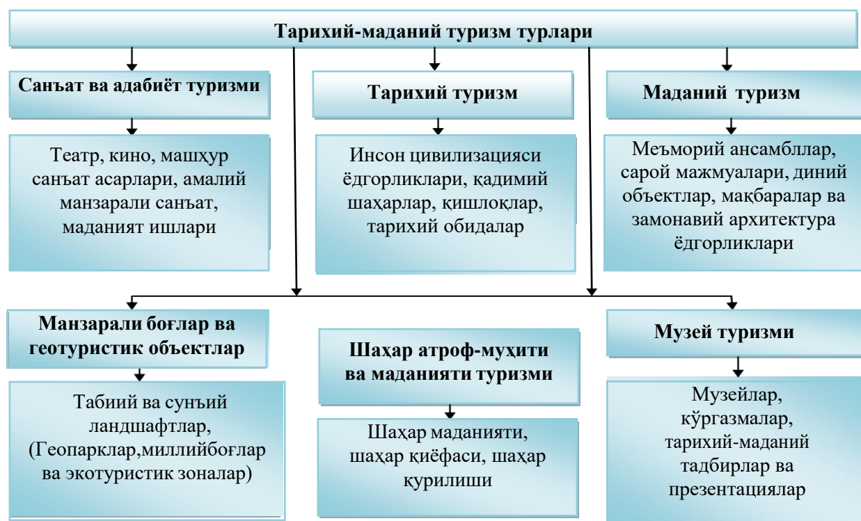
2-расм. Тарихий-маданий туризмнинг турлар бўйича таснифланиши 9

Илмий адабиётларда тарихий-маданий туризм турларининг хилма-хил таснифлари келтирилган. Амалга оширилган назарий тадқиқотлар ва макроиқтисодий таҳлил натижасида тарихий-маданий туризм турлари бўйича таснифлагичнинг такомиллаштирилган шакли таклиф қилинди (2-расм):