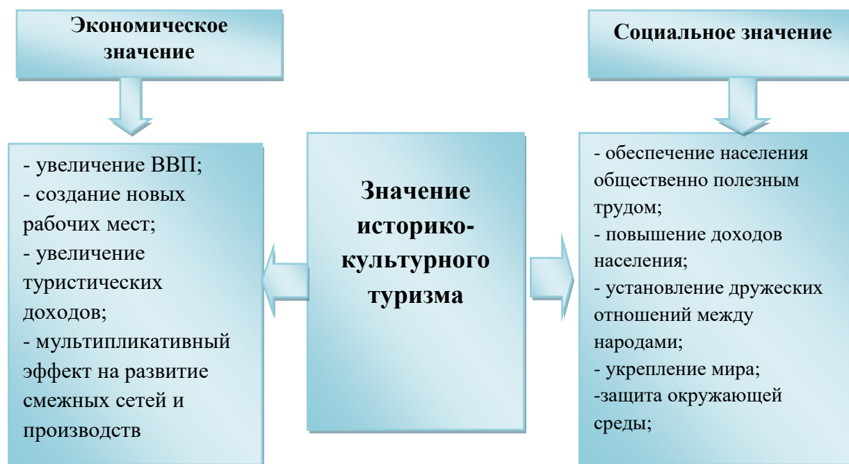
Рисунок 1. Социально-экономическое значение историко-культурного туризма 25

Основная причина, по которой уделяется особое внимание быстрому развитию историко-культурного туризма по странам мира, заключается в том, что данный вид туризма оказывает большое влияние как на социальное, так и на экономическое развитие страны. Раскрыта суть значения исторического культурного туризма в социальном и экономическом развитии страны (Рисунок 1).