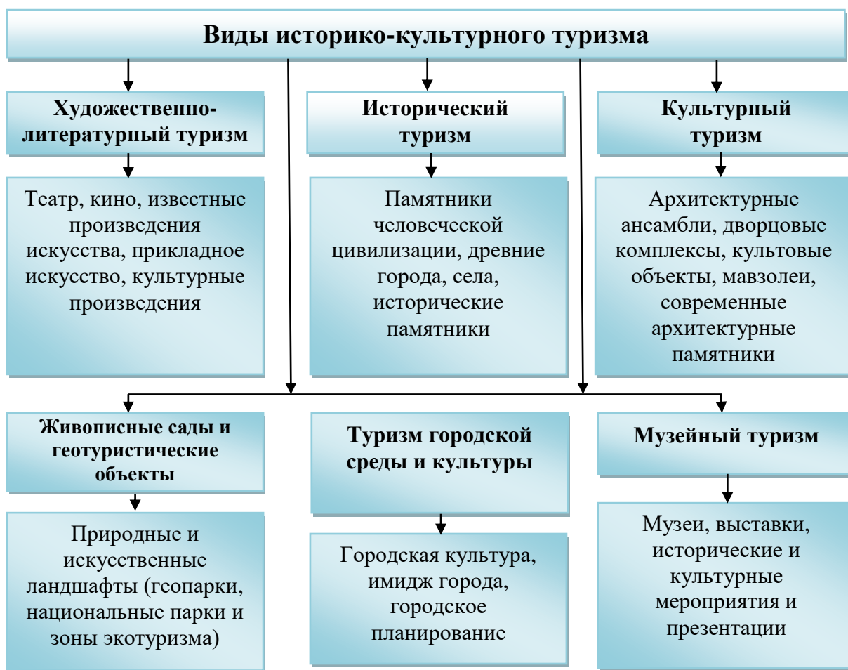
Рисунок 2. Классификация историко-культурного туризма по видам 27

В научной литературе представлены различные классификации видов историко-культурного туризма. В результате теоретических исследований и макроэкономического анализа предложена усовершенствованная форма классификатора видов историко-культурного туризма. (Рисунок 2).