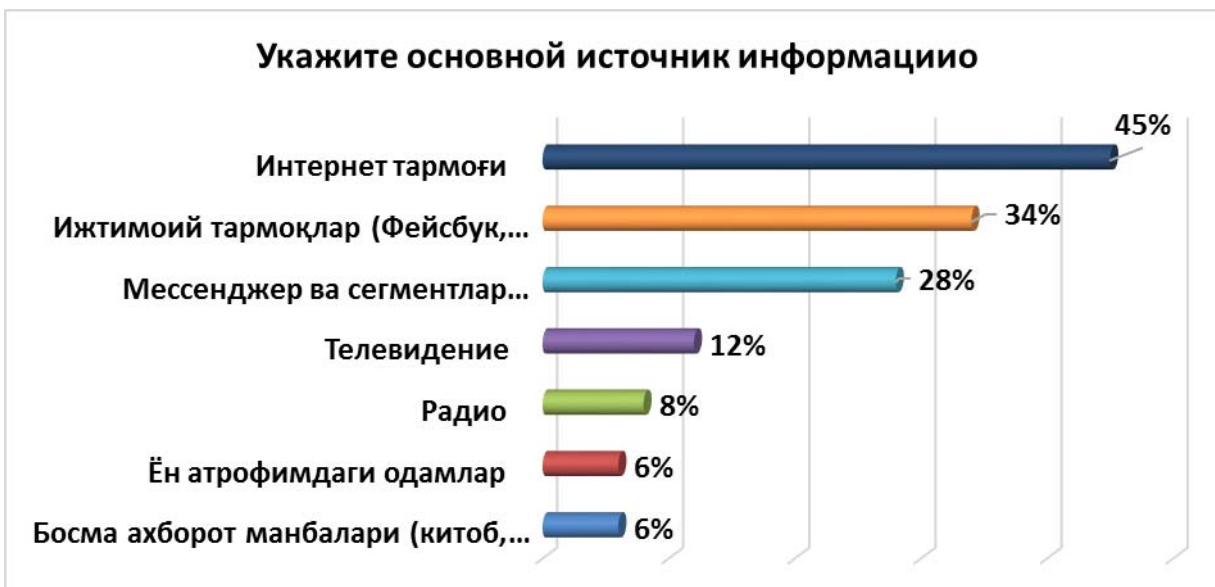
Рисунок 2. Что для вас является основным источником информации?

Из числа респондентов, принимавших участие в опросе 45% ответили, что основным источником информации для них является Интернет, а 34% респондентов в качестве основного источника информации назвали социальные сети. В то время как 28% респондентов в качестве источника информации указали различные мессенджеры и сегменты, только 12% опрошенных в качестве такого источника назвали телевидение. Более 6% респондентов заявили, что видят в качестве основного источника информации различные издания, а также окружающих их людей.