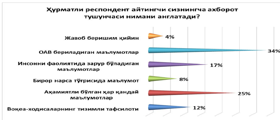
1-расм. Ўқувчи респондент айтишича, сизнингча, ахборот тушуниши нимага асосланади?

2021 йилнинг октябрь-ноябрь ойларида республикамизнинг бешта олий ўқув юртида, яъни Тошкент ахборот технологиялари университети, Самарқанд давлат университети, Тошкент вилояти Чирчиқ давлат педагогика институти, Фарғона давлат университети ва Ўзбекистон Миллий университетиде таҳсил олаётган ва фаолият олиб бораётган ёшлар ўртасида социологик тадқиқот ўтказилди, социологик тадқиқотда 1000 нафар респондент иштирок этишди.