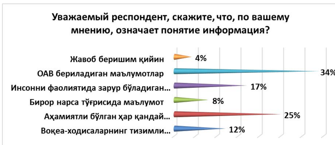
Рисунок 1. Уважаемый респондент, скажите, что, по вашему мнению, означает понятие информация?

В октябре-ноябре 2021 года был проведен социологический опрос среди молодежи, обучающейся в пяти вузах страны: Ташкентском университете информационных технологий, Самаркандском государственном университете, Чирчикском государственном педагогическом институте Ташкентской области, Ферганском государственном университете и Национальном университете им. Узбекистана. Ниже приведены итоги опроса.