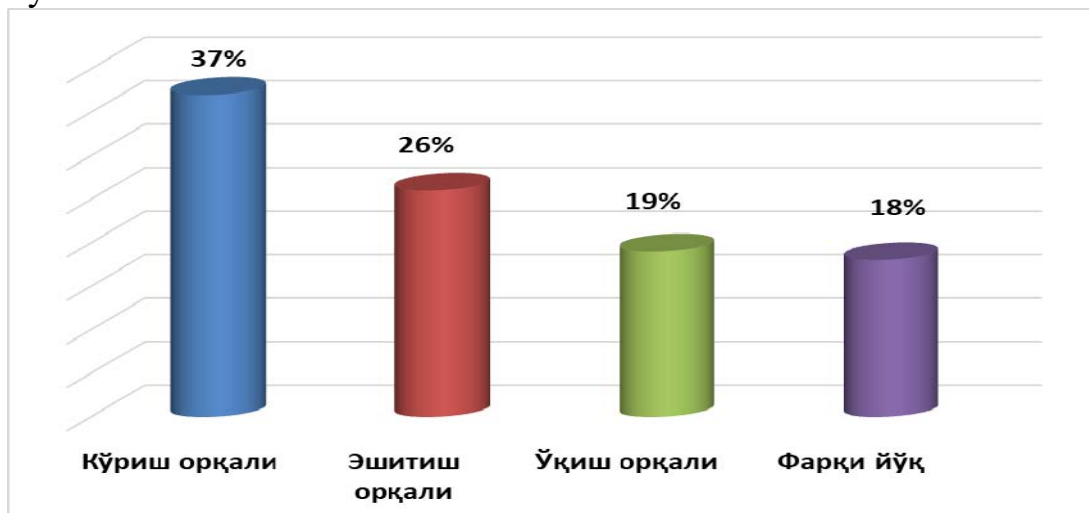
3-расм. Сиз учун ахборот олишнинг қандай усули маъқулроқ ҳисоблайсиз?

Сиз олган ахборотингизни дўстларингиз, яқинларингиз ёки ён-атрофдаги одамлар билан ўртоқлашасизми?, деб берилган навбатдаги саволга респондентларнинг аксарияти, яъни 57% баъзан олган маълумотларини дўстлари ва яқинлари билан ўртоқлашишларини қайд этиб ўтган бўлсалар, 22% респондент эса олган ахборотларини албатта дўстлари ва яқинлари билан ўртоқлашишларини эътироф этиб ўтишган. 16% респондент эса олган ахборотларини ҳеч ким билан муҳокама қилмасликларини айтиб ўтишган. Шунингдек, мазкур саволга 5% респондент жавоб беришга қийналишларини кўрсатиб ўтишган.