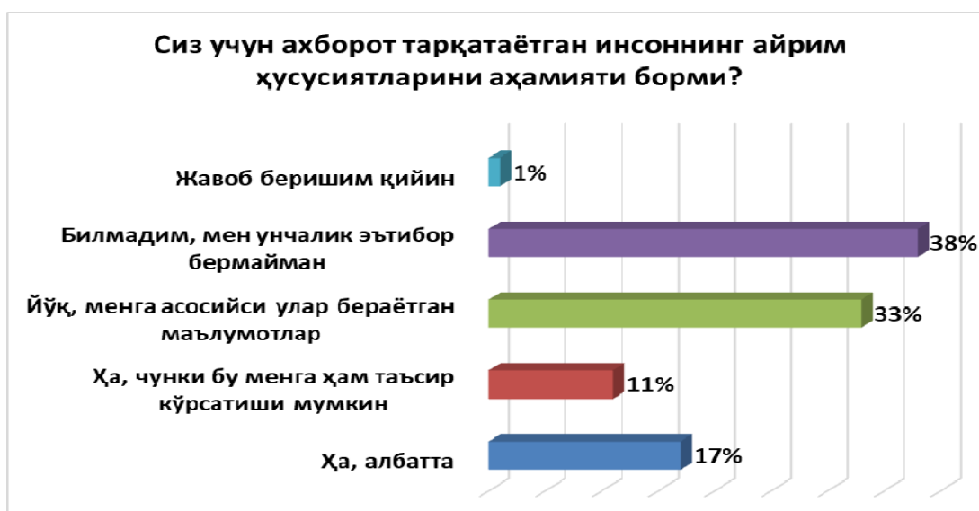
4-расм. Сиз учун ахборот тарқатаётган инсоннинг айрим хусусиятларининг аҳамияти борми?

Кўпчилик ҳолларда кишилар учун ахборот ким томонидан тарқатилаётгани ҳам муҳим аҳамият касб этиши мумкин. Шу саволга аниқлик киритиш мақсадида респондентларга берилган саволга респондентларнинг 38%и ахборот ким томонидан тарқатилаётгани аҳамиятсиз эканлигини қайд этиб ўтишган. 33% респондент ҳам юқоридаги фикрни тўлдирган ҳолда ўзлари учун ким эмас, қандай ахборот тарқатилаётгани муҳимлигини кўрсатиб ўтишган. Фақатгина 17% иштирокчилар қатъият билан ҳа, албатта муҳим, деб жавоб қайтаришган бўлишса, яна 11% респондент ҳа, чунки бу менга таъсир кўрсатиши мумкин, деган жавоб вариантини танлашган.