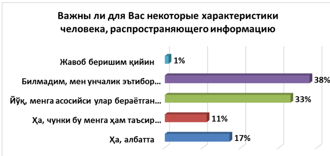
Рисунок 4. Важны ли для вас некоторые характеристики человека, распространяющего информацию?

В то время, как 37% опрошенных заявили, что предпочитают получать информацию визуально, 26% респондентов заявили, что предпочитают получать ее на слух. При этом 19% респондентов заявили, что предпочитают получать информацию через чтение, почти столько же, то есть 18% респондентов заявили, что не имеет значения, как они получают информацию.