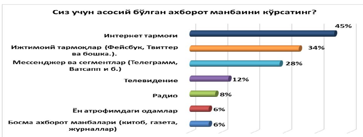
2-расм. Сиз учун асосий бўлган ахборот манбаини кўрсатинг?

Ўқувчи респондент, айтишича, сизнингча ахборот тушуниши нимага асосланади?, деб берилган саволга респондентларнинг 34%и ОАВ бериладиган маълумотлар, деб жавоб қайтаришган бўлишса, 25% респондент эса аҳамиятли бўлган ҳар қандай маълумотлар, дея жавоб қайтаришган. Шунингдек, 17% респондент инсон фаолиятида зарур бўладиган маълумотлар, деб жавоб қайтаришган бўлса, 12% респондент эса ахборот деганда воқеа-ҳодисаларнинг тизимли тафсилоти, дея жавоб беришган. 8% иштирокчи бирор нарса ҳақида маълумот деган бўлса, яна 4% респондент мазкур саволга жавоб бериш қийин, деган жавоб вариантини танлашган.