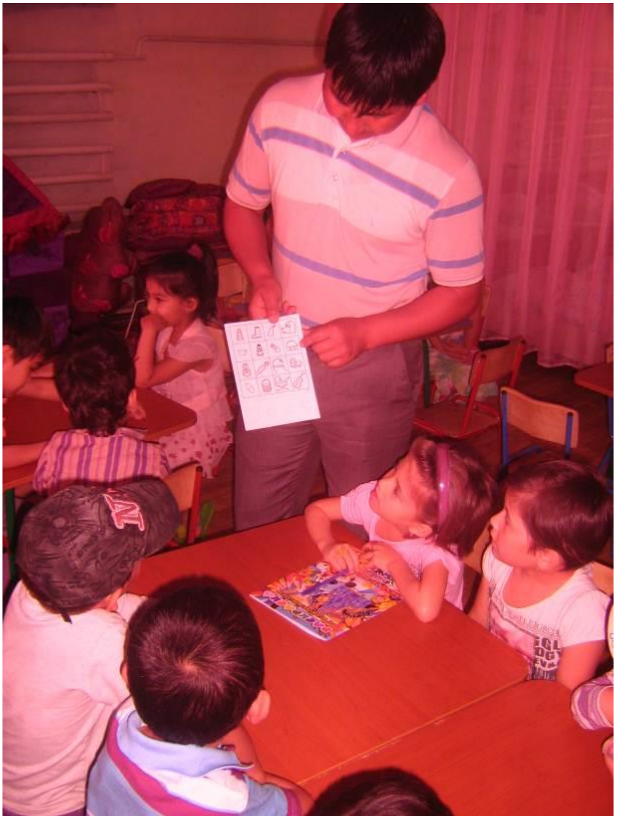
6- тажриба гуруҳида иш олиб борилиши жараёни