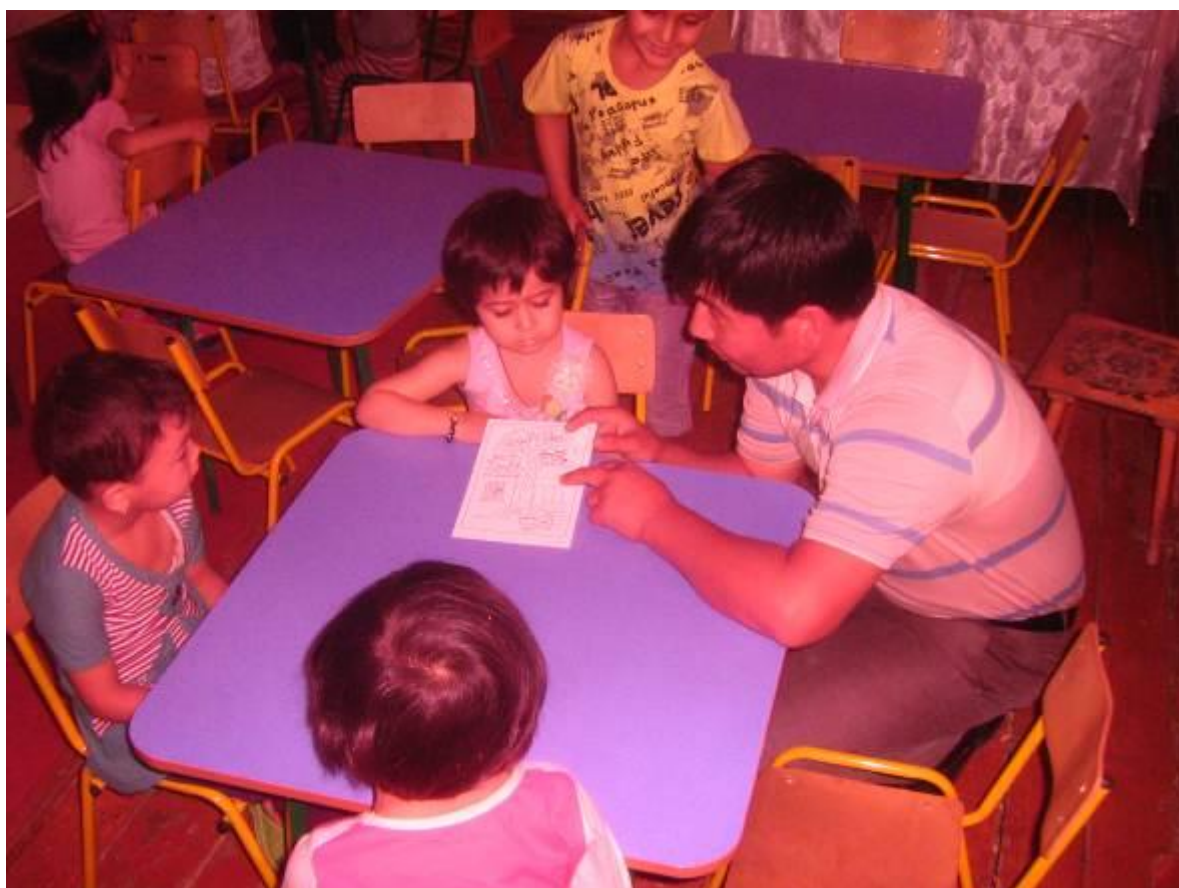
4-гуруҳда иш жараёнининг кечиши.