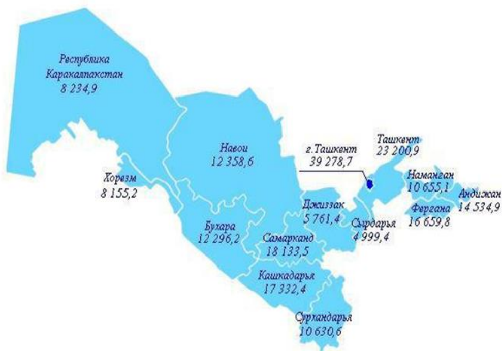
Рис. 2. Валовой региональный продукт за 2017 год, млрд.сум. 2

За годы независимости обеспечение территориальной сбалансированности национальной экономики и снижение региональных диспропорций стали приоритетными направлениями государственной политики Узбекистана.