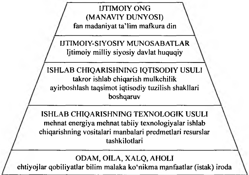
2 - tasvir. Sivilizatsiya piramidasi (jamiyatning tuzilishi)

Birinchidan, ijtimoiy-iqtisodiy formatsiya tushunchasi asosida ma'naviylik ustidan moddiylikning ustuvorligi g'oyasi yotadi. Bizning yondashuvimiz inson primati, uning ehtiyojlari, bilimi, uquvi, madaniyati, mafkurasini umumlashtiradigan so'z ko'pincha ijtimoiy ong deb aytiladi va u insonni tabiat dunyosidan farq qildi. Albatta, odam o'zini o'tab turadigan dunyodan ajralishi mumkin emas (uning asosiy unsuri inson o'zining ehtiyojlari va qobiliyatlari, bilimi va uquvi, xohishi va irodasi bilan). Tarixiy progressning belgilovchi omillaridan biri, ma'naviy dunyoning dinamikasi bilan bir qatorda ishlab chiqarish kuchlarining rivojlanishi bo'ladi.