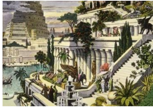
2-расм. Ороллардаги ва дарё қирғоқларидаги Семирамида номи билан боғлиқ «осма боғлар» график чизмалари.

Тўрт қаватлик, баланд тепаликка секин-аста қисқариб борувчи поғонасимон «осма боғлар»нинг биринчи қавати ўлчамлари 45x40 метрни, иккинчи қавати эса 40x30 метрни ташкил қилган. Ҳар бир қаватнинг соф баландлиги 5 метрга яқин бўлиб, бир қаватдан иккинчисига оқ ва қизғиш рангли мрамрдан ишланган кенг зиналар орқали чиқилган. Нақшинкор устунларга таянган равоқлар устидан ғишт, унинг устидан мураккаб таркибли елим-қатрон, ичига эса ҳозирги цементга ўхшаш лой тўлдирилган чий (қамишсимон ўсимлик ва унинг пояси) тўшалиб, яна ғишт терилган ва ниҳоят сув ўтмаслиги учун яна қатрон ва кўрғошин қўйилган. Ҳар бир қаватнинг «замин»и шу тарзда ҳозирланганидан сўнг, устидан улкан дарахтлар ўсадиган даражада унумдор тупроқ қатлами ётқизилган. Боғ учун дунёнинг Мағрибу-Машриғидан энг нодир ва кўркем дарахт кўчатлари, буталар, лианалар, анвойи гуллар ва майсалар келтириб экилган. Боғлар Фрот дарёсидан чархпалак ёрдамида чиқарилган сув билан суғорилган. Ҳар бир қаватга қаватлараро фавворалар, шаршаралар ва шалолалар режалаштирилган (2-расм) [1].