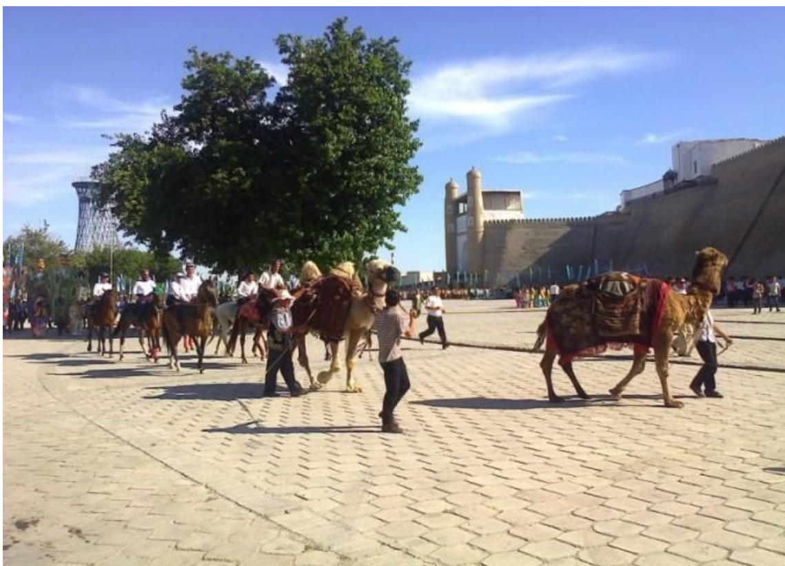
Buxoro arki yonidagi zamonaviy karvon