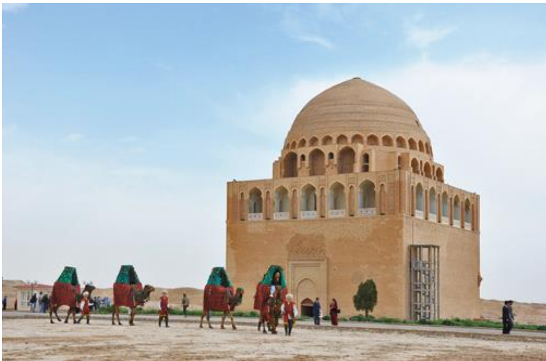
Marv shahridan o'tayotgan karvon