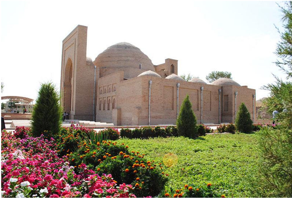
Termizdagi Sulton Saodat majmuasi