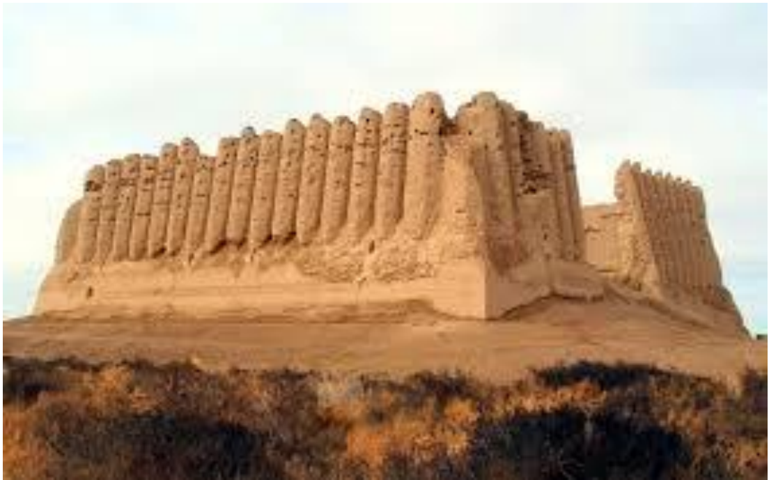
Ko'hna Marv xarobasi