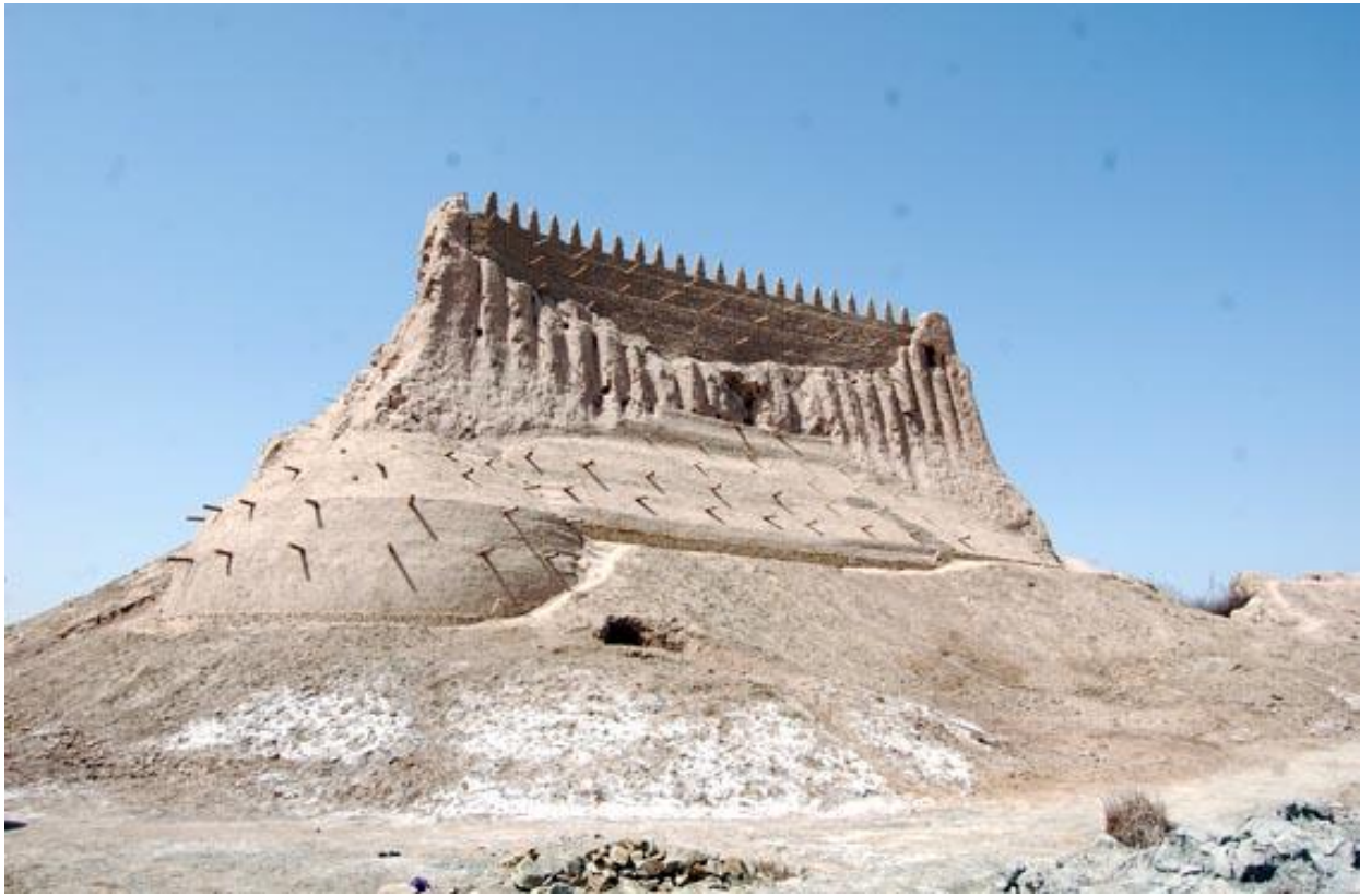
Xazoraspdagi Sulaymon qal'a