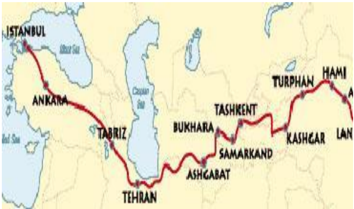
Buyuk ipak yo'lidagi shaharlar