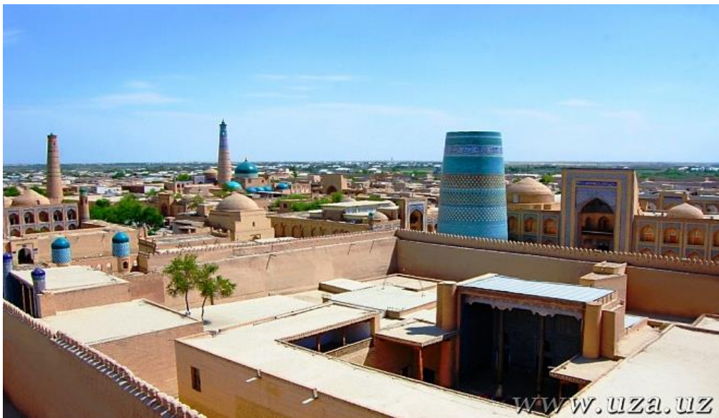
Xivaning umumiy ko'rinishi