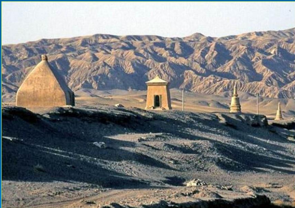
Sian shahri buyuk ipak yo'lida