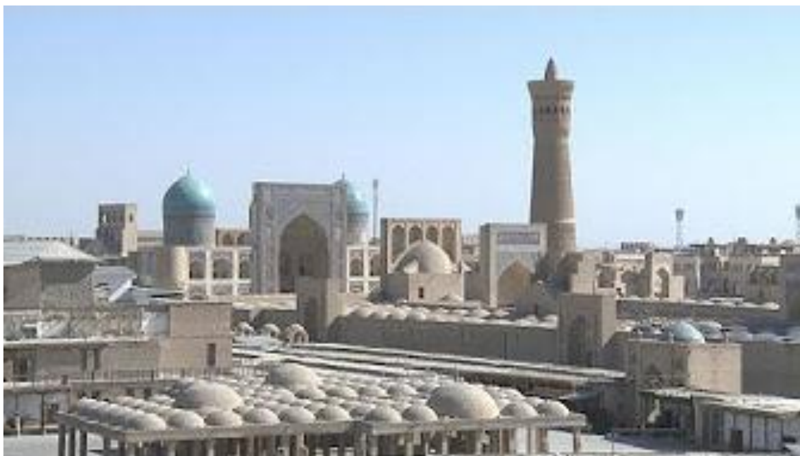
Buxoroning umumiy ko'rinishi