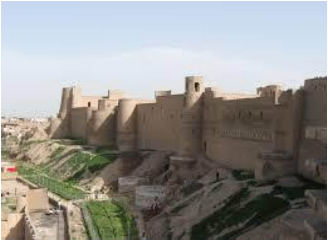
Hirotdagi Bolo Hissor