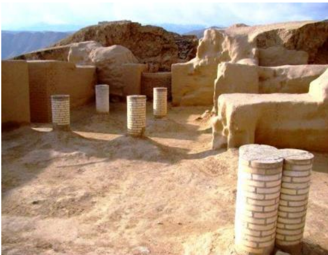
Termizdagi Fayoztepa yodgorli