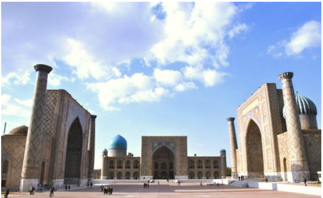
Samarqanddagi Registon majmuasi