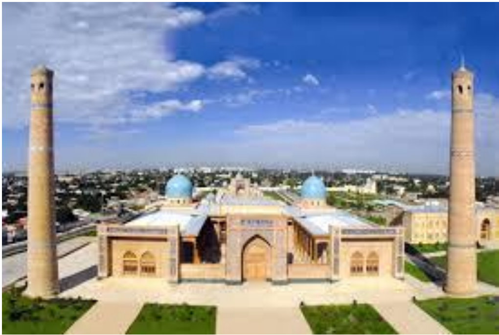
Toshkentdagi Hazrati Imom majmuasi