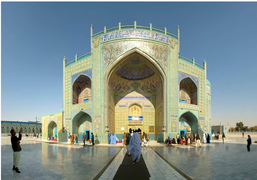
Hazrati Ali masjidi (Mozori Sharif)