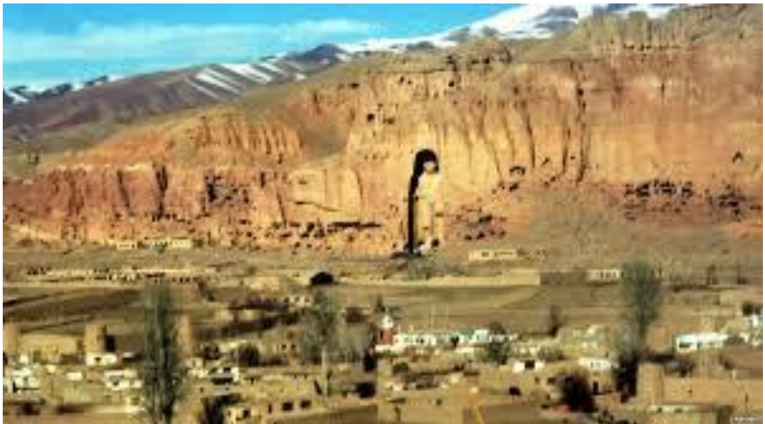
Bomiyondagi Budda haykali (Afg'oniston)