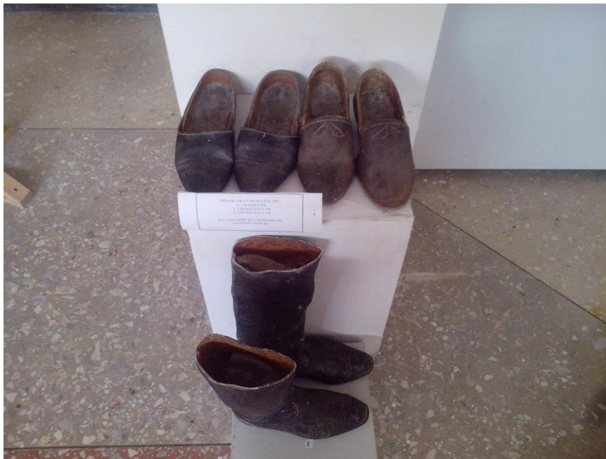
13-расм Этнография зали. Эркаклар оёқ кийими (19 аср)