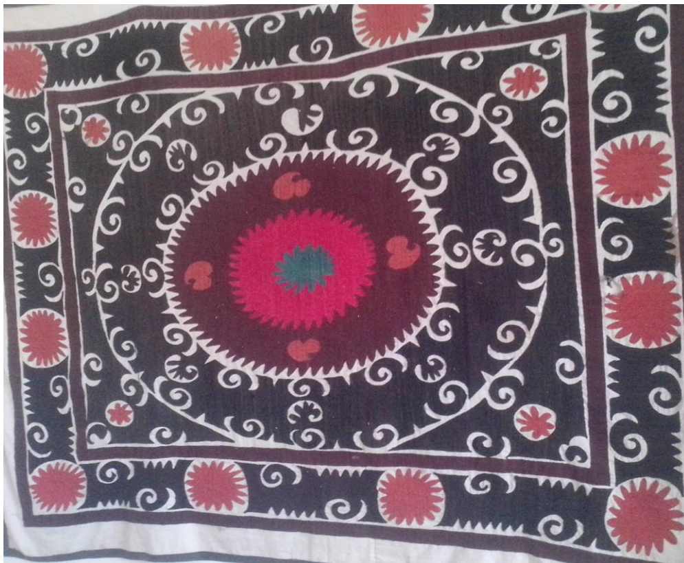
16-расм Мустақиллик зали. Сўзана (2005 йил)