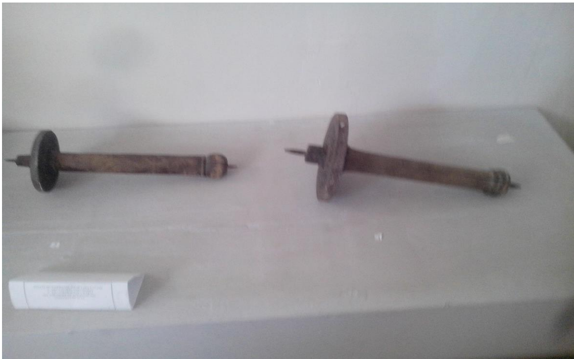
9-расм Этнография зали. Чарх (19 аср)