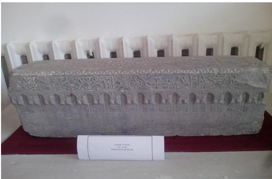
14-расм Тарих зали. Қабр тоши. (20 аср)