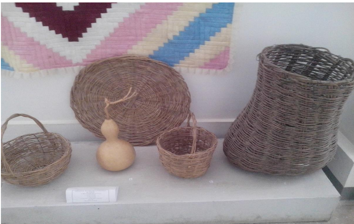
21-расм Мустақиллик зали. Мева, кади, нон, тухум солинадиган сават (1995 йил)