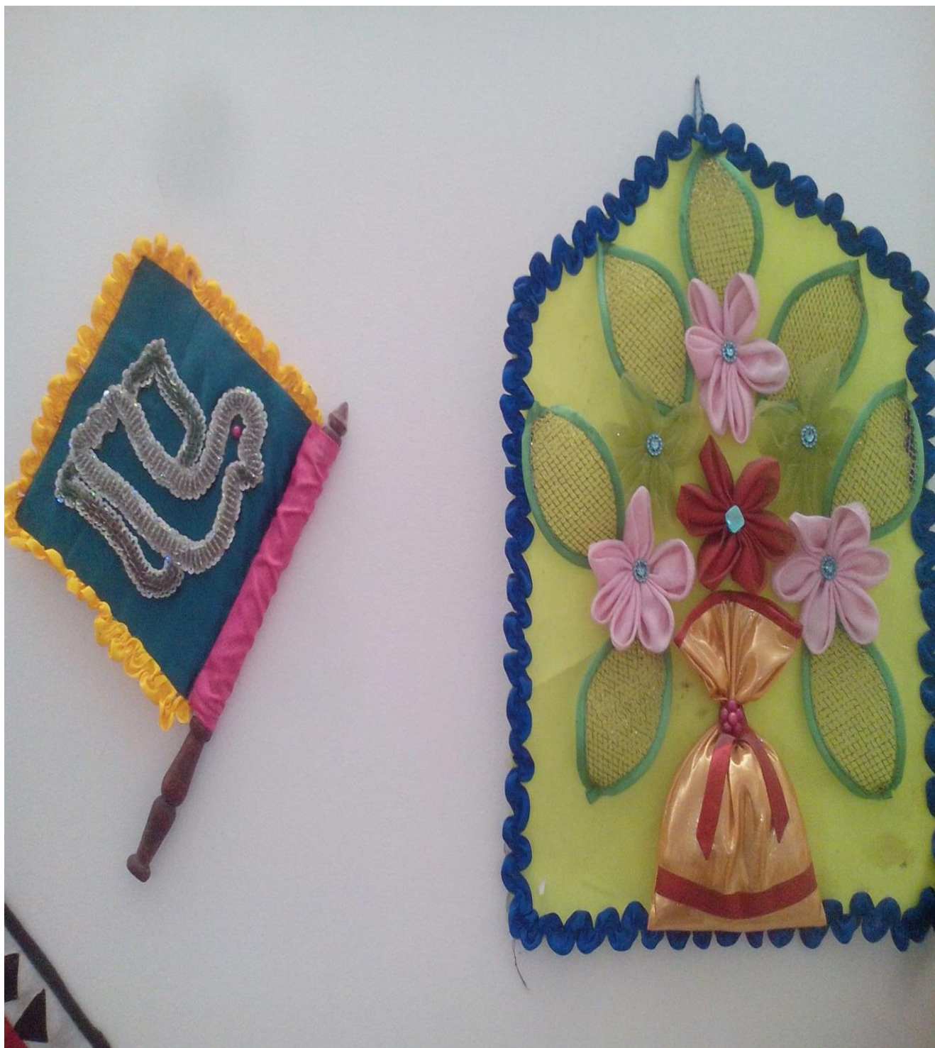
22-расм Мустақиллик зали. Игна санчик, йилпиғич (2001 йил)