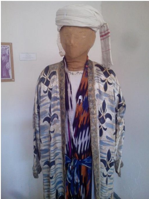
11-расм Этнография зали. Эркаклар миллий кийими. (19 аср)