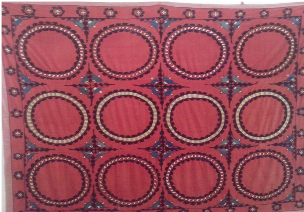
17-расм Мустақиллик зали. Сўзана (2007 йил)