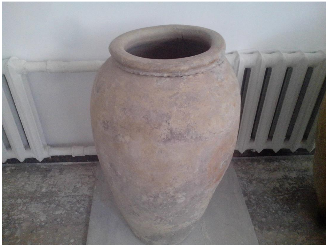
6-расм Тарих зали. Сопол хум. (19 аср)