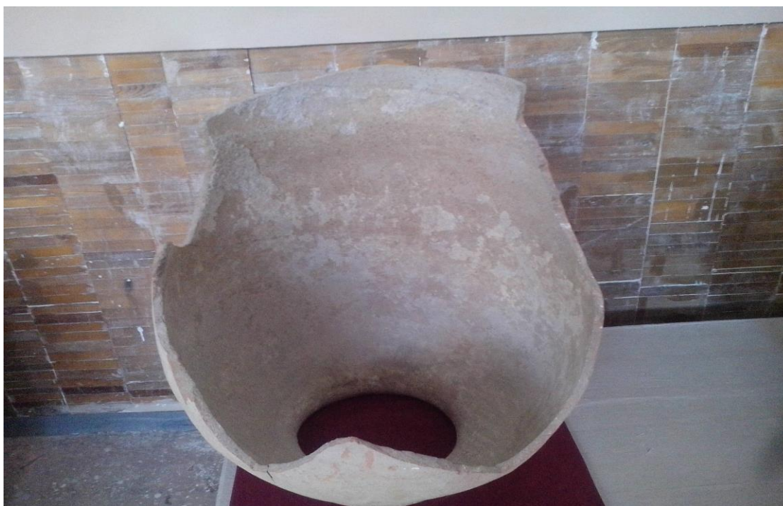
15-расм Тарих зали. Сопол кўза қолдиғи. (19 аср)