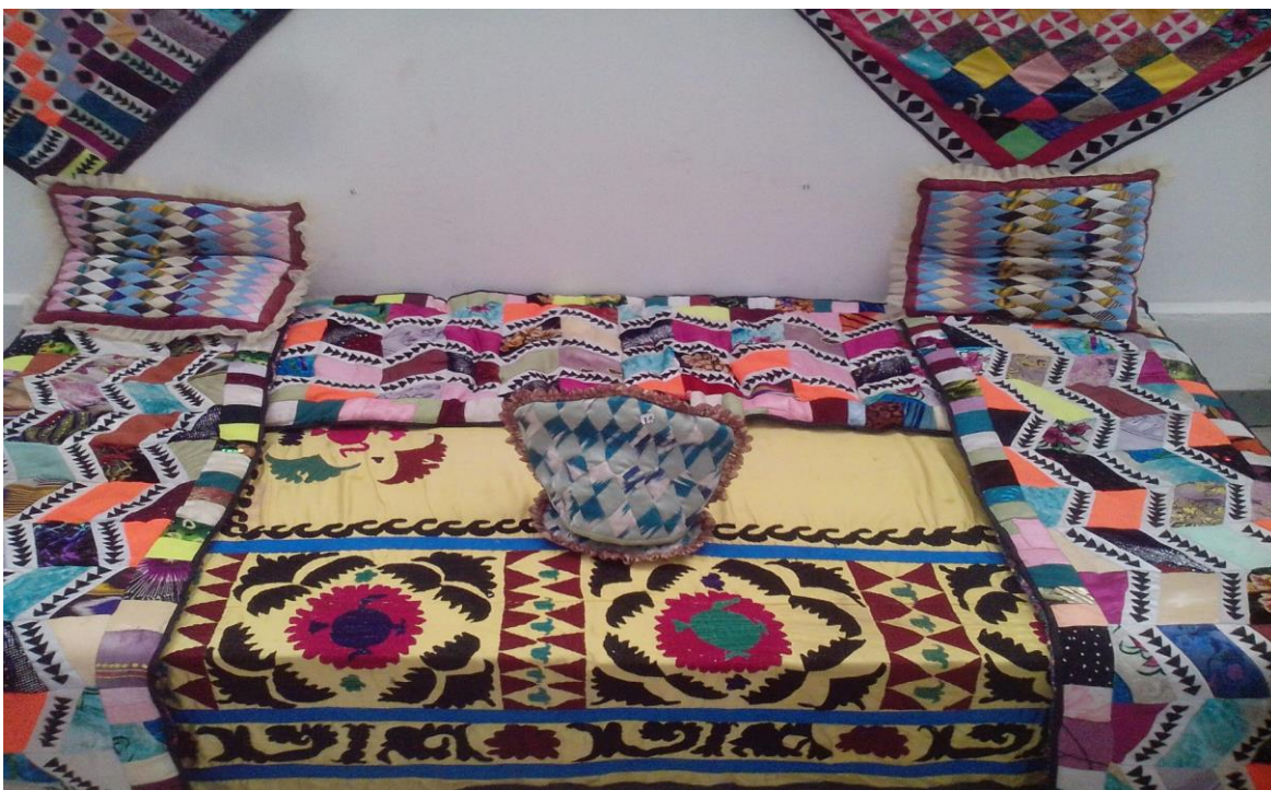
20-расм Мустақиллик зали. Кўрпача, чойнак ёпқичи, ёстиқ (1999 йил)