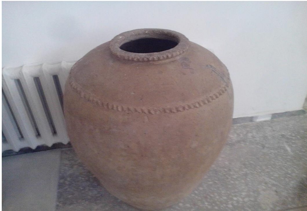
5-расм Тарих зали. Сопол хум. (19 аср)