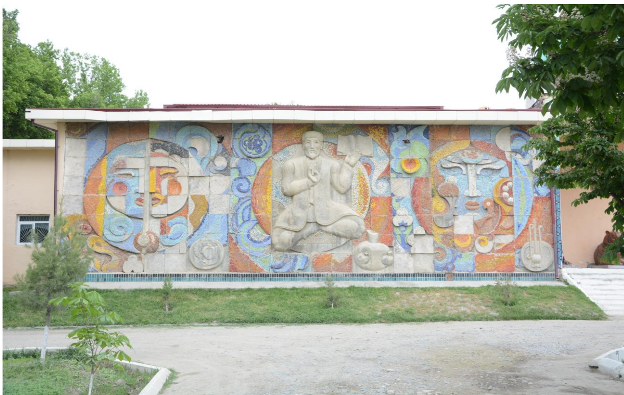
2-расм Иштихон тумани ўлкашунослик музейи ички ховлисидаги деворий панно