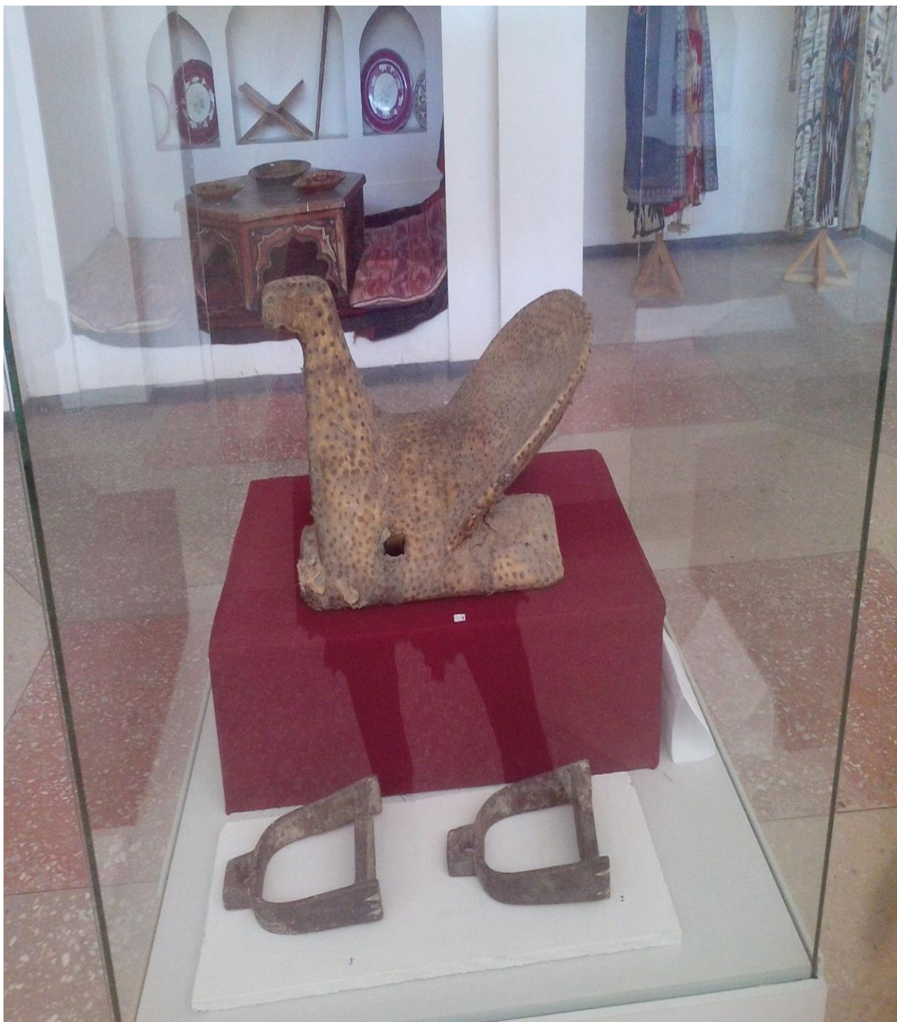
23-расм Тарих зали. От эгари. ( 19 аср)