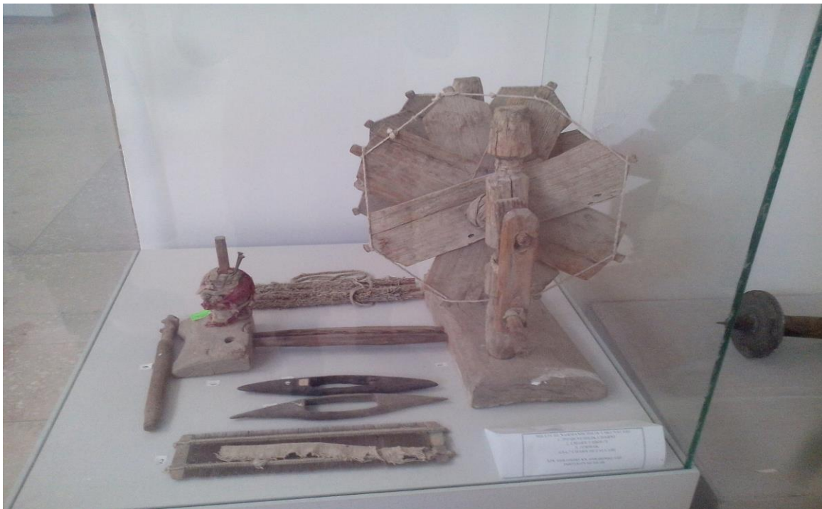
10-расм Этнография зали. Дукан. (19 аср)