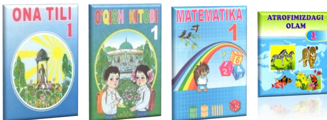
1-rasm. 1-sinf darsliklari