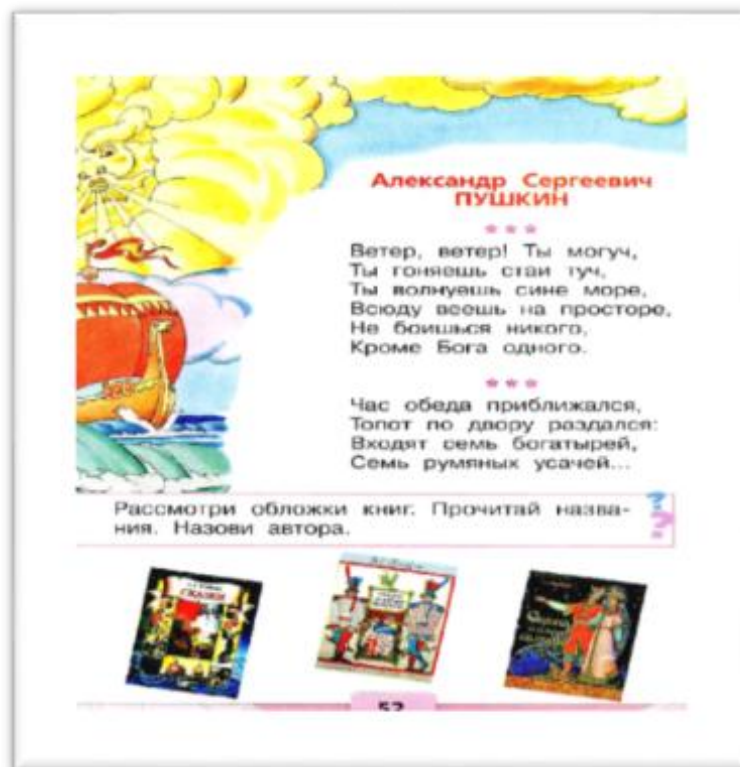
4-rasm.. Darslikda adabiyotlar tavsiyasining berilishi