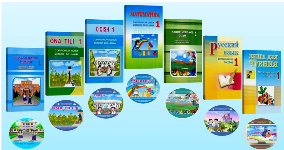
3-rasm. O'qituvchi uchun metodik qo'llanma