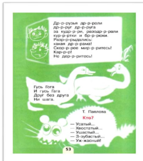
7-rasm. “Литературное чтение” da “Разноцветные страницы” sahifasi