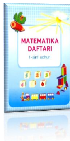
2-rasm. Mashq daftari