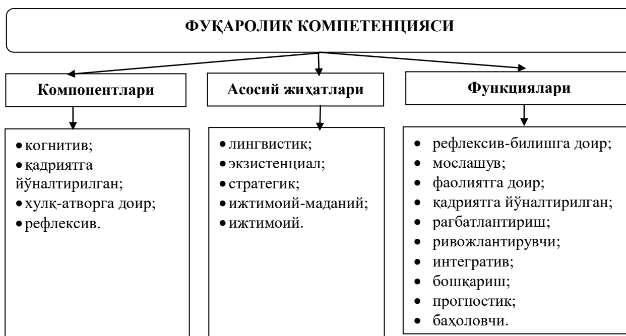
1-расм. Фуқаролик компетенцияси тузилмаси ва тавсифи

Е.В.Бондаревская, И.М.Дуранов, И.А.Зимняя, А.М.Князев, О.Н.Малова, О.Т.Абдуғаниев, М.О.Хўжаев ва бошқа тадқиқотчиларнинг илмий ишларини назарий таҳлил қилиш натижасида фуқаролик компетенциясининг қуйидаги тузилмаси аниқлаштирилди (1-расмга қаранг).