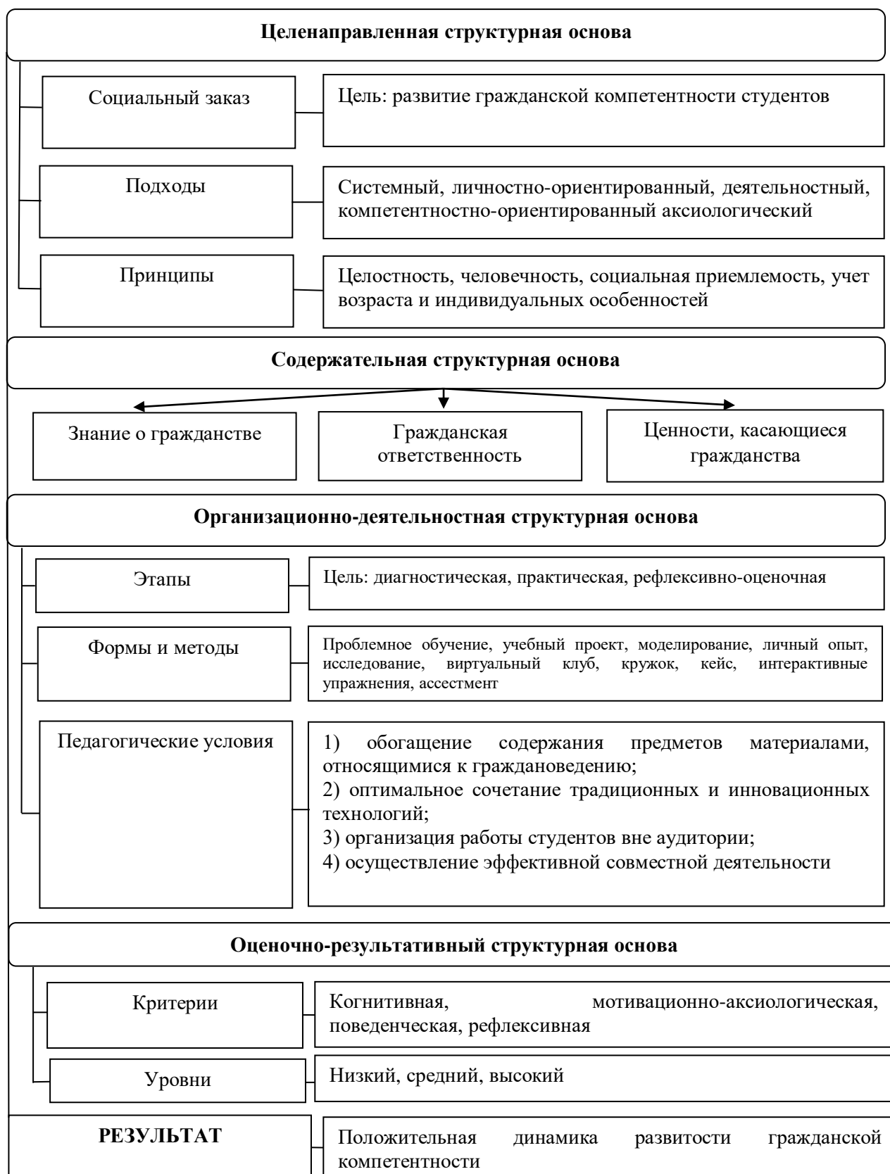
Рисунок 2. Педагогическая модель развития гражданской компетентности студентов

4) оценочно-результативный – включает в себя оценочные критерии, показатели, уровни и диагностический инструментарий определения изменений уровня развития гражданской компетентности у студентов.