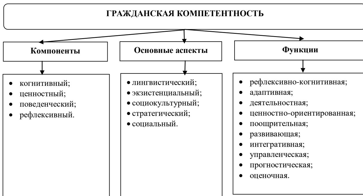
Рисунок 1. Структура и описание гражданской компетентности

В результате теоретического анализа работ Е.В.Бондаревской, И.М.Дуранова, И.А.Зимней, А.М.Князева, О.Н.Маловой, О.Т.Абдуганиева, М.О.Худжаева и других исследователей была уточнена следующая структура гражданской компетентности (см. рисунок 1).