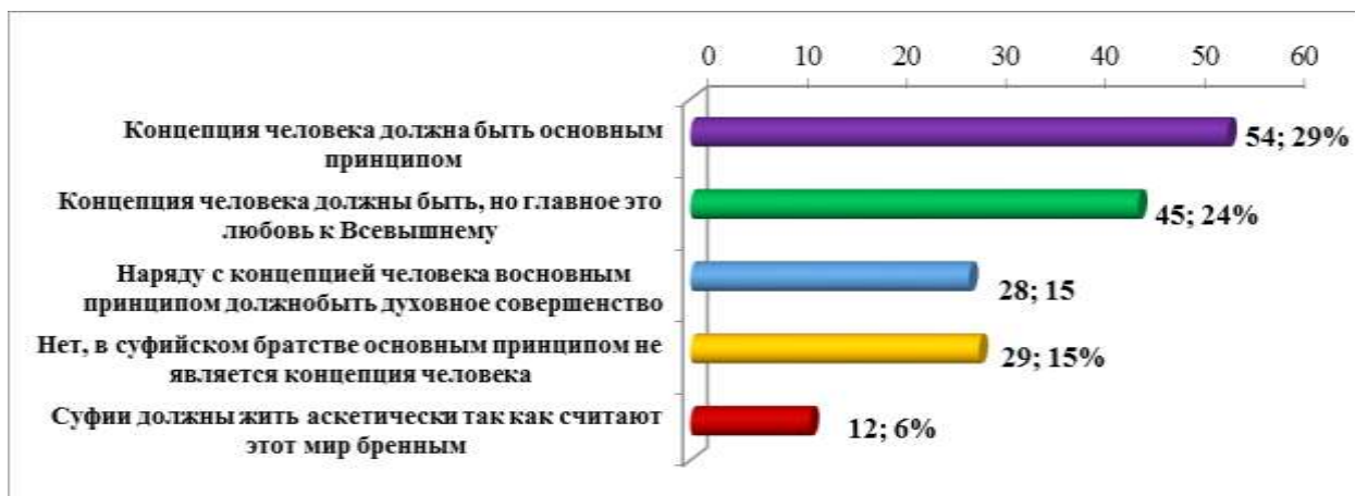
Диаграмма 1. Какие произведения Алишера Навои дали вам больше сведений о религиозных, а также суфийских взглядах мыслителя?

На вопрос: «Считаете ли вы, что концепция человека является центральным принципом суфизма?», 29,0% (54) респондентов ответили, что главным принципом в любой религии должна быть концепция человека, а 24,0% (45) считают, что главным принципом должна быть божественная любовь; 15,0% (28) из них сказали, что духовное совершенство должно быть главным принципом наряду с человеческим понятием в религии, 15,0% (28) респондентов ответили, что проблема человека не должна быть главным принципом в религии? 12,0% (6) считают, что суфии должны жить аскетически, так как считают этот мир бременем. Таким образом, почти 70% студентов положительно реагируют на то, что концепция человека является основным принципом во всех направлениях тариката.