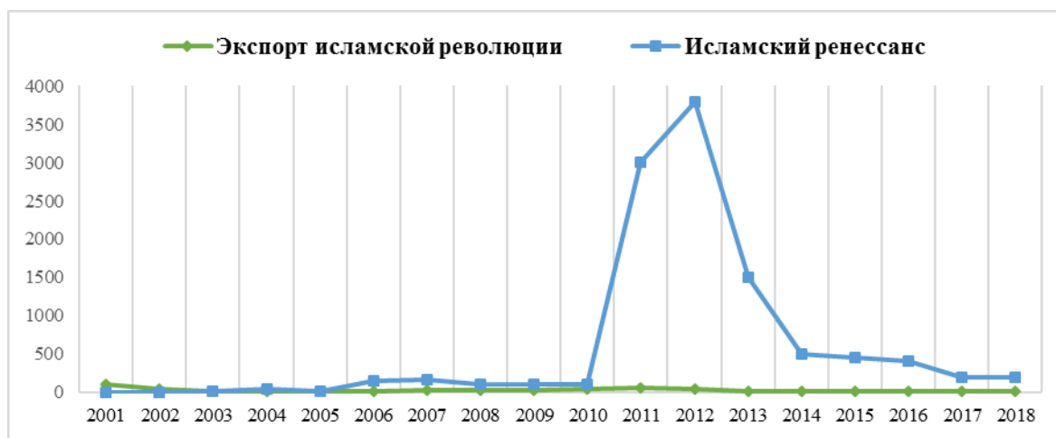
Рис.1. Упоминание фраз «Экспорт исламской революции» и «Исламский ренессанс» в иранских политических кругах с 2000 по 2018 год 10 .

От западных исследователей П. Мохсени 8 и С. Хадери 9 , в которых авторы всесторонне проанализировали концепцию «исламского возрождения» в контексте внешней политики Ирана. Тем не менее актуальность и общественно-политическая значимость изучения проблемы подтверждаются новыми тенденциями современной иранской внешней политики, данными статистических исследований, например, информацией информационного агентства ИСНА (ISNA) (рис. 1).