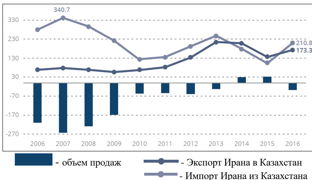
Рис.3. Объем экспорта и импорта Ирана из Казахстана (2006-2016 гг.)

Приведенные выше цифры аналогичны данным, предоставленным другими иранскими властями, с отклонениями в данных (около 2-3% за некоторые годы) из-за округления и ошибок при преобразовании григорианского календаря в иранский календарь. Такая же информация фигурирует в отчетах Торгово-промышленной палаты Ирана за 2013 год.