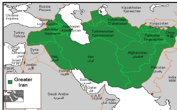
2-rasm. Arablar tomonidan aks ettirilgan “Katta Eron” hududlari 12

XIX asrdan to hozirgacha eronshunoslikda “Katta Eron” va “Eron” atamalari qo‘llanib keladi. Shuningdek “Buyuk Eron” va “Eron madaniy o‘lkasi” kabi atamalar ham uchrab turadi. “Katta Eron” o‘lkasi hozirgi siyosiy jabhadan tubdan farq qilib, faqat tarixiy, madaniy va diniy birlikka ishora qiladi. Keyinchalik eronliklar yashaydigan chegaralar va hududlarda ko‘plab o‘zgarishlar ro‘y berdi, lekin Katta Eronning ko‘p qismlarida til va madaniyat hukmron vosita bo‘lib qoldi.