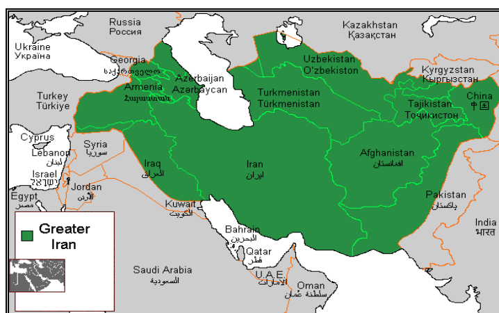
Рис.2. Районы «Великого Ирана», представленные арабами 11

населенных иранцами, но язык и культура оставались доминирующей средой во многих частях Большого Ирана.