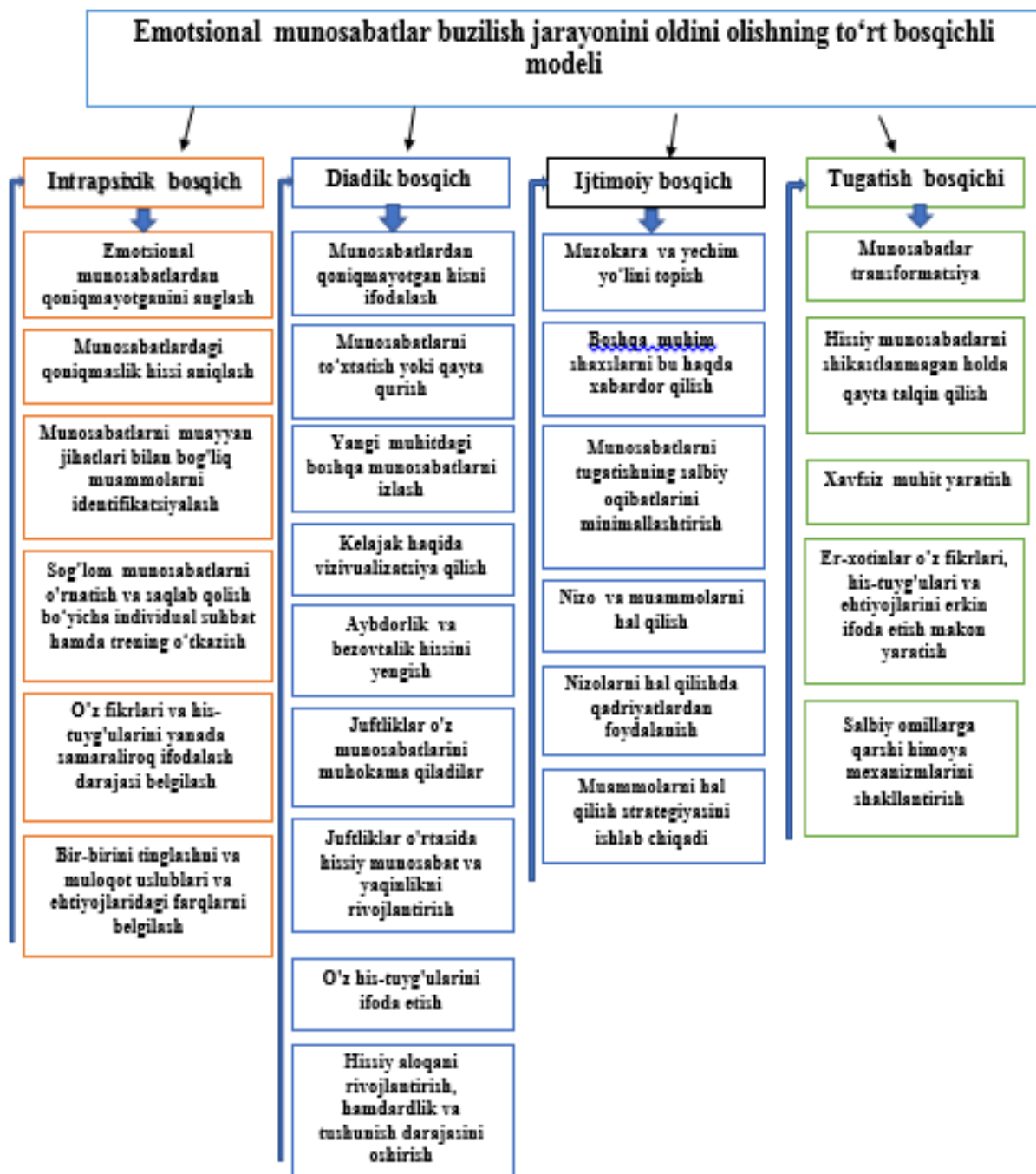
3-rasm. Migrant oilalardagi er-xotin emotsional munosabatlari buzilish jarayonlarini oldini olishning profilaktik modeli

Birinchi bosqich. Intrapsixik bosqichda aynan nima ushbu munosabatlarda qoniqmatirayotganini anglash, o'zining muammolarini munosabatlardagi ma'lum aspektlari bilan identifikatsiya qilishdir. Er-xotinlarda sog'lom munosabatlarni o'rnatish hamda saqlab qolishda individual suhbat va trening o'tkazish yordamida bir-birini tinglash, muloqat qilish uslublarini belgilash bo'ladi (3-rasm).