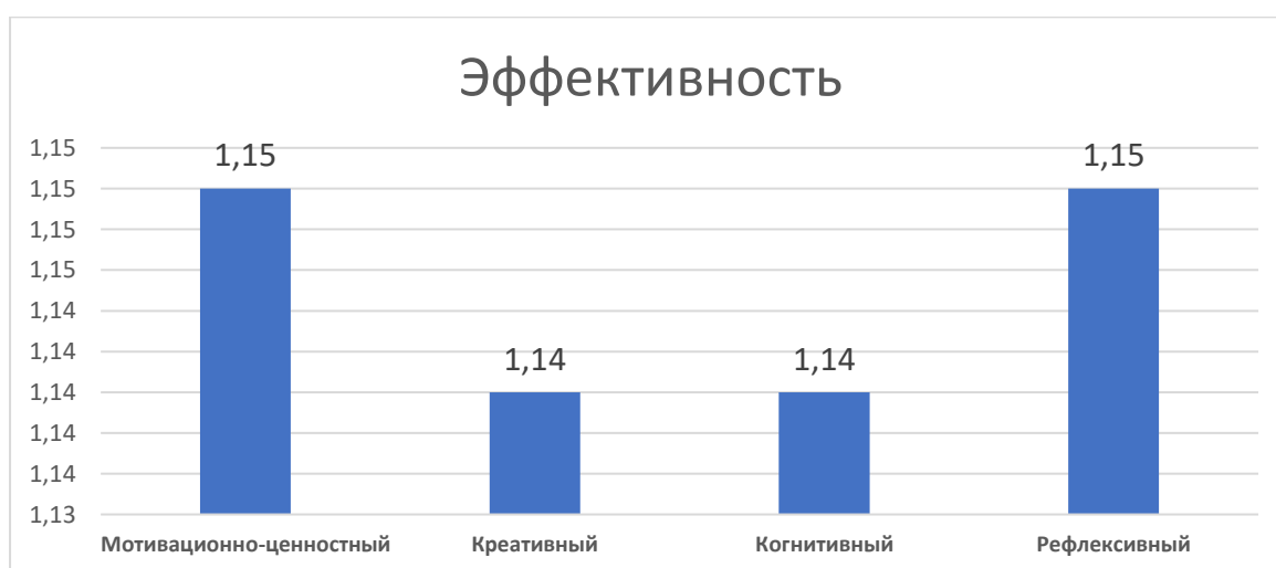
Рисунок 2. Показатели эффективности по критериям конечных результатов

Результаты данных экспериментальных исследований полностью подтвердили исследовательскую гипотезу. Это достигалось путем математически-статистической обработки результатов экспериментальной работы, обеспечения репрезентативности и соблюдения закона перехода количественных изменений в качественные.