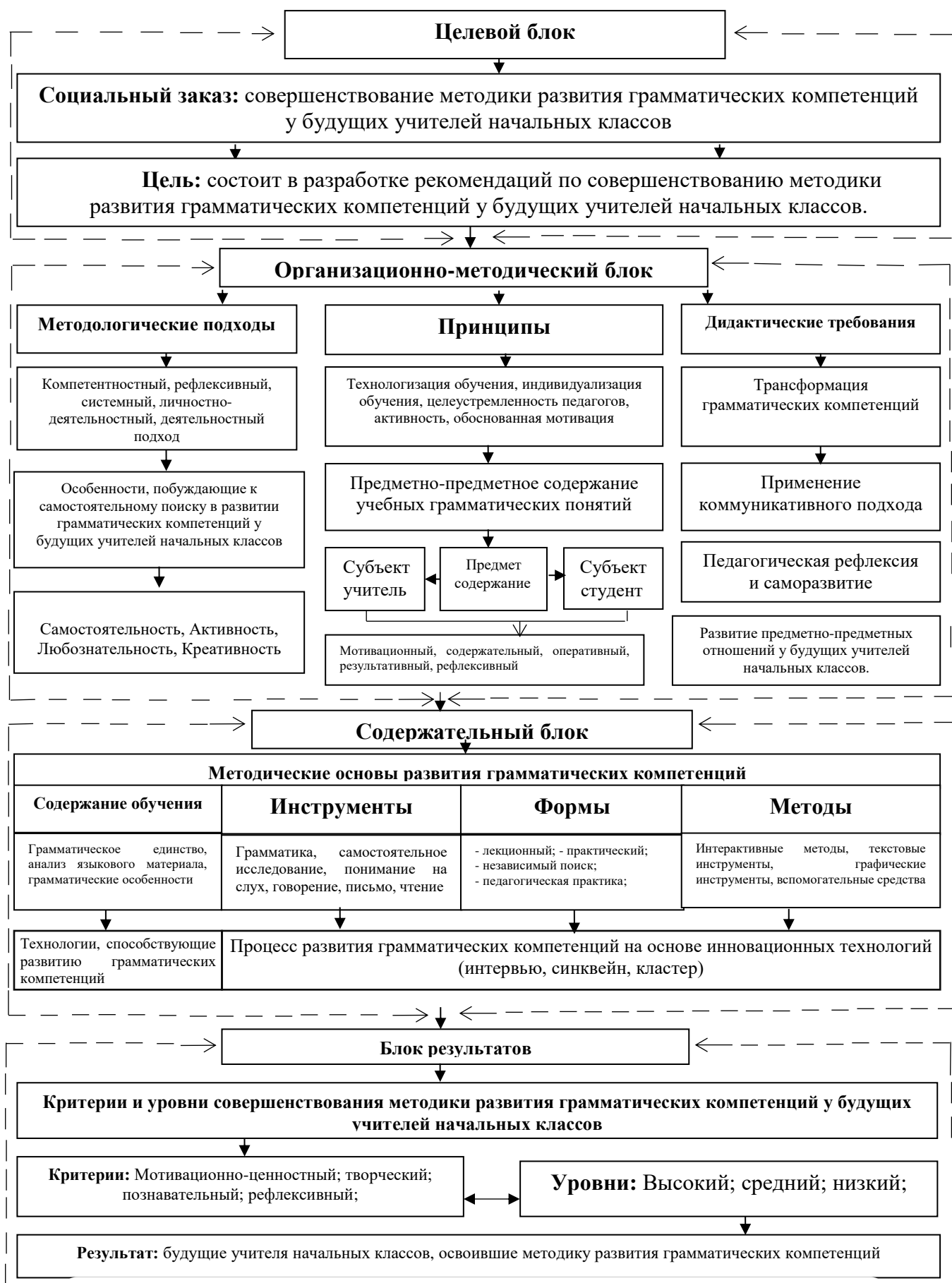
Рисунок 1. Практическая модель совершенствования методики развития грамматических компетенций у будущих учителей начальных классов