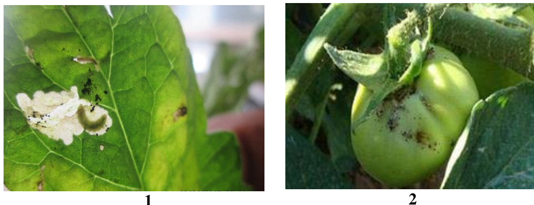
Рис. 4. Вредоносность томатной минирующей моли: 1 – поражение листьев, 2 – повреждение плодов.

Томатная минирующая моль питается паренхимной тканью листа (равномерно), оставляя только эпидермальный слой с нижней и верхней части листа (рис. 4). В результате проникновения гусениц во внутреннюю часть зеленых плодов томата, за счет их испражнений и различных патогенных микроорганизмов плоды растения начинают загнивать.