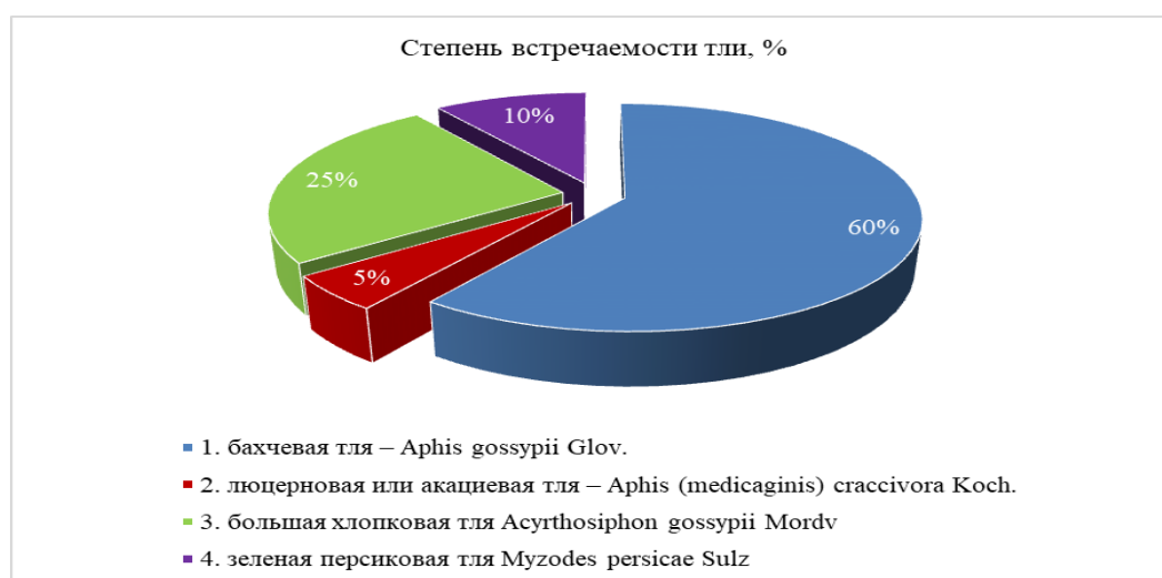
Рис. 5. Распространение тли на растениях томата, выращенных в условиях теплицы (данные 2016-2022 годов)

При проведении мониторинга в условиях закрытого грунта наблюдалась встречаемость в основном бахчевой тли ( Aphis gossypii Glov.), люцерновой или акациевой тли – Aphis craccivora Koch., большой хлопковой тли ( Acyrtosiphon gossypii Mordv), зеленой персиковой тли ( Myzodes persicae Sulz.) (рис.5).