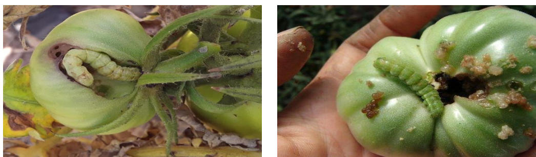
Рис. 1. Вред наносимый гусеницами хлопковой совки плодам томата