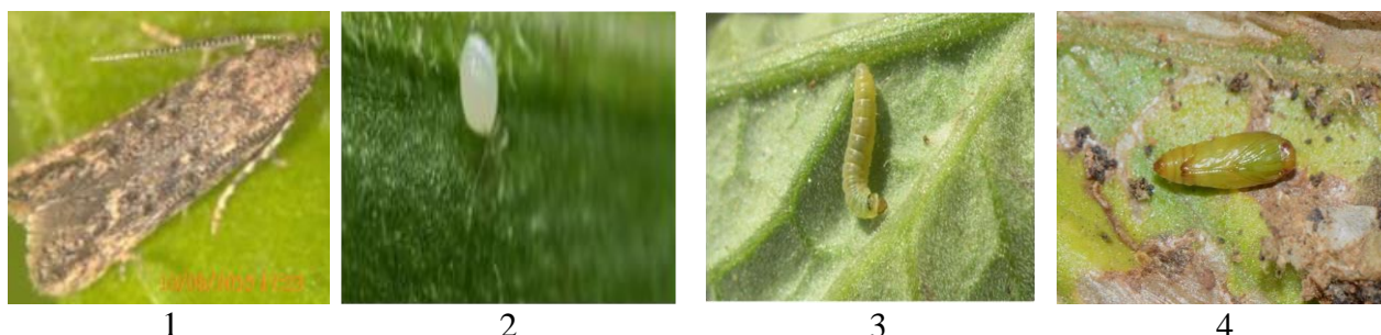
Рис. 3. Томатная минирующая моль: 1 – бабочка, 2 – яйцо, 3 – гусеница, 4 – куколка.

При изучении биоэкологических особенностей развития отдельных фаз вредителя установлено полное развитие 1-поколения при средней температуре воздуха 18-20°C (относительной влажности 50-65%) за 46,8 дней, при 20-25°C (влажности 55-60%) за 21,4 дней, при 25-30°C (влажности 50-40%) за 15,2 дней.