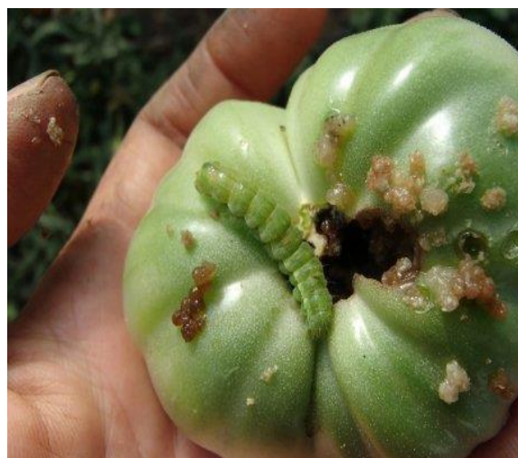
1–расм. Ғўза тунлами қуртларининг помидор меваларига етказадиган зарари