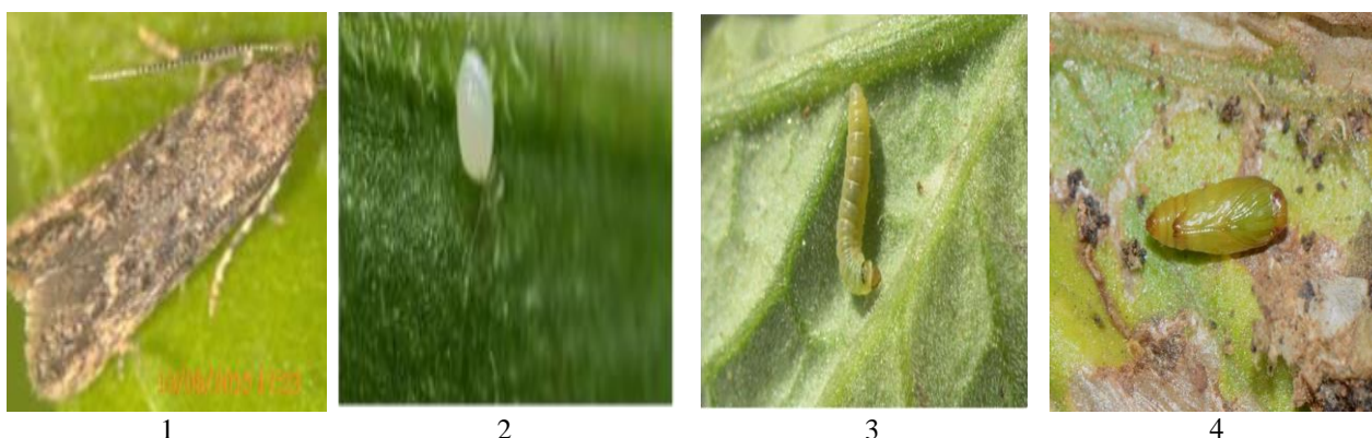
3–расм. Помидор куясининг: 1–капалаги, 2–тухуми, 3–қурти, 4–ғумбаги.

Зараркунданнинг (тухум, қурт, ғумбак, 3-расм) шаклларида биоэкологик ривожланиш хусусиятлари ўрганилганда ҳаво ҳарорати ўртача 18–20°C (50–65% намлик)да 46,8 кун, 20–25°C (55–60% нисбий намлик)да 21,4 кун, 25–30°C (50–40% намлик) бўлганида 15,2 кунда 1 авлоднинг тўлиқ ривожланиши аниқланган.