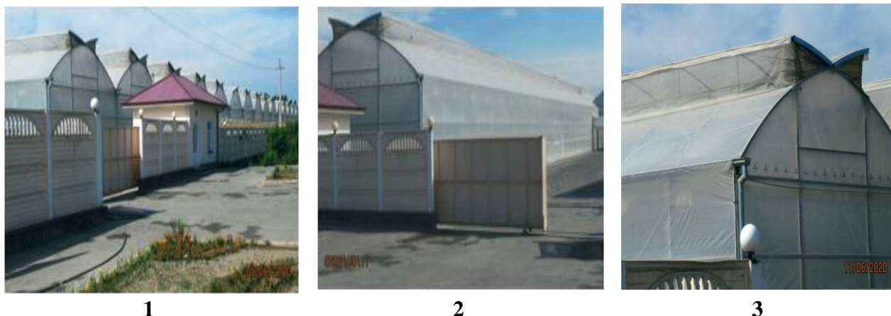
Рис. 6. 1 – внешний вид теплиц, где предусмотрена защита от проникновения внутрь теплиц вредителей, 2 и 3 – защита фрамуг копроновой сеткой.

моли получены следующие результаты. Фрамуги, входные двери, а также окна, предназначенные для проветривания теплиц закрывали специальной москитной сеткой, с установкой на каждом гектаре площади до 5-30 штук половых феромонных ловушек (ФЛ): плотность бабочек снизилась на 96,6%, количество пораженных молью плодов уменьшилось на 91,0%; урожайность увеличилась на 91,8%.