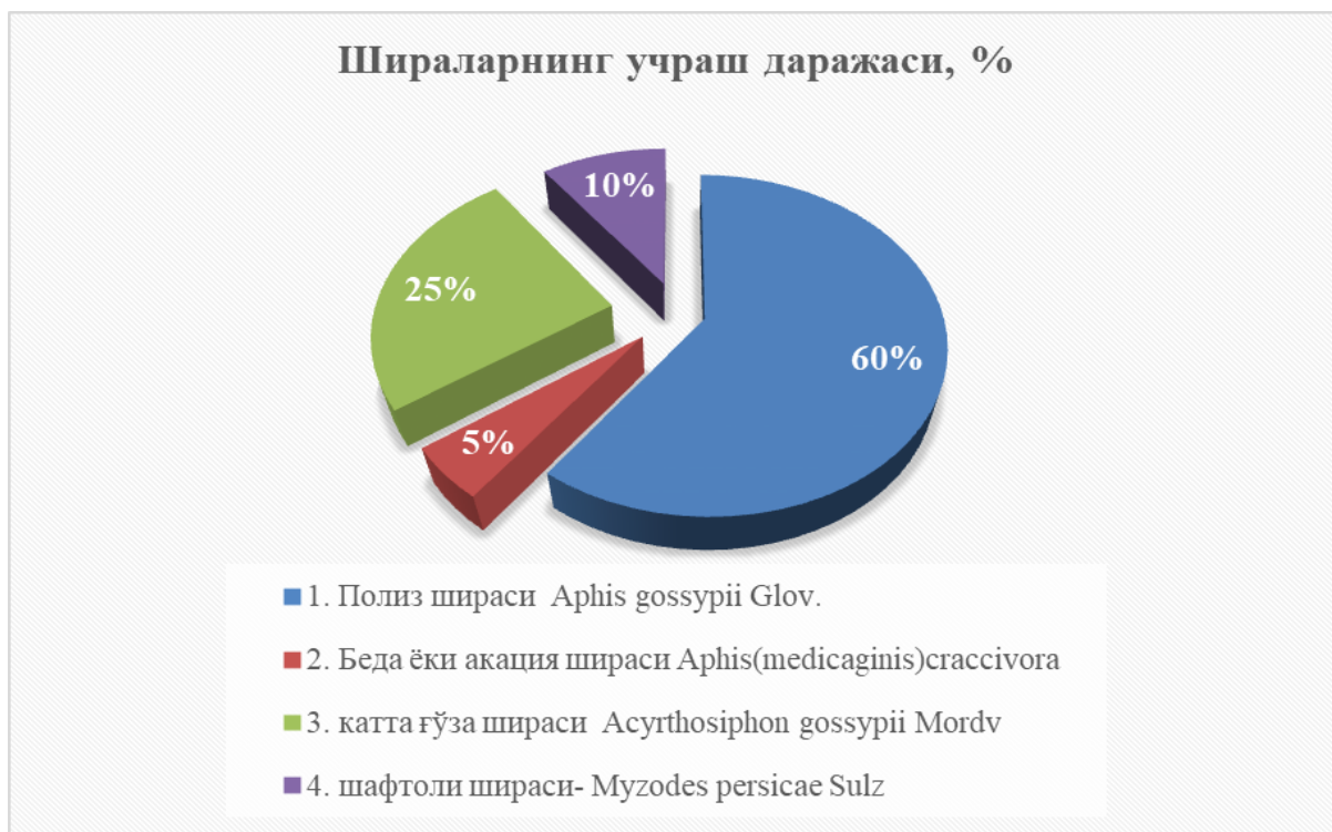
5-расм. Иссиқхона шаронтида етиштириладиган помидор ўсимлигида шираларнинг тарқалиши (2020-2022 йиллар маълумоти)

Мева пишиш даврида ширалар билан 1 балл зарарланганда 1м 2 даги ўсимликдан назорат вариант (15 кг.)га нисбатан 0,8кг. ҳосил камайиб, зарарлилик коэффиценти 5,3 %, 2 балл бўлганда 1 м 2 даги ўртача ҳосил 13,2 кг. ни ташкил этиб, зарарлилик коэффиценти 12,0 %, 3 балл зарарланганда 1м 2 дан 3,7 кг. ҳосил йўқотилиб, зарарланиш коэффиценти 24,6 %, 4 баллда зарарлилик коэффиценти 43,0, 5 баллда 65,0 % ни ташкил этгани кузатилган.