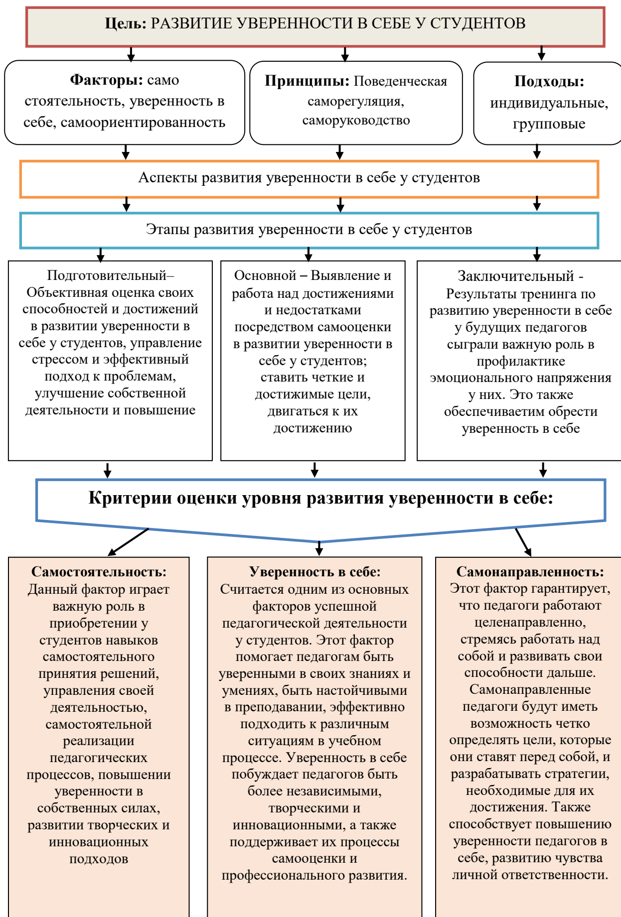
Рис.1. Психологическая модель развития уверенности в себе у студентов