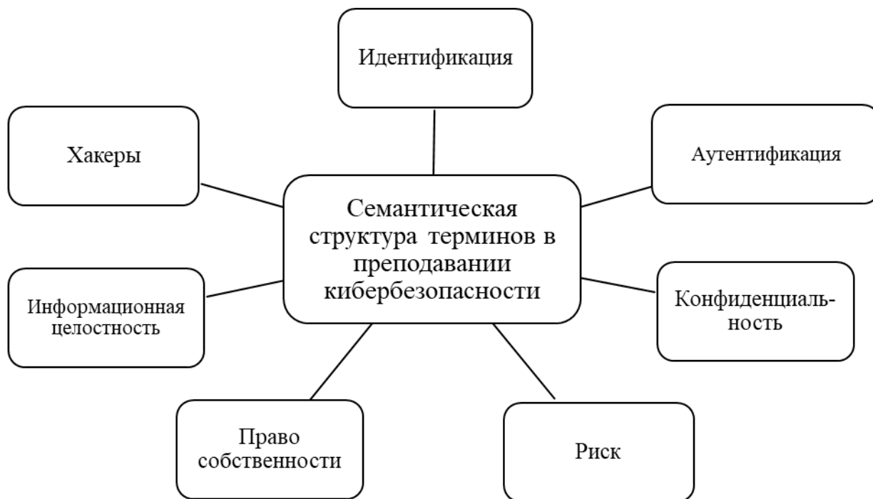
Рисунок 1. Семантическая структура терминов в преподавании науки о кибербезопасности

Риск — это потенциальная возможность получения прибыли или убытка, и обычно возникает, когда вероятность наступления события добавляется к любой ситуации. ISO определяет риск как влияние неопределенности на цели. Информационный риск — это вероятность потери или ущерба, которые могут возникнуть в результате использования информационных технологий на предприятиях. Таким образом, информационные риски связаны с передачей, хранением и использованием любой информации с использованием электронных концепций и других средств связи.