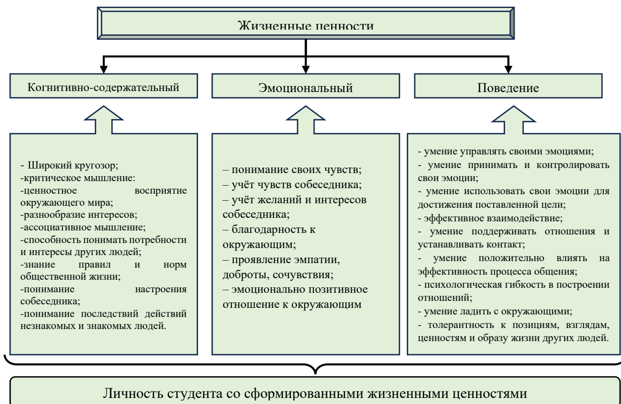
Рисунок 1. Модель развития жизненных ценностей в студенческой жизни

компонентов, обслуживающих развитие жизненных ценностей. Согласно ей, жизненные ценности у личности включают в себя развитие таких компонентов, как поведенческий, эмоциональный и когнитивно-содержательный. Когнитивный или смысловой компонент концентрирует социальный опыт личности, в котором осуществляется процесс научного познания действительности, способствующий определению ценностных отношений. Эмоциональный компонент предполагает переживание отношения личности к этим ценностям и определяет содержание этих отношений. Поведенческий компонент базируется на результатах взаимодействия первых двух компонентов и проявляется в готовности действовать в соответствии с продуманным субъектом планом (рисунок 1).