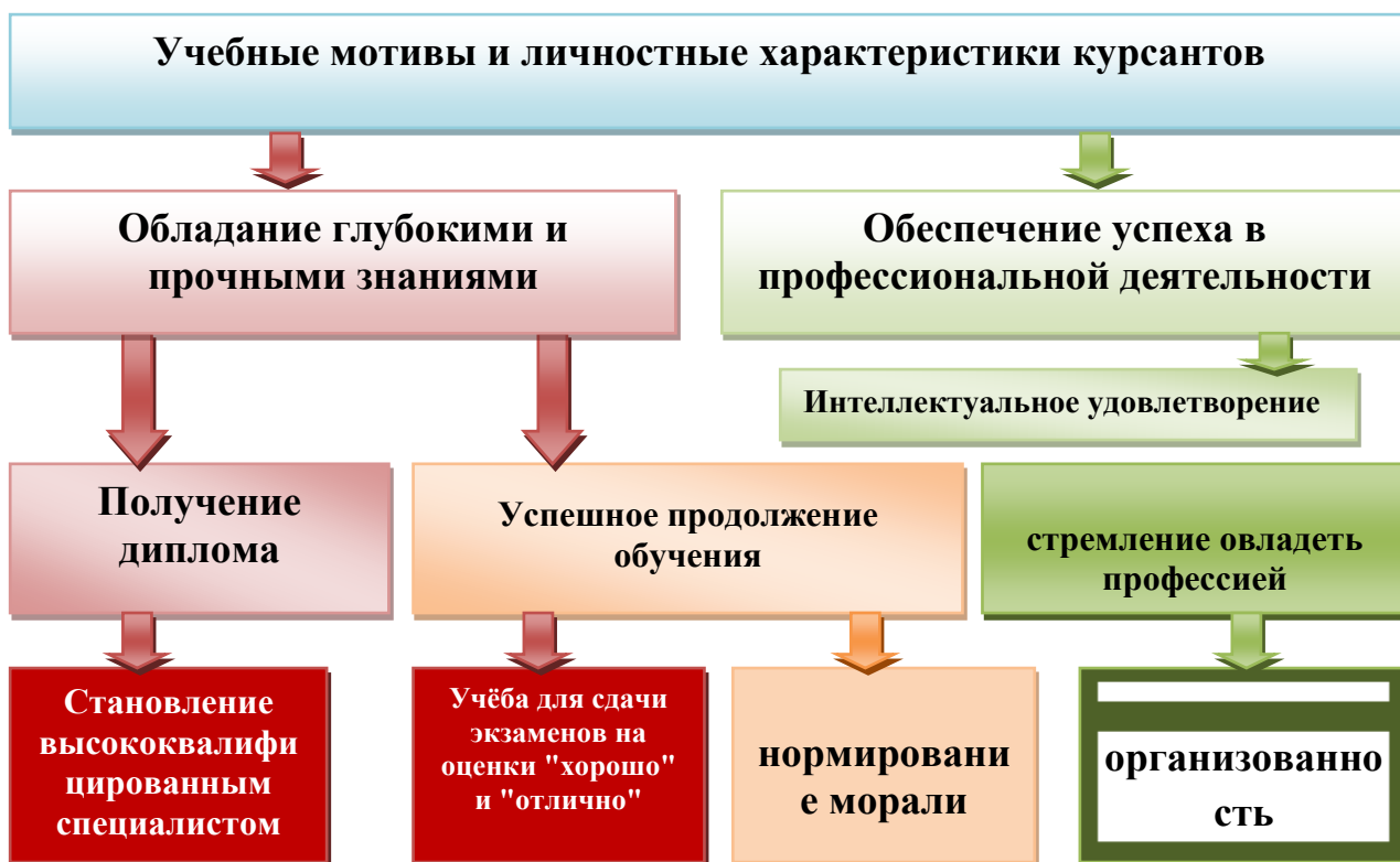
Рисунок 1. Модель учебных мотивов и личностных характеристик курсантов

В соответствии с полученными результатами была разработана модель учебных мотивов и личностных особенностей курсантов Академии Министерства внутренних дел (см. рисунок 1).