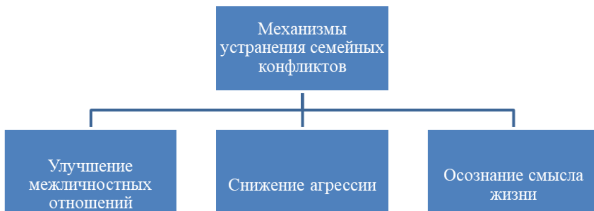
Рисунок 2. Механизмы, влияющие на устранение проявления конфликтов между молодыми супругами.

В.Сатира. Программа состоит из трёх частей и служит оказанию положительного воздействия на испытуемых (смотрите рисунок 2).