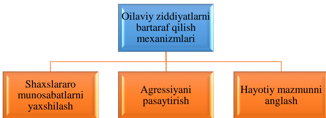
2-rasm. Yosh er-xotinlarda ziddiyatlar namoyon bo'lishini bartaraf qilishga ta'sir qiluvchi mexanizmlar.