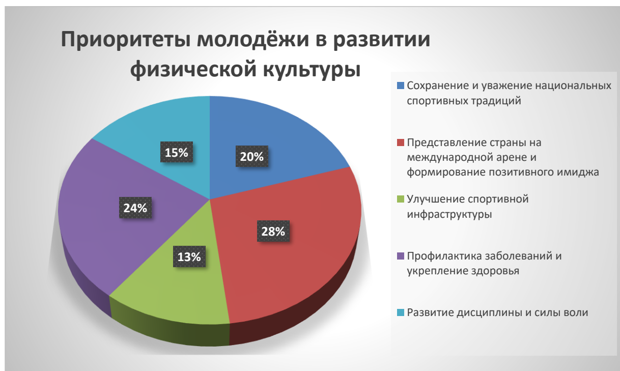
Рис. 1. Анализ приоритетов молодёжи в развитии физической культуры

успехов в повышении престижа страны. Физическая культура воспринимается как инструмент культурной дипломатии, укрепляющий международный авторитет Узбекистана. Участие в Олимпийских играх и чемпионатах мира считается вкладом в национальную гордость, а поднятие флага вызывает чувство единения и ответственности. Вторым по значимости приоритетом (24%) является профилактика заболеваний и укрепление здоровья, что подчеркивает ответственное отношение молодежи к физическому состоянию. Этот выбор отражает понимание важности здорового образа жизни в условиях современного мира. Третьим направлением (20%) является сохранение национальных спортивных традиций, таких как кураш, связывающих молодежь с культурным наследием. Четвертым приоритетом (15%) выступает развитие дисциплины и силы воли, где спорт рассматривается как средство воспитания характера. Наименее значимым (13%) является улучшение спортивной инфраструктуры, хотя ее качество влияет на возможности для занятий спортом. Низкий приоритет инфраструктуры указывает на фокус молодежи на социальных и культурных аспектах физической культуры.