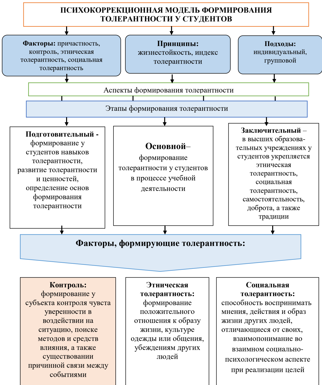
Рисунок №1. Модель формирования толерантности у студентов.