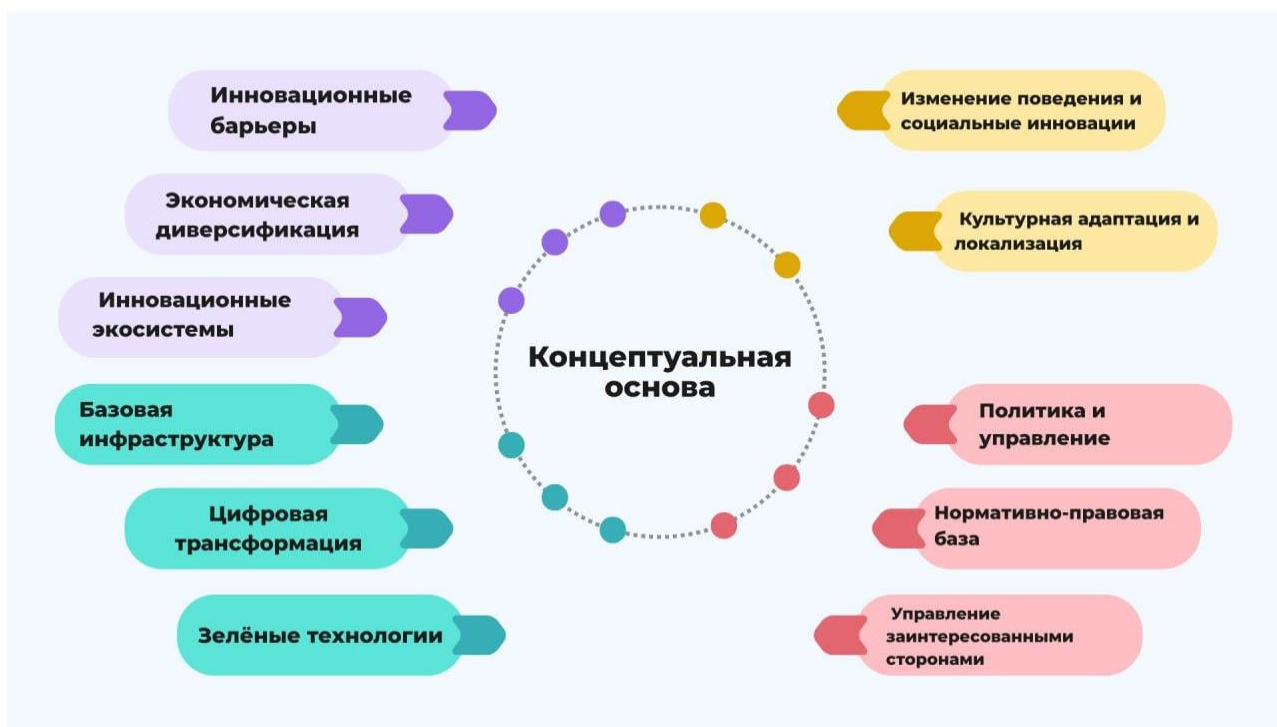
Рис 1. Концептуальная основа способов интеграции инновационных компонентов в стратегии территориального развития 53

На рисунке 1 представлена роль инновационных подходов в стратегиях территориального развития и их взаимосвязь. В основе концептуальной основы лежит идея повышения эффективности территориального управления, из которой выделяются четыре основных направления.