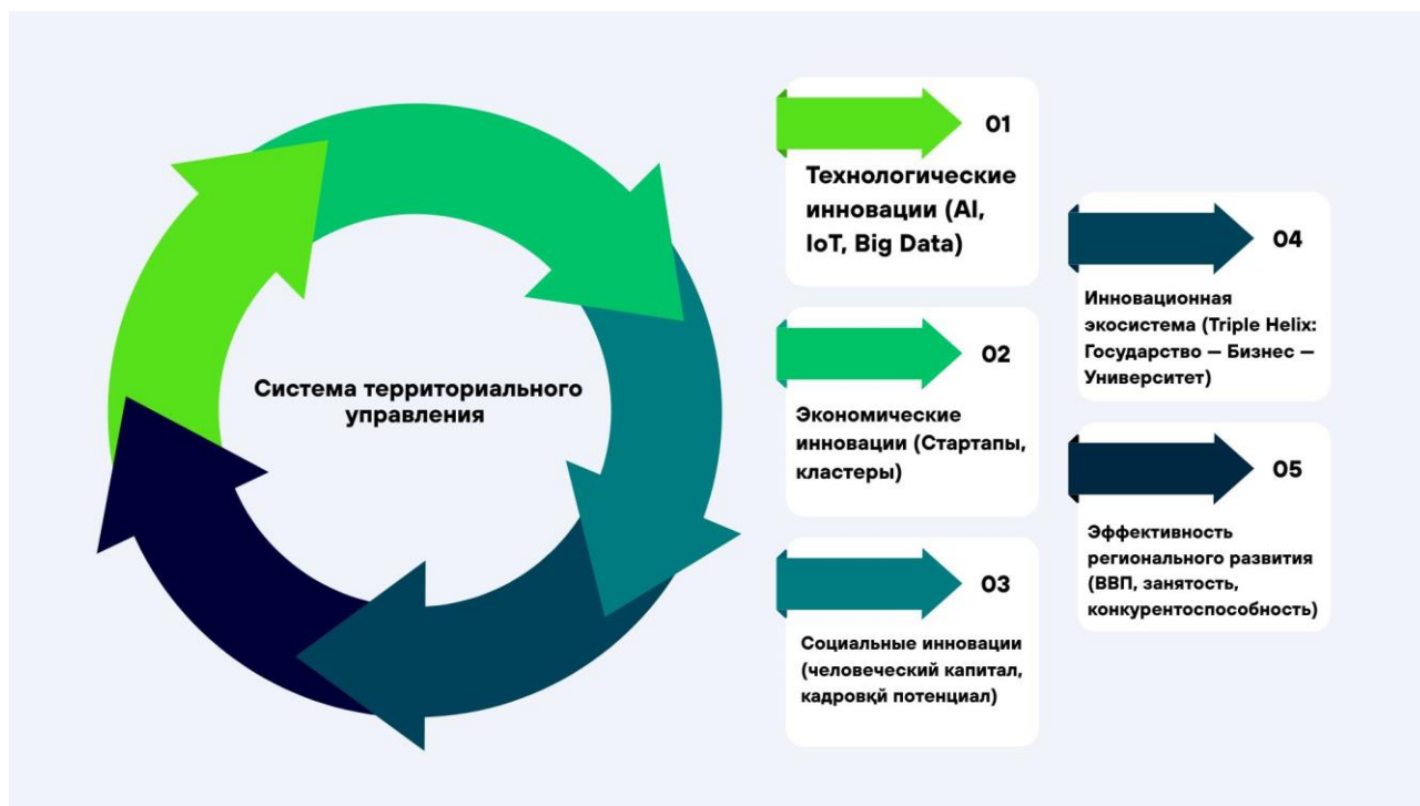
Рис 2. Механизм влияния инновационных процессов на управление социально-экономическим развитием региона 64

Проведенный анализ на основе методов Fuzzy АНР и TF-IDF позволил выделить туризм, сферу услуг и ИТ-сектор в качестве приоритетных направлений. При этом разработанная прогнозная модель показала положительную динамику территориального развития в 2025–2030 годах и выявила новые драйверы экономического роста.