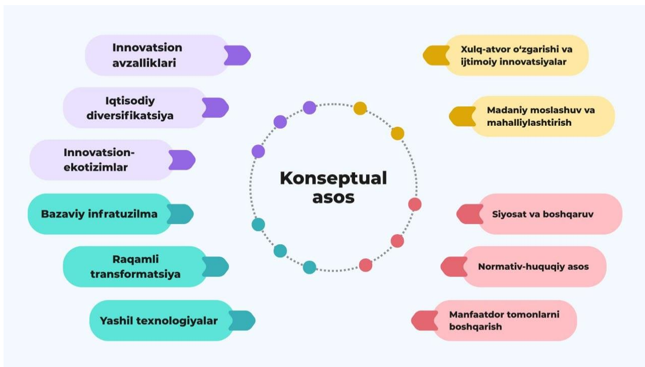
1-rasm. Hududiy rivojlanish strategiyalariga innovatsion komponentlarni integratsiya qilish usullarining konseptual asosi 21

tomondan, jamiyatning ijtimoiy barqarorligini ta'minlaydi. Ayniqsa, raqamli transformatsiya, sun'iy intellekt, IoT, GIS va "Smart City" kabi ilg'or texnologiyalarni joriy etish orqali hududlarning raqobatbardoshligi kuchayadi. Quyidagi 1-rasmda hududiy rivojlanish strategiyalariga innovatsion komponentlarni integratsiya qilishning konseptual asosiy yo'nalishlari tasvirlangan.