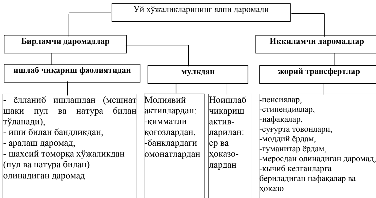
3-расм. Уй хўжалиқлари ялпи даромадларига оид чизма.