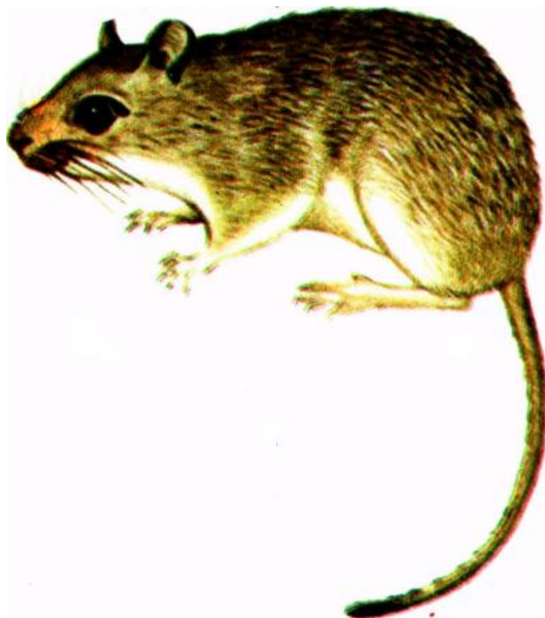
Qizil dum qumsichqon

Urchish davri mart oxiridan to oktabr o'rtalarigacha cho'ziladi. Yoz bo'yi ikki martadan to'rt martagacha bolalaydi va har safar 5—7 tadan bola tug'adi.