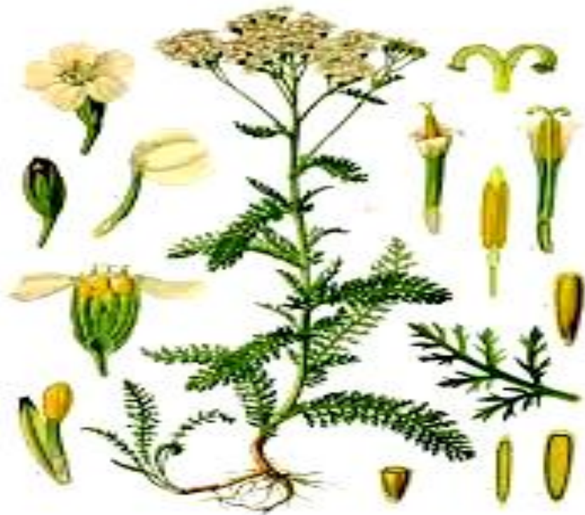
Achillea millefolium L.