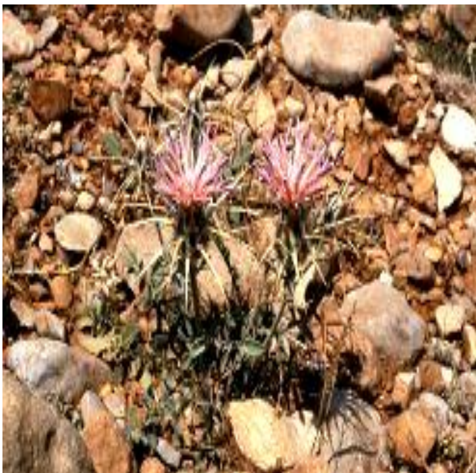
Табиатда ўсаётган бўтакўз ( Centaurea pulchella Ledeb.)