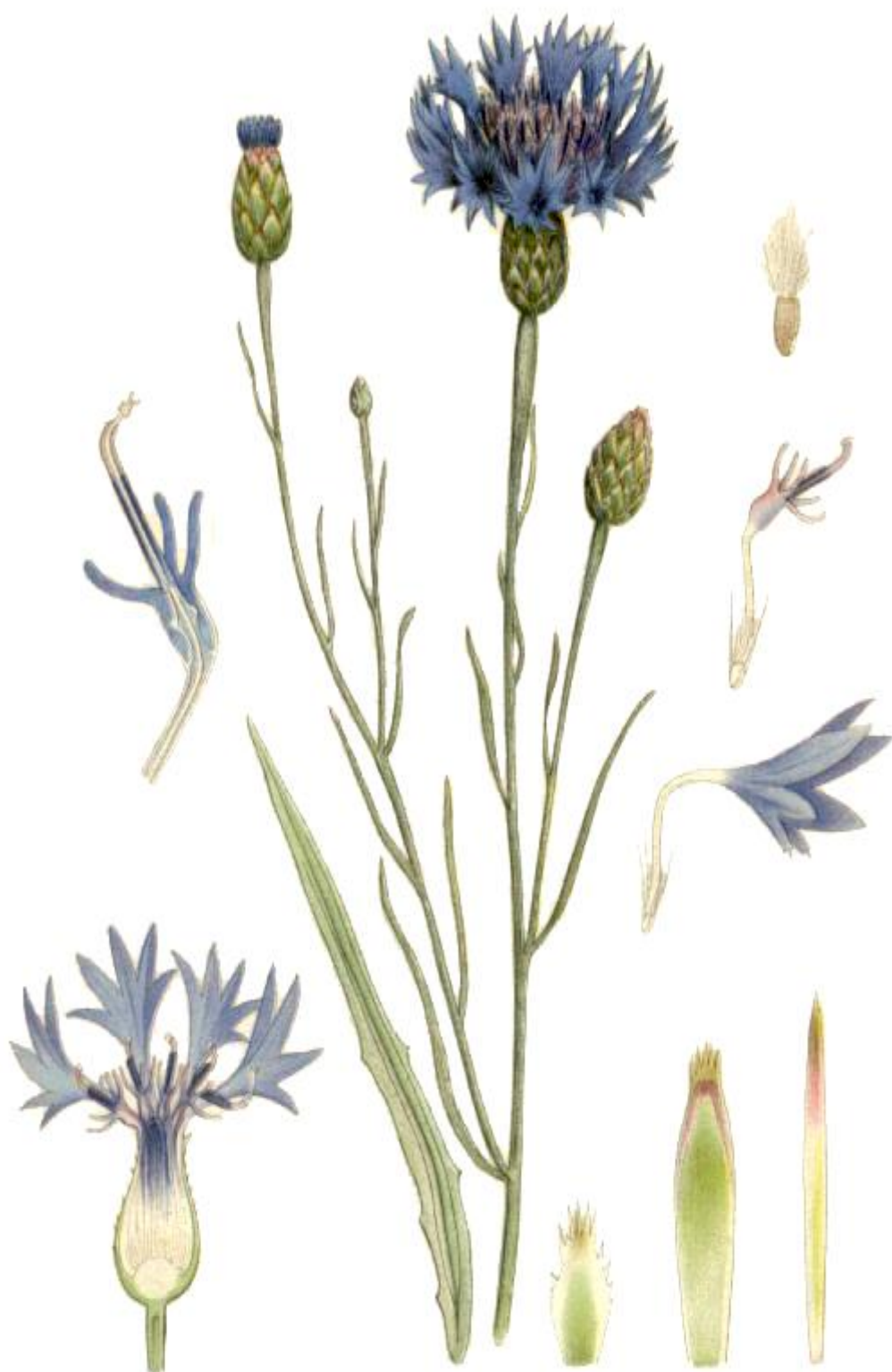
BLÄKLINT, CENTAUREA CYANUS L.