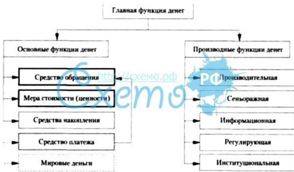
Рисунок 3. Основные и производные функции денег

Кроме того существуют производные функции денег (Рисунок 3) – это производительная, сеньоражная, информационная, регулирующая и институциональная функции денег.