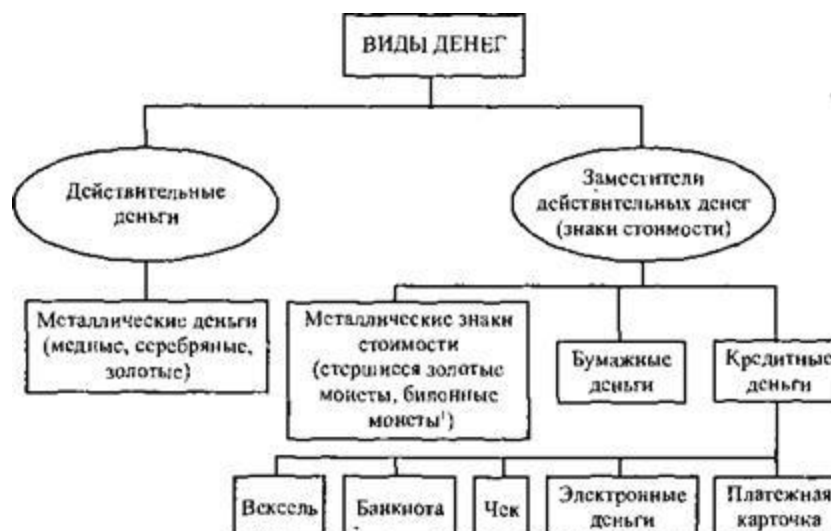
Рисунок 4. Классификация видов денег