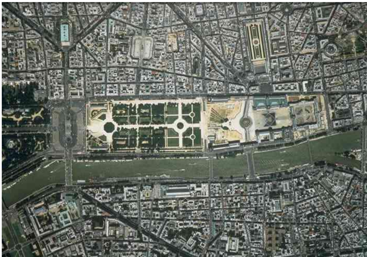
Снимок сделанный со спутника

В наши дни сад Тюильри стремительно расцветает и становится таким же символом Франции как Елисейские Поля, Эйфелева башня или Версаль.