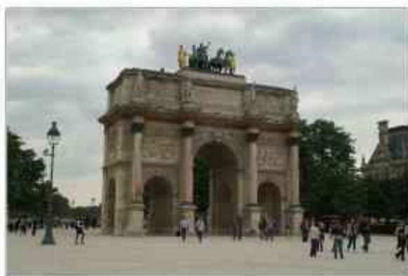
Малая триумфальная арка

Здесь так же очень много туристов, которые приходят сюда прогуляться. Парк заканчивается Малой триумфальной аркой, следом за ней располагается площадь Карусель (Place de Carrousel). Уже с площади вы увидите вход в Лувр (Musée du Louvre) - большую стеклянную пирамиду.