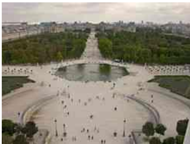
Вид Тюильри с "Птичьего полёта" видом на Лувр

Первый парк начали разбивать в 1564 году по приказанию Екатерины Медичи, пожелавшей новый дворец — Тюильри — и сад для прогулок. Поэтому парк был в итальянском стиле: 6 аллей по длине сада и 8 — по его ширине. Через 110 лет, в 1664 году, Кольбер приказал перепланировать парк, поручив это задание Ленотру.