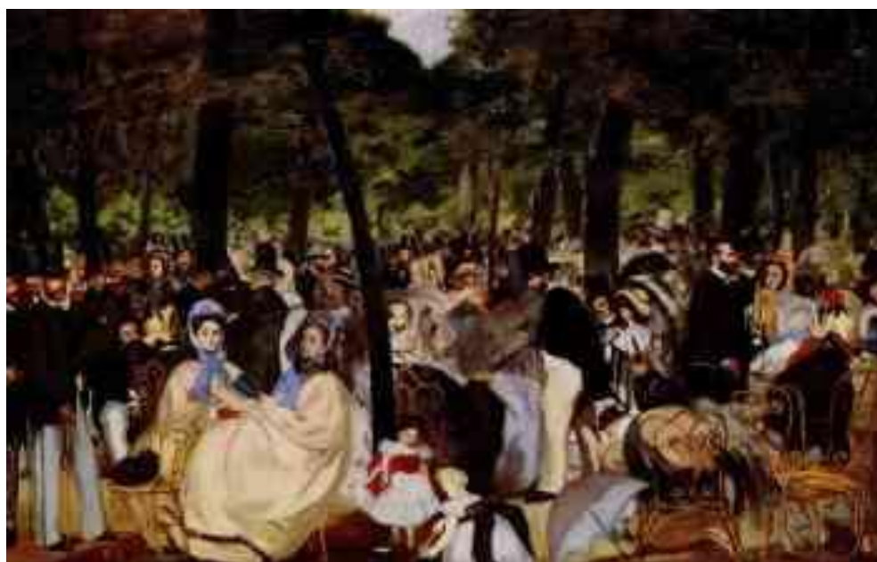
Музыка в саду Тюильри: Эдуар Мане, 1862 г., Холст, 76x118 см, Национальная галерея