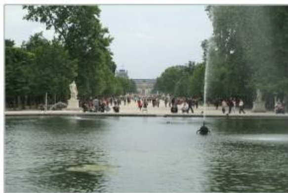
Фонтан в Саду Тюильри

Сад Тюильри (le jardin des Tuileries) - находится в центре Парижа, занимает территорию между площадью Согласия (Place de la Concorde), улицей Риволи (Rue de Rivoli), Лувром (Musée de Louvre) и Сеной. Сад занимает 25,5 га, его длина 920 метров, а ширина 325 метров. Когда-то здесь находился дворец Тюильри, а теперь - самый значительный и самый старый сад - французский парк. Французским парком обычно называют парк, характеризующийся симметричностью и регулярностью композиции, деревьями и кустарниками, которым стрижкой придана строгая геометрическая форма. Такие французские парки очень распространены при дворцах и замках.