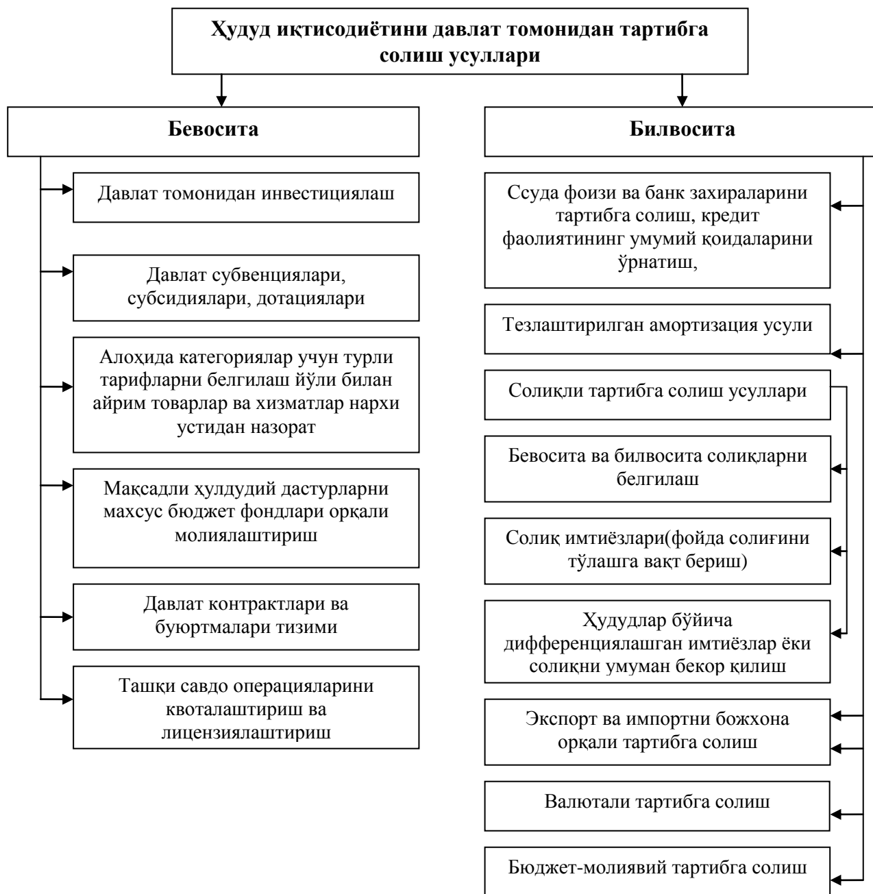
1-расм. Худуд иқтисодиётини тартибга солиш усуллари

Шунингдек, иқтисодий адабиётларда иқтисодий ва ижтимоий ривожланиш муаммоларини ечишда давлатнинг ролига нисбатан «бозор ҳамма нарсаларни тартибга солади, давлат аралашуви минимал» бўлиши лозим, деб ҳисобловчи неолибераллар ва иқтисодиётни тартибга солиш ва ижтимоий муаммоларни ечишда давлатнинг ролини кучайтириш лозим, деб ҳисобловчи эгалитардан иборат бўлган иккита қутб позициялари ўз аксини топади.