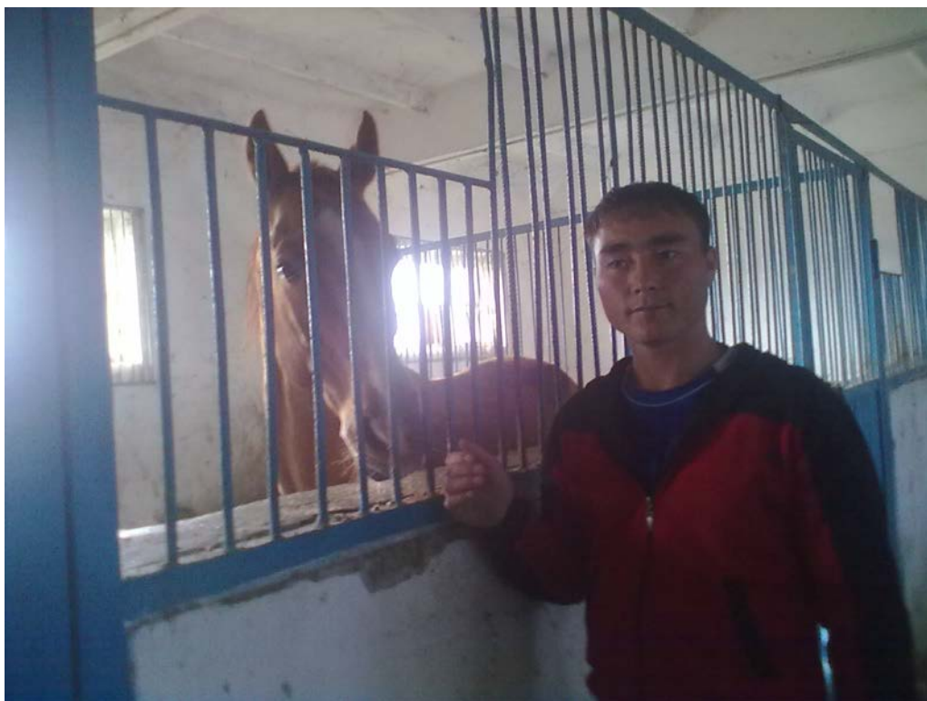
1 – расм. Отларни денникда сақлаш

отхоналарда денник, манеж (қочириш жойи), емхона, асбоб-анжомлар, эгар-жабдуқлар, навбатчилар, дағал озуқа ва тўшамалар, сунъий қочириш хонаси ва бошқалар бўлади.