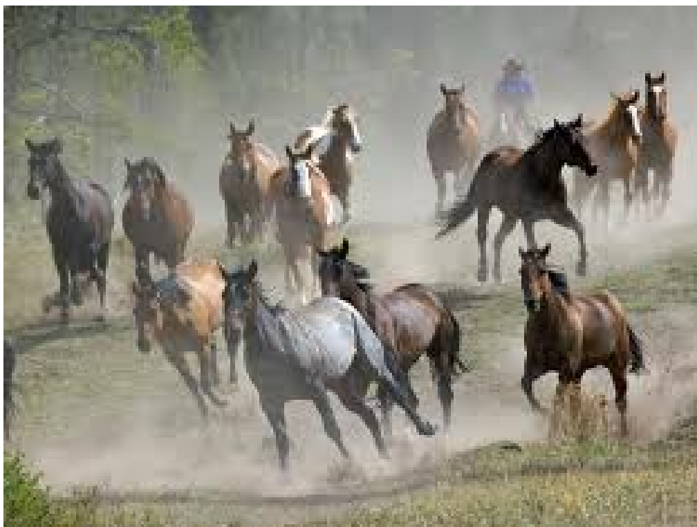
1 – расм. Отлар уюри

Отхона ва унинг ички жиҳозлари технологияни лойиҳалаш меъёрига (тлм 9-83) тўғри келиши зарур. отхоналар асосан г ва п шаклда қурилиб, стойла ва денниклар 2 қатор қилиб жойлаштирилади. Уларнинг орасидан кенглиги 2,6 - 3 м бўлган озука - гўнг йўли қилинади. От заводларида, отхоналарда озука - гўнг йўли 2 м кенгликда, девор томонидан қурилади. Отхонанинг бир қаторида 12 тагача денник, 30 тагача стойла жойлаштирилиб, бинонинг ўртасида бошқа қўшимча хоналар қилинади. Насллик отлар отхонасининг баландлиги 3 м, ишчи отлар учун 2,4 м ва товар хўжалигидаги отхоналар учун 2,7 м ва манежнинг баландлиги 4,5 м бўлади. Бинолар иссиқ, ёруғ, қуруқ бўлиши ва вентиляция яхши ишлаши керак. бир бош от учун стойла юзаси 5 - 5,5 м 2 , денник эса 10,5 - 12 м 2 , той гурухлари учун катаклар 5 - 7 м 2 юзага эга бўлиши керак. Ишчи отлар сақланадиган жойлар (стойла) да отлар ораси ёғоч-болор ёки девор билан ажратилади. Унинг баландлиги охур томондан 1 м, орқа томондан 65 см бўлади. денникларни ажратиб турадиган тўсиқлар пишган ғиштдан, панжарадан ёки яхши текисланган қалинлиги 5 см лик тахтадан 1,4 м баландликда қилинади. Охур стойланинг кенглигига тенг узунликда қурилиб, отлар дағал озуқаларни