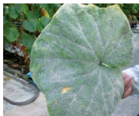
12-rasm Un shudring kasalligi qavun

Bu kasallikni tarqalish o'choqlarini aniqlash, uni bioekologik xususiyatlarini o'rganish va unga qarshi kurashishda samarali usullar ishlab chiqishga imkon yaratadi.