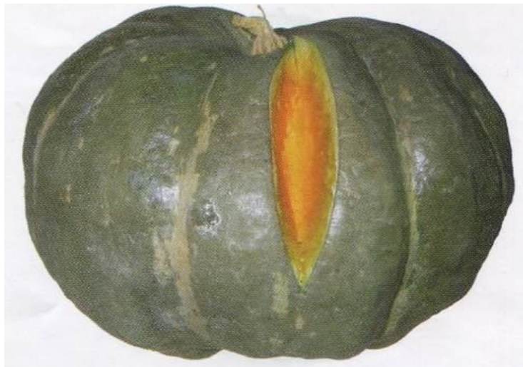
4-rasm Ispanskaya 73

Ispan qovog'i 73 kechpishar qovoq navi, hosidorligi o'rtacha, tashishga chidamli tam sifati yuqori, hosidorligi o'rtacha. palagi uzun mevasi yumaloq yassi maydaroq, qirrali vazni 3 3.8 kilogramm keladi. Tusi och kulrang yoki ko'kish. Mevabandi silindrsimon, yumshoq. Eti to'q sariq yoki sariq rangda.