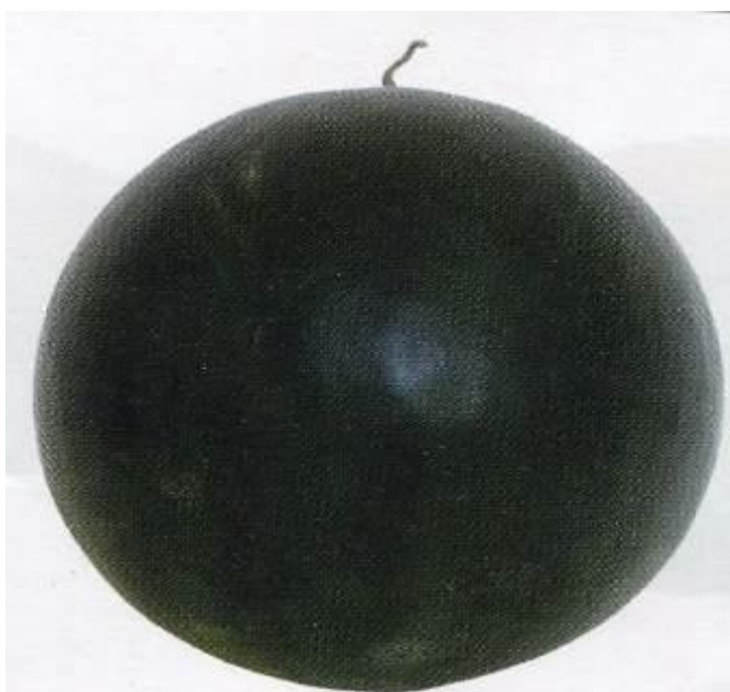
10-rasm. Qo`ziboy 30

Qo`ziboy 30 (8-rasm) Kechpishar nav, o`suv davri 120-130 kun. Palagi katta, poyasi uzun. Mevasi yumaloqsimon, yuzasi silliq, yashil, ba`zan qoramtir rangli, yuzida chetlari jimjima ingichka kam bilinadigan tasmalar mavjud, vazni 5,0-6,0 kg, po`sti qattiq. Eti och qizil, sersuv shirali, ba`zan tolali, degustatsion bahosi 3,5-4,7 ball. Tarkibidagi quruq modda miqdori 7,2 %, qand moddasi miqdori 6,8 %. Hosildorligi 35-40 tonna/hektar. Qishda yaxshi saqlanadi. Uzoq masofalarga jo`natishga yaroqli, qurg`oqchilikka chidamli.