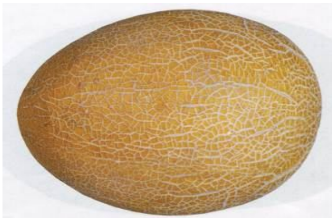
5-rasm. Baytiqo`rg`on 424

Baytiqo`rg`on 424 (3- rasm)O`rtapishar nav, o`suv davri 85-93 kun. Palagi o`rta, bargi buyraksimon, o`rta hajmli. Mevasi cho`ziq tuxumsimon, vazni 4,0-6,0 kg, yuzasi silliq, yorqin sariq rangli, to`ri to`la, po`sti qattiq. Eti oq, o`rta qalin, o`rta tolali, karsillaydigan, shirali, shirin. Tarkibidagi qand moddasi miqdori 7,3-9,4 %. Hosildorligi 25-35 tonna/gektar. Tashishga chidamliligi va saqlanuvchanligi o`rta.