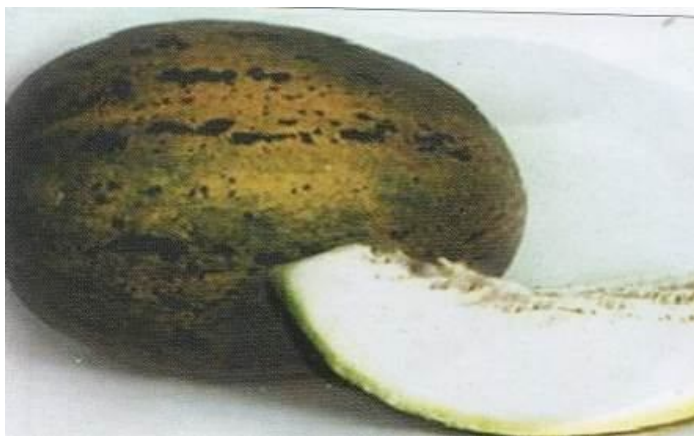
2-rasm. Zar - gulobi

« Zar Gulobi » – o'rta kechpishar, nihollari unib chiqqandan mevasi yetilguncha bo'lgan davr 100 kun. palagi kuchli o'sadi, bargi yuraksimon, cheti qirrali, ko'm-ko'k rangda. Mevasi tuxumsimon, vazni 4–5 kg. Sirti silliq, meva bandi tomoni biroz segmentlashgan, shu qismi to'r bilan qoplangan. Mevasining rangi sariq. po'stining qalinligi o'rtacha. Eti oq, etdor – 7–8 sm, yarimqarsillama, saqlov davrida eti yumshoq, sersuv, og'izda eruvchan bo'ladi. Meva tarkibidagi qand miqdori 14–15%. Hosildorligi 30–35 t/ga. Uzoq masofaga tashishga chidamli. Buxoro, Xorazm viloyatlarida iqlimlashtirilgan. Boshqa mintaqalarda ham ekish mumkin.