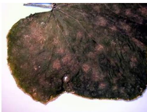
11-rasm Un shudring kasalligi qavun (gerbariy)

Bu ekinlarni ekilgan dalalarda turli xil kasalliklar tag'sirida xosil sifati buziladi, xosildorlik 30 – 40 % gacha kamayadi. Xozirgi kunda Xorazm viloyati sharoitining ayrim fermer xo'jaliklarida un – shudring kasalligi paydo bo'lishi kuzatilmoqda.