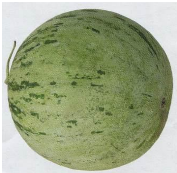
8-rasm. Mramorniy 2150

Mramorniy 2150 ( 6-rasm) O`rtapishar nav, o`suv davri 100-105 kun. Palagi o`rtacha, yon shox va barglar soni o`rtacha. Bargi konussimon, yashil rangli. Mevasi sharsimon, o`rtacha, vazni 2,5-3,5 kg, yuzasi silliq, bir-biridan bir xil masofada joylashgan marmar gullari mavjud, tasmalar meva bargi atrofida zichlashadi, po`sti qattiq. Eti malinarang, sersuv shirali. Tarkibidagi quruq modda miqdori 7,9 %, qand moddasi miqdori 6,9 %. Hosildorligi 27-30 tonna/gektar.