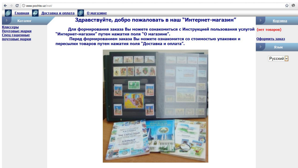
6-расм. «Ўзбекистон почтаси» АЖнинг расмий веб сайти, Интернет магазин блогини умумий қурилиши

рўйхатга олинувчи қирувчи вачиқувчи тезкор почта жўнатмалари ҳақида интернет орқали маълумот олиш.