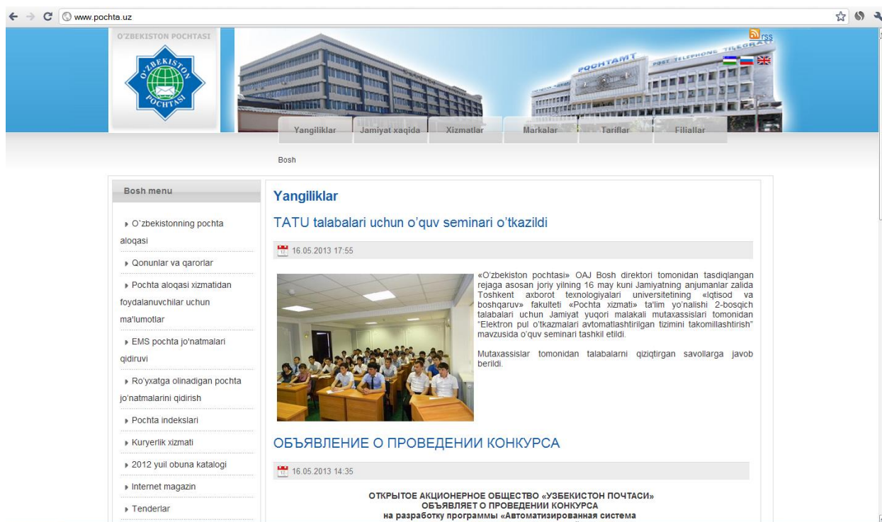
5-расм. «Ўзбекистон почтаси» АЖнинг расмий сайти

Почта алоқаси соҳасида «Ўзбекистон Почтаси» АЖ Халқаро почта филиалида универсал почта хизматлари бозорида монополист ҳисоблансада, кўшимча хизмат турлари бўйича кўрадиган бўлсак, кучли рақобатга дуч келамиз, жумладан курьерлик хизматлари бўйича 21 дан ортиқ курьерлик ташкилотлари фаолият юритмоқда, пул жўнатмалари бўйича эса 20 дан ортиқ банклар, коммунал тўловларни қабул қилиш бўйича электрон тўловлар хизматини кўрсатувчи ташкилотлар фаолият олиб бормоқда. Соҳанинг ривожланиши давлатимизнинг мустақиллик йилларида кенг йўл очиб берилиши ва замонавий ахборот воситаларининг кириб келиши билан баҳоланади. Бугунги кунда почта алоқасида 3та веб-сайт ( www.pochta.uz , www.fergana-pochta.uz ва www.xorazmpochtasi.uz ) фойдаланувчиларга хизмат кўрсатиб келмоқда.(5- расм)