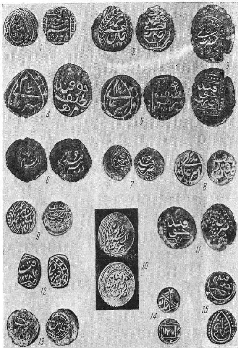
Рис. 2. Монеты Мухаммеда-Умара