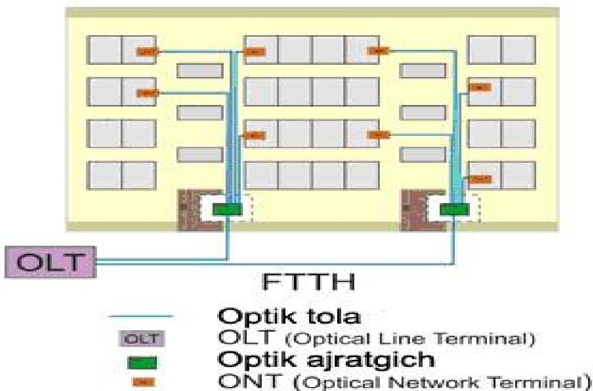
2-rasm. FTTH texnologiyasini tashkil qilish sxemasi