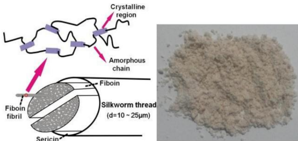
Рис.1. Порошкообразный фиброин

Следующий процесс гидролиза проводили нетрадиционным способом. При этом гидролиз проводится под воздействием сверх высоко частотного излучения. Процесс гидролиза проводили на микроволновых печах ( \nu = 2450\text{MG} ) и были выбраны оптимальные условия для этого процесса. Получается порошкообразный продукт фиброина. Полученный порошок отфильтровывают и тщательно промывают дистиллированной водой до нейтральной среды. При этом разрушение макромолекулы закончится в 4-4,5 раза быстрее обычного метода гидролиза (рис.1).