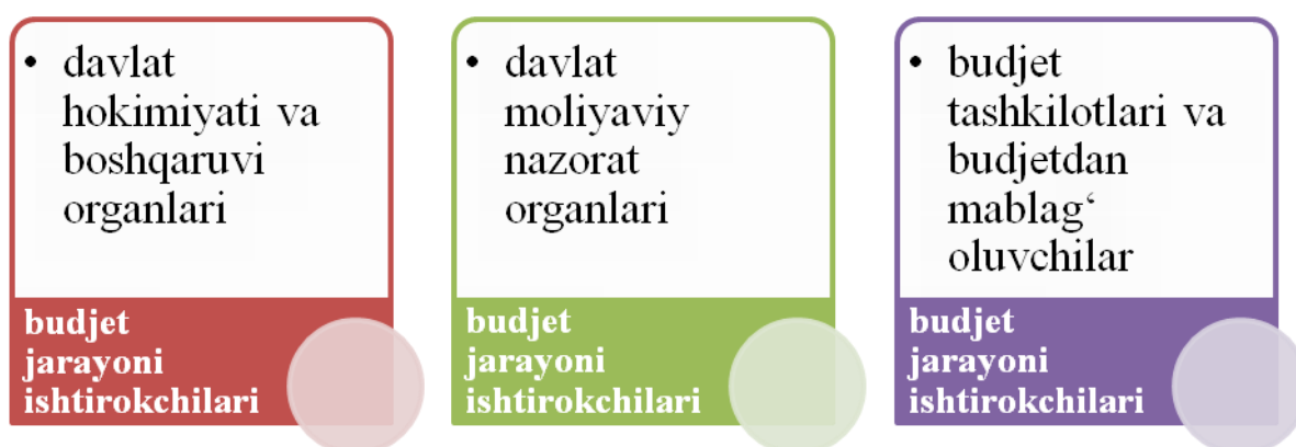
2-rasm. Byudjet jarayoni ishtirokchilari 2