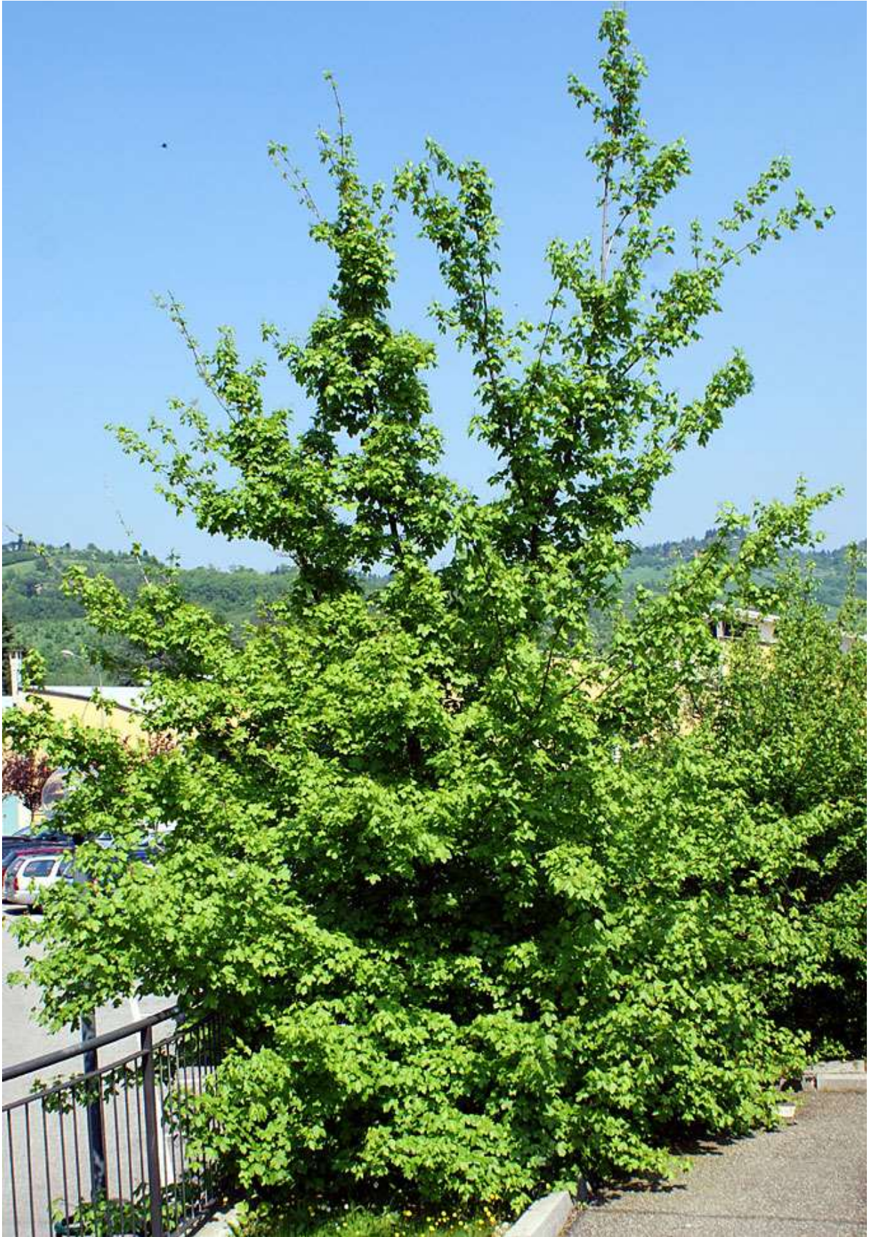
3-rasm. Dala zarangi ( A.campestre L.) umumiy ko'rinishi.