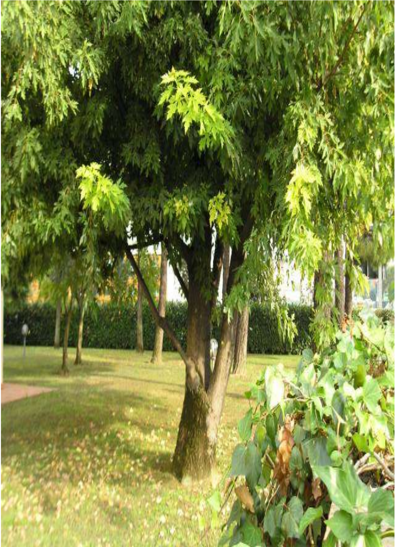
4-rasm. Shakar zarang ( A. saccharinum L.) tanasini umumiy ko'rinishi.