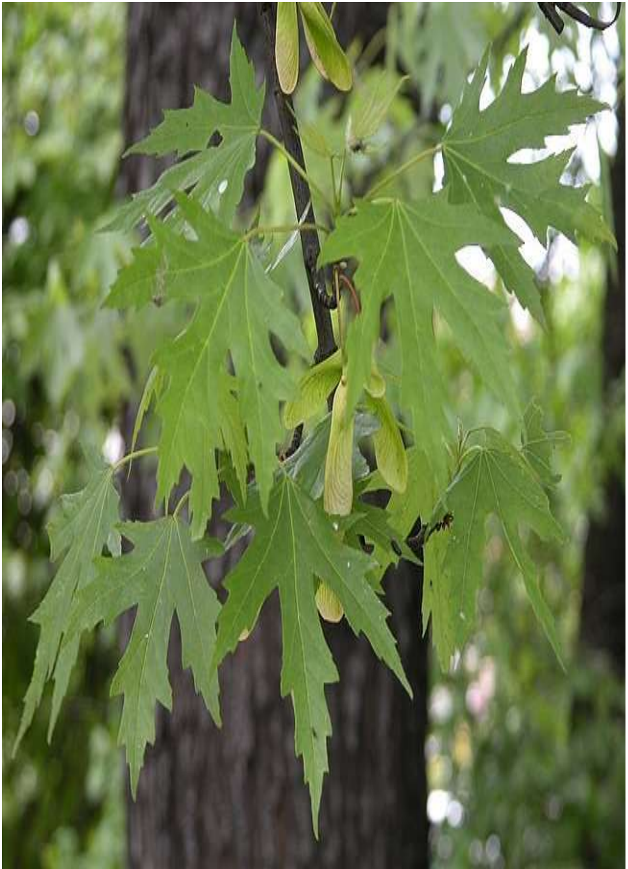
5-rasm. Shakar zarang ( A. saccharinum L.)ni bargli va mevali shoxi.