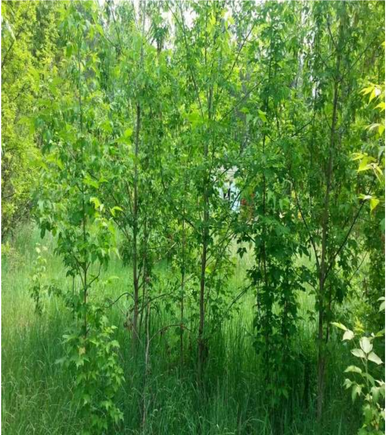
13-rasm. Shumtolbarg zarang ( A.negundo L. )