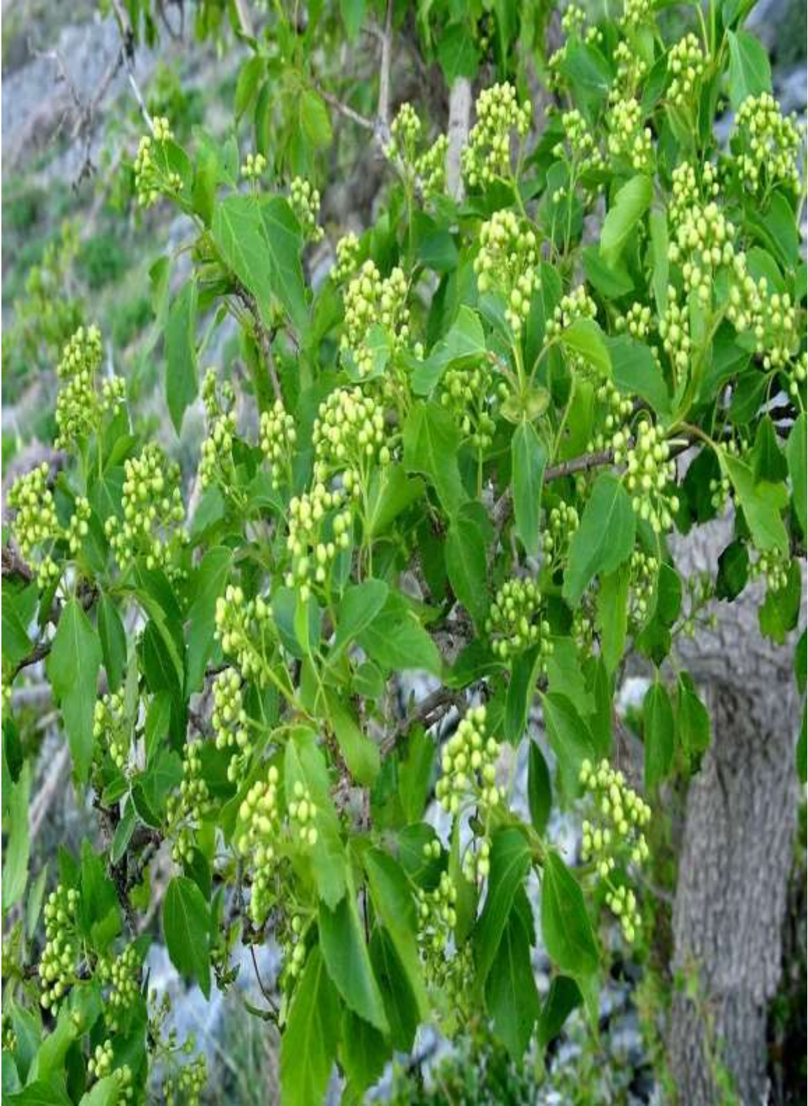
8-rasm. Semenov zarangi ( A. semenovii Rgl) gulli shoxi.