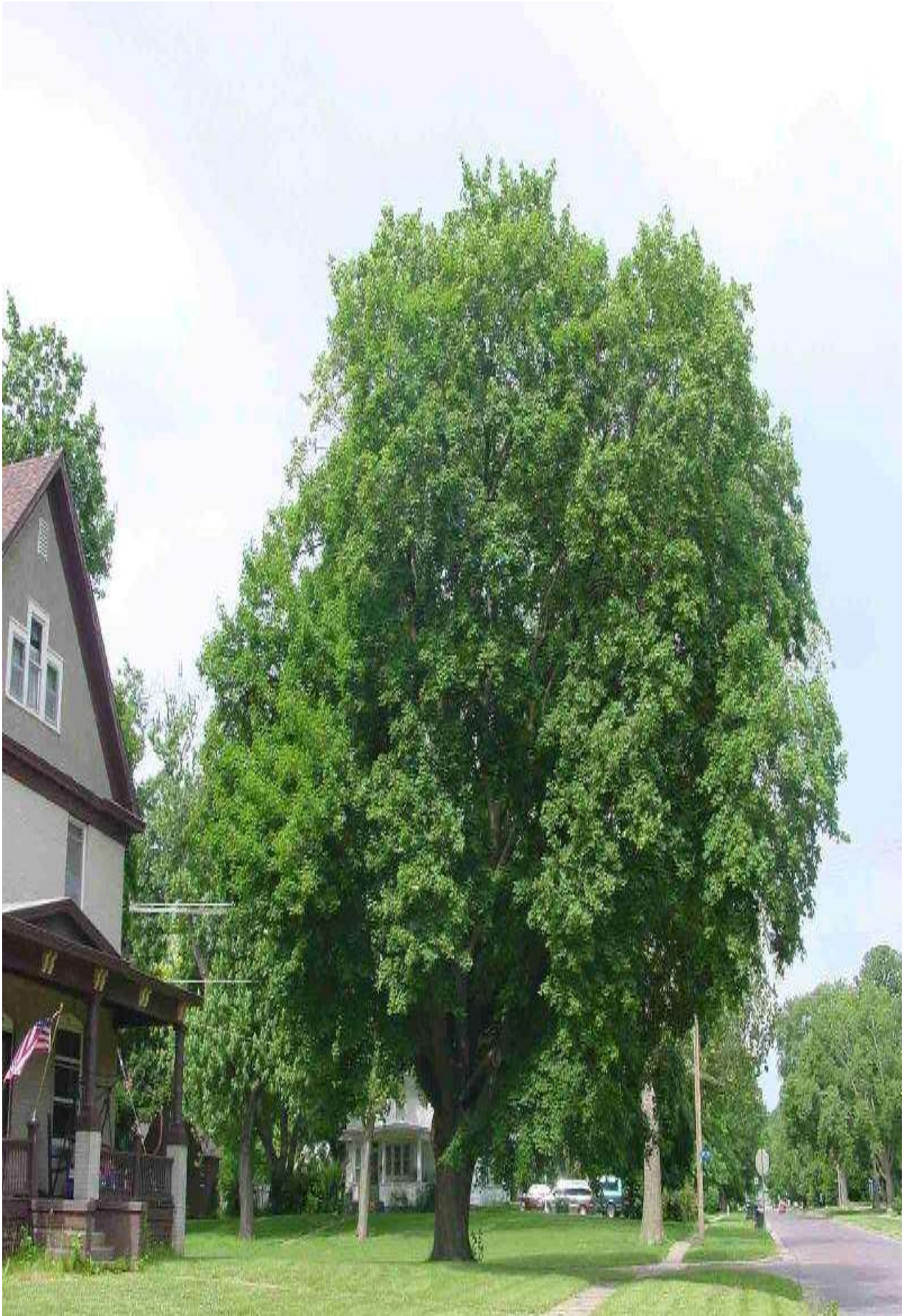
7-rasm. Chinorbarg zarang ( A.platanoides L.) umumiy ko'rinishi.