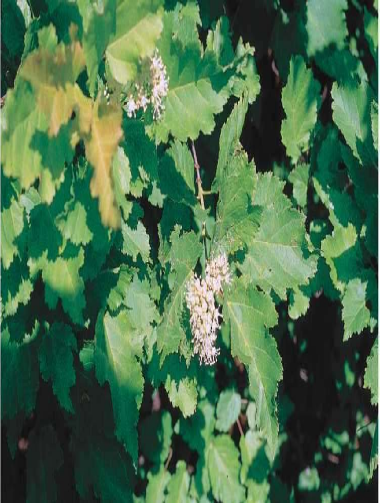
10-rasm. Tatar zarangi ( A. tataricum L.) gulli shoxi