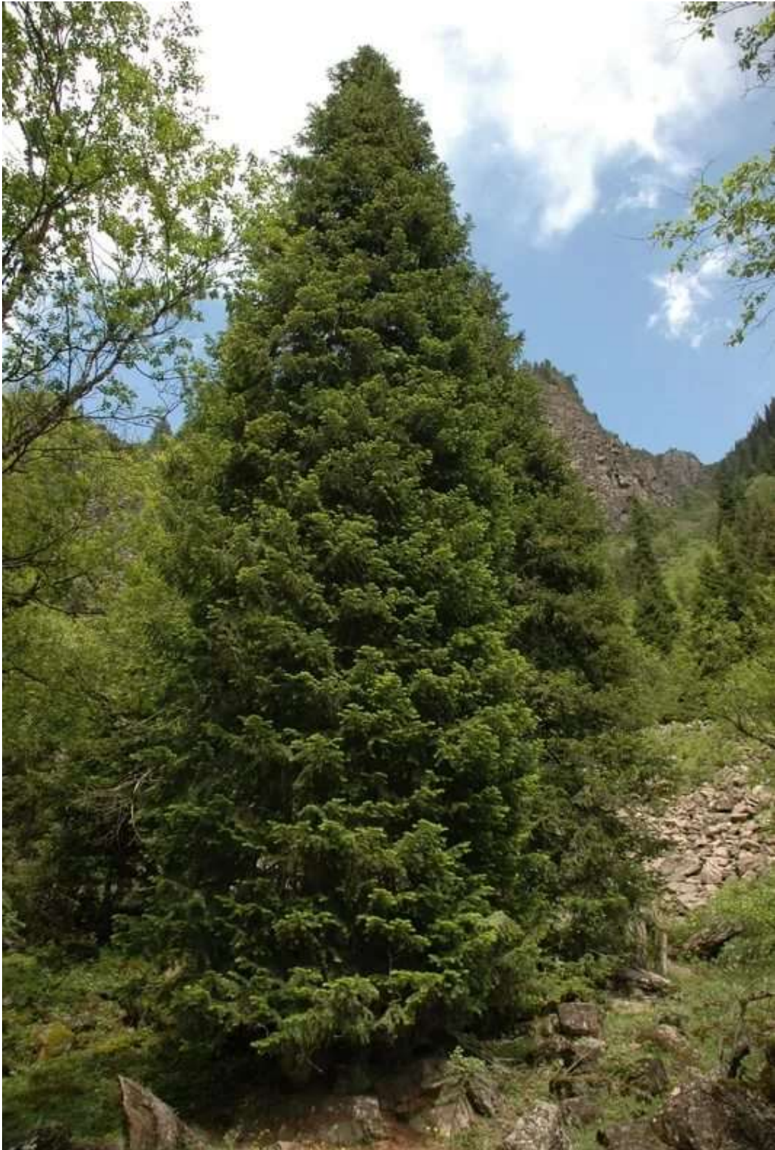
9-rasm. Semenov zarangi ( A. semenovii Rgl) gulli shoxi