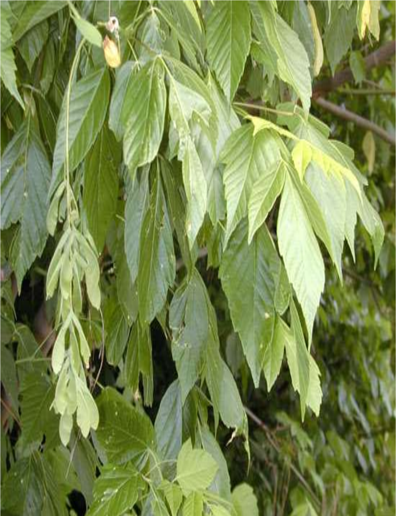
12-rasm. Shumtolbarg zarang ( A.negundo L.)