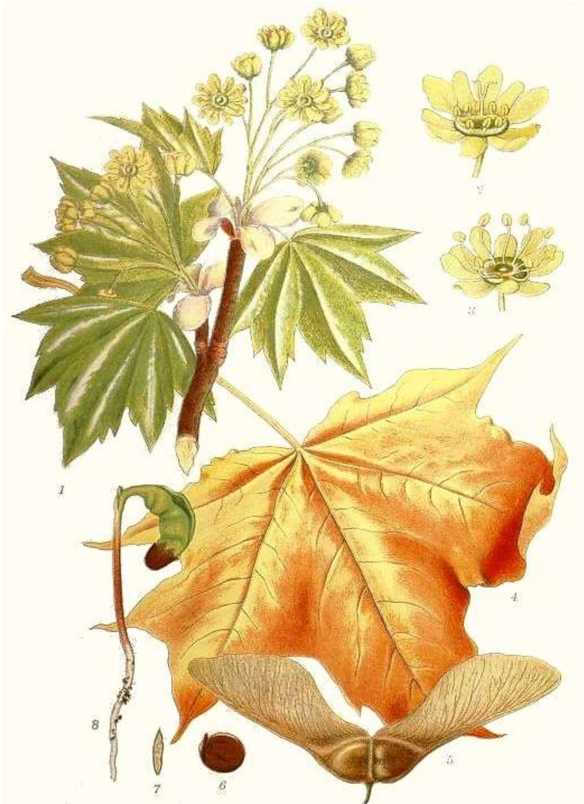
6-rasm. Chinorbag zarang ( A.platanoides L.) 1) gul, barg va mevali novdasi; 2-3) gul va changchilari; 4) bargi; 5) mevasi; 6-8) urug'I va undan ungan nixol.