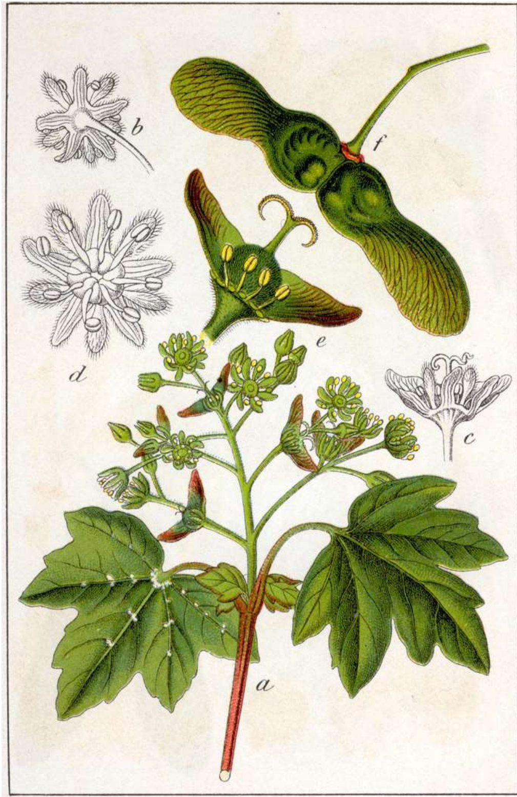
2-rasm. Dala zarangi ( A.campestre L.) a) gul va mevali novdasi; b, c va d) gulining orqa, yonbosh va orqa tomondan ko'inishi; e va f) mevasi.