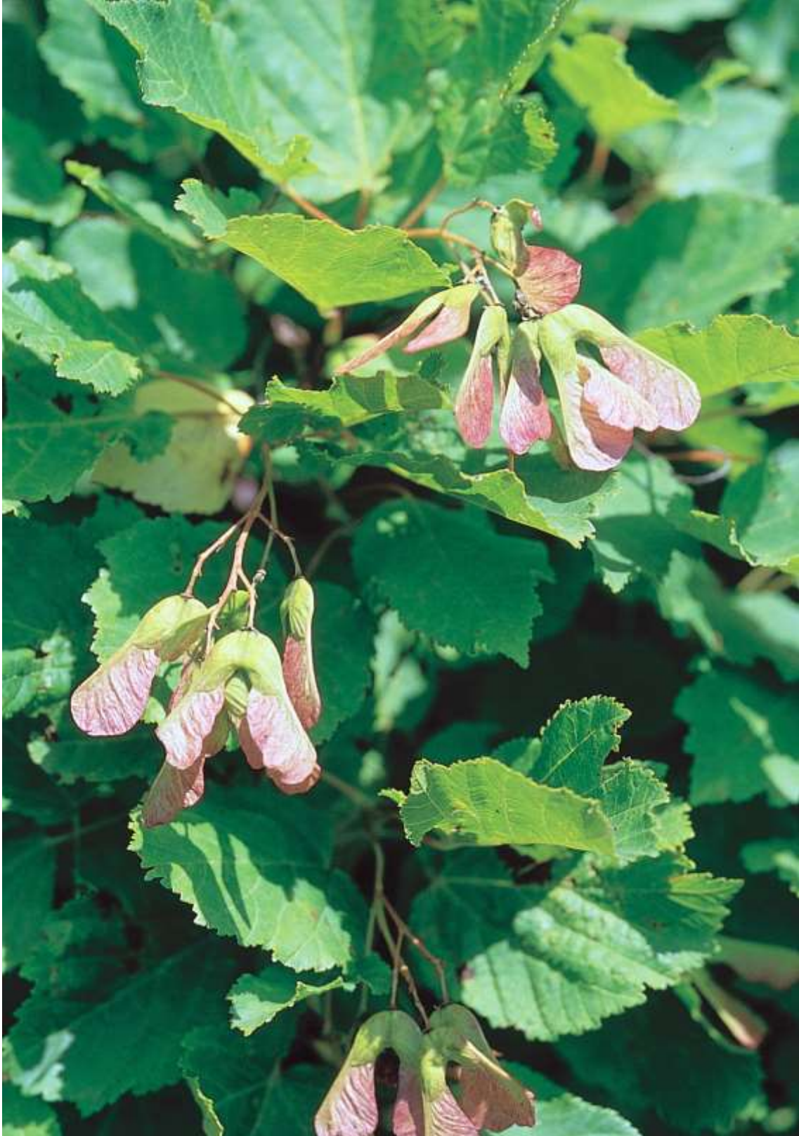
11-rasm. Tatar zarangi ( A. tataricum L.) mevali shoxi