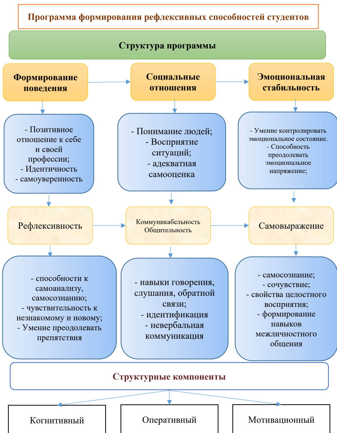
Рисунок 1. Модель развития рефлексивной способности студентов

2) чувственно-эмоциональный (отношение к себе) – определение самооэффективности и отношения к себе как педагогу на основе оценивания личностных качеств (творчества, вежливости, организованности), важных для обучающегося как субъекта деятельности; межличностные отношения (способность связывать свои цели и действия с целями и действиями других, вырабатывать общую позицию сотрудничества, устанавливать гуманистические коммуникативные отношения с другими людьми); профессиональное отношение и оперативно-деятельностные характеристики, профессиональное отношение и