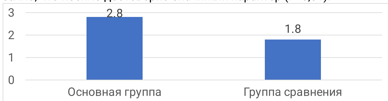
Рис. 1. Показатели по шкале qSOFA у детей, принявших участие в исследовании.

Показатели по шкале qSOFA в основной группе (рис. 1) в среднем составили 2,8 \pm 0,01 балл, тогда как в группе сравнения – 1,8 \pm 0,01 балла, что носило достоверно значимый характер ( P < 0,01 ).