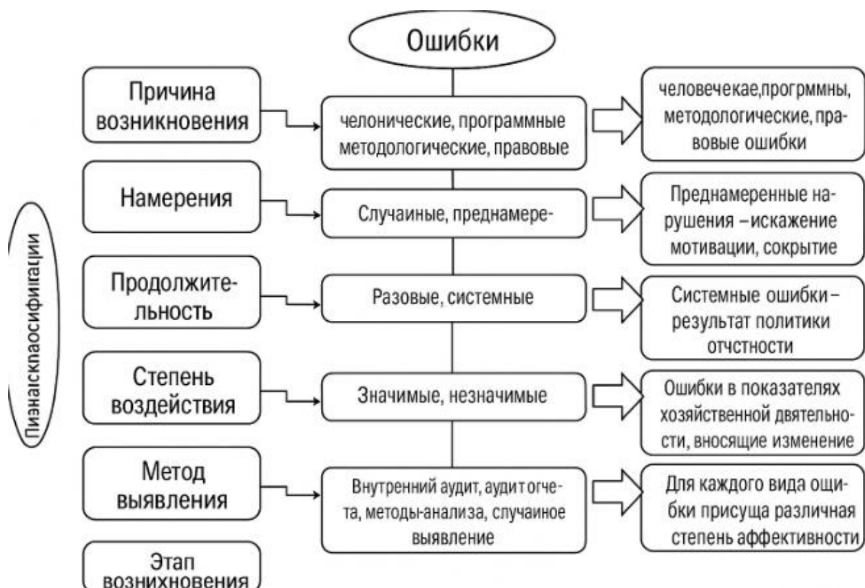
Рисунок 2. Критерии классификации ошибок и их типичные проявления 16

С помощью этих классификаций аудиторы могут сформировать совершенный подход к полному выявлению ошибок, пониманию механизма их возникновения и выбору методов их исправления. Правильная классификация ошибок - основной стратегический шаг бухгалтерского контроля. Поэтому правильная оценка риска ошибок в аудиторской деятельности, определение интенсивности аудита по отношению к ним напрямую зависит от их классификации.