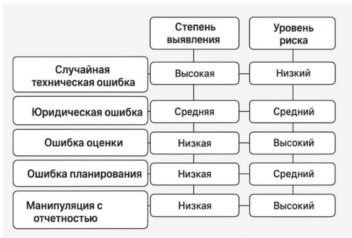
Рисунок 1. Основные виды ошибок и искажений в бухгалтерском учете 15

Такие классификации играют важную роль не только в анализе отчетов, но и в формировании систем предварительного выявления и исправления ошибок. Когда управленческие решения неправильно формируются из-за ошибок, это обычно приводит не только к финансовым потерям, но и к таким последствиям, как нехватка ресурсов в операционной деятельности, избыточное или недостаточное хранение запасов, неправильное использование производственных мощностей и чрезмерные расходы. Например, ценовая политика, основанная на неправильно рассчитанной производственной себестоимости, может не приносить прибыли, или чрезмерная закупка ненужных запасов может ограничить денежный поток.