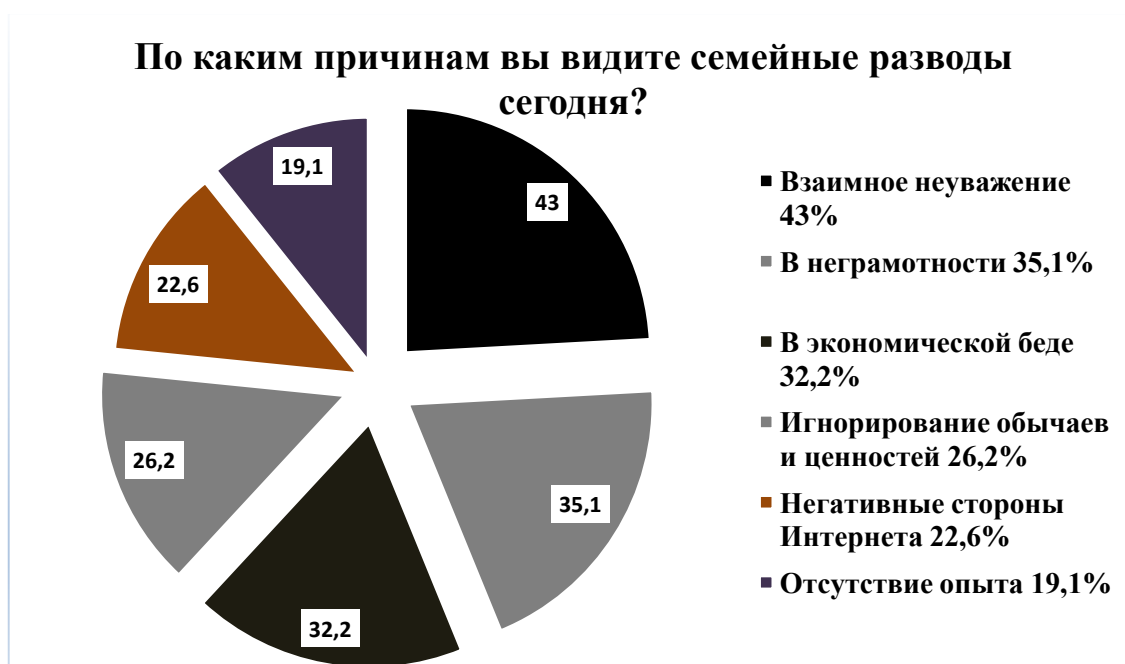
Рисунок 1. В каких причинах вы видите причины семейного развода на сегодняшний день?

с другими районами. По состоянию на май 2022 года, среди лиц моложе 30 лет развод по семейным обстоятельствам составляет 3 674. В связи с этим, в целях изучения проблемы и поиска ее решения, исследования анализа причин, приведших к данной ситуации, и вывода из них правильных выводов, на тему «Социально-философские факторы формирования нравственной культуры семьи в Узбекистане» в регионах, Республике Каракалпакстан, а также в городе Ташкенте среди 826 респондентов был проведен социологический опрос состоящий из 25 вопросов, касающиеся таких понятий как «семья», «культура семьи», «этика семьи», «этическая культура семьи».