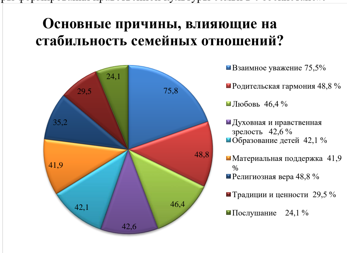
Рисунок 2. Основные причины, влияющие на стабильность семейных отношений?

В данной главе исследователем изложен анализ результатов социологического опроса 826 респондентов в регионах, Республике Каракалпакстан и городе Ташкенте на тему «Социально-философские факторы формирования нравственной культуры семьи в Узбекистане».