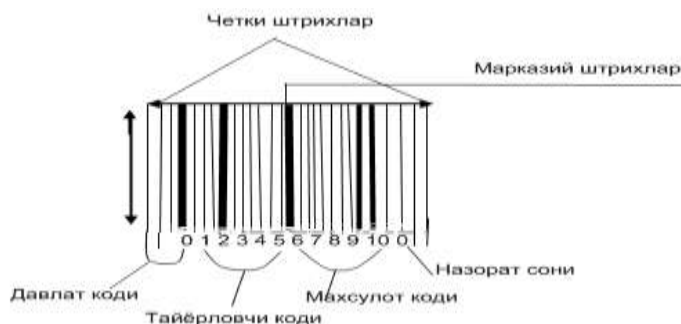
1-расм. 13 разрядли EAN коди.

Штрихли кодларнинг элементлари штрихлар ва оралиқлар, кишилар ўқийдиган белгилар ва ёруғ зоналардан ташкил топган. Булардан штрихлар ва оралиқлар маълумотларни кодлаш шаблонини белгилайди (аниқлайди). Инсон ўқийдиган белгилар бу - штрихлар ва оралиқлар ёрдамида кодланган ахборотлар (маълумотлар)ни кишилар ўқиши учун матн сифатида берилишидир. Ёруғ зоналар эса штрихлар ва оралиқларгача ва ундан кейинги тоза майдон бўлиб, бу зоналарнинг мавжудлиги штрихли кодни ўқиш учун энг зарур элементларидан бири бўлиб ҳисобланади (1-расм).